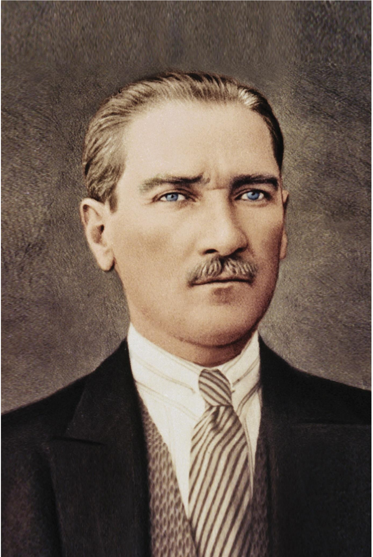
Mustafa Kemal ATATÜRK