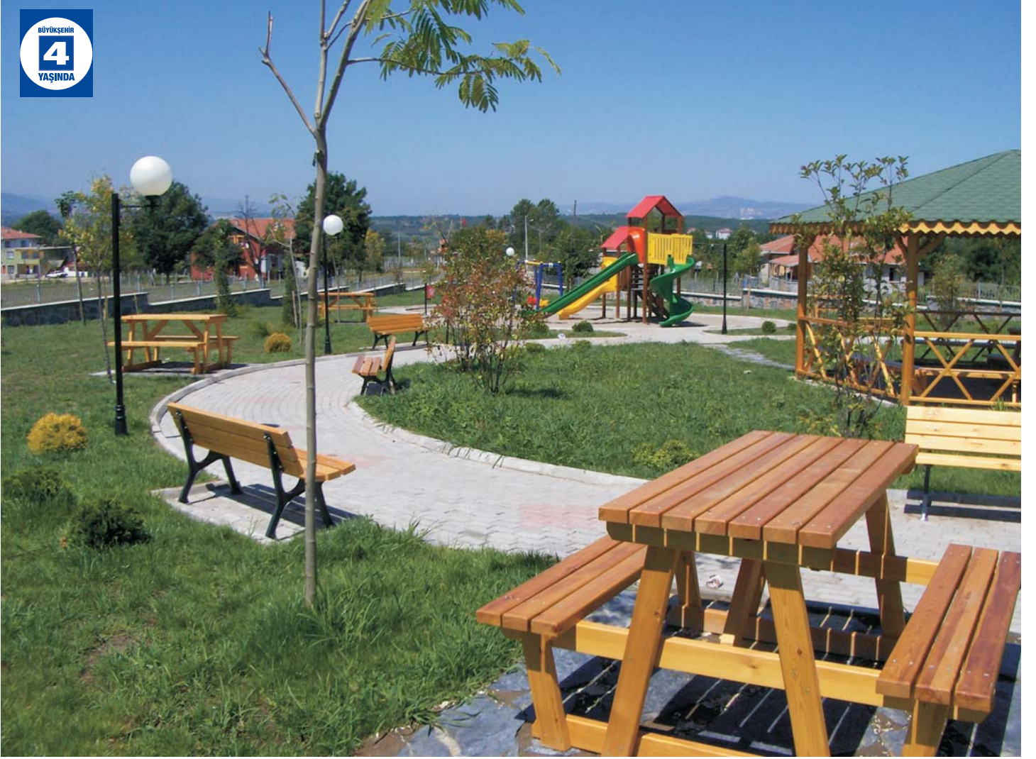
Acısu Semt Parkı