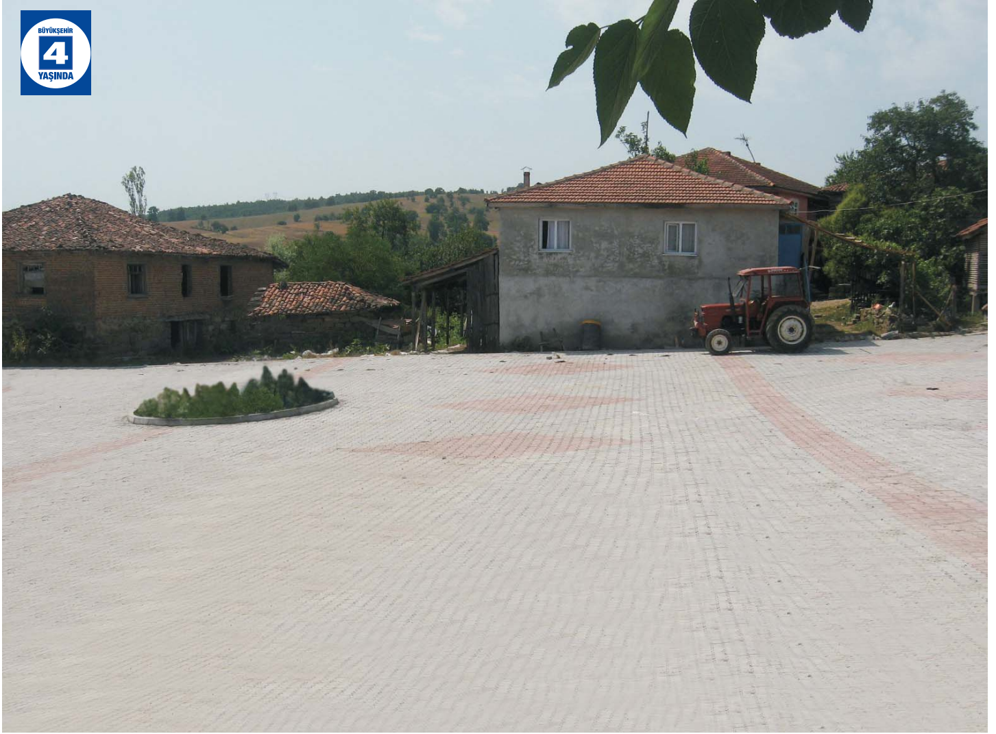
Kartep'e'de Köylere İnşaat Malzemesi Yardımı ve Meydan Düzenlemesi