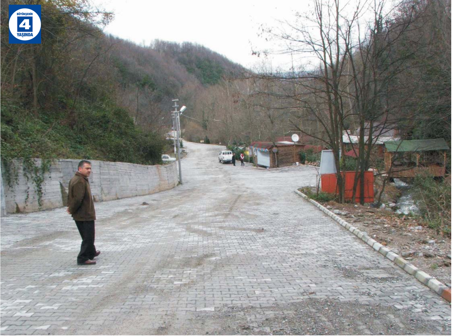
Maşukiye Alabalık Vadisi Parke Yol Yapımı