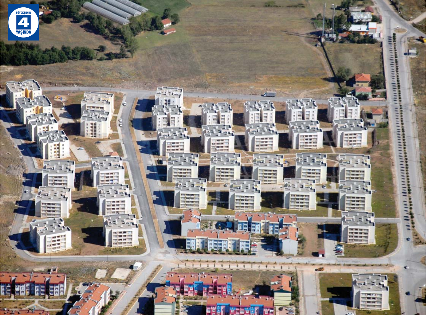
Arslanbey Taçyaprak Konutları