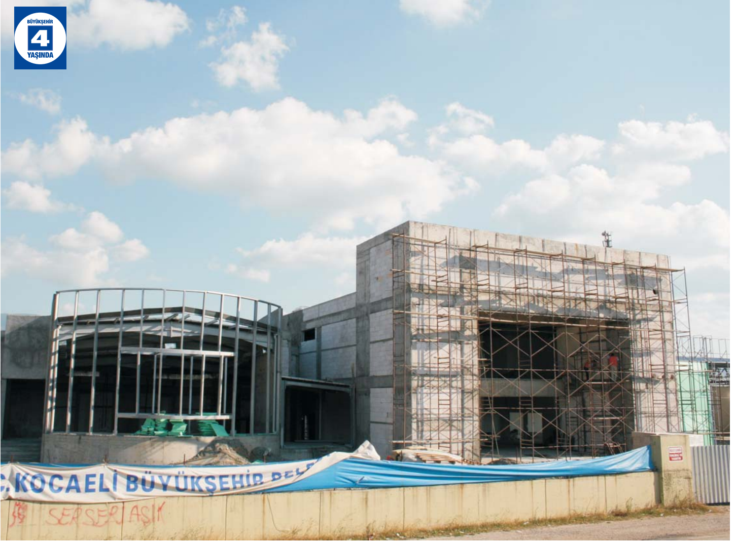
Köseköy Kültür Merkezi