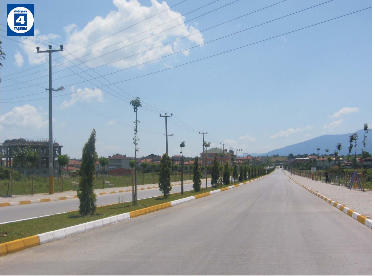
Uzunçiftlik Çevre Düzenlemeleri