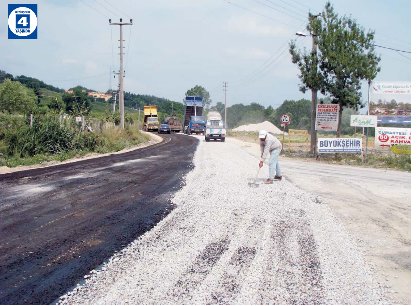
Kartepe Genelinde Üstyapı Düzenlemeleri