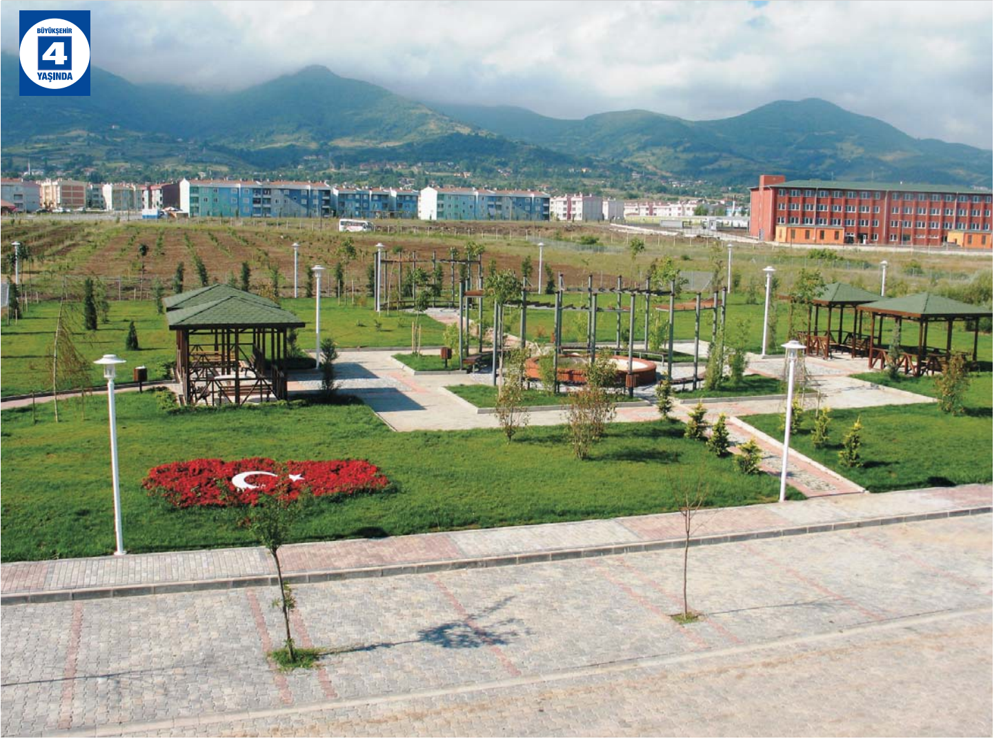
KOÜ Arslanbey MYO Bahçe Düzenlemesi