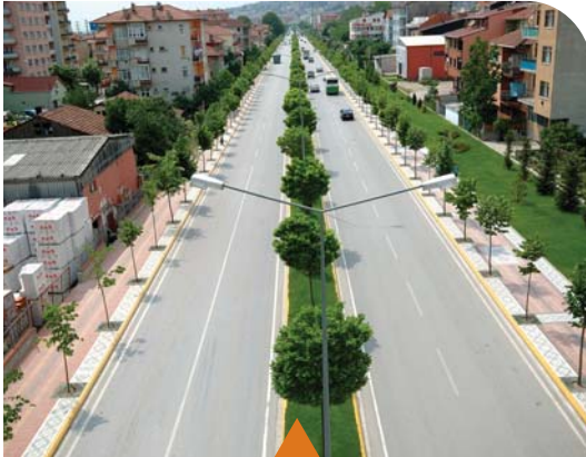
MESELA ŞEHİT RAFET KARACAN BULVARI