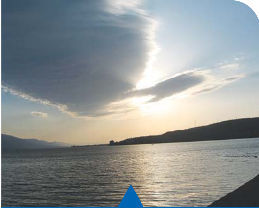
MESELA YENİ SU KAYNAKLARI