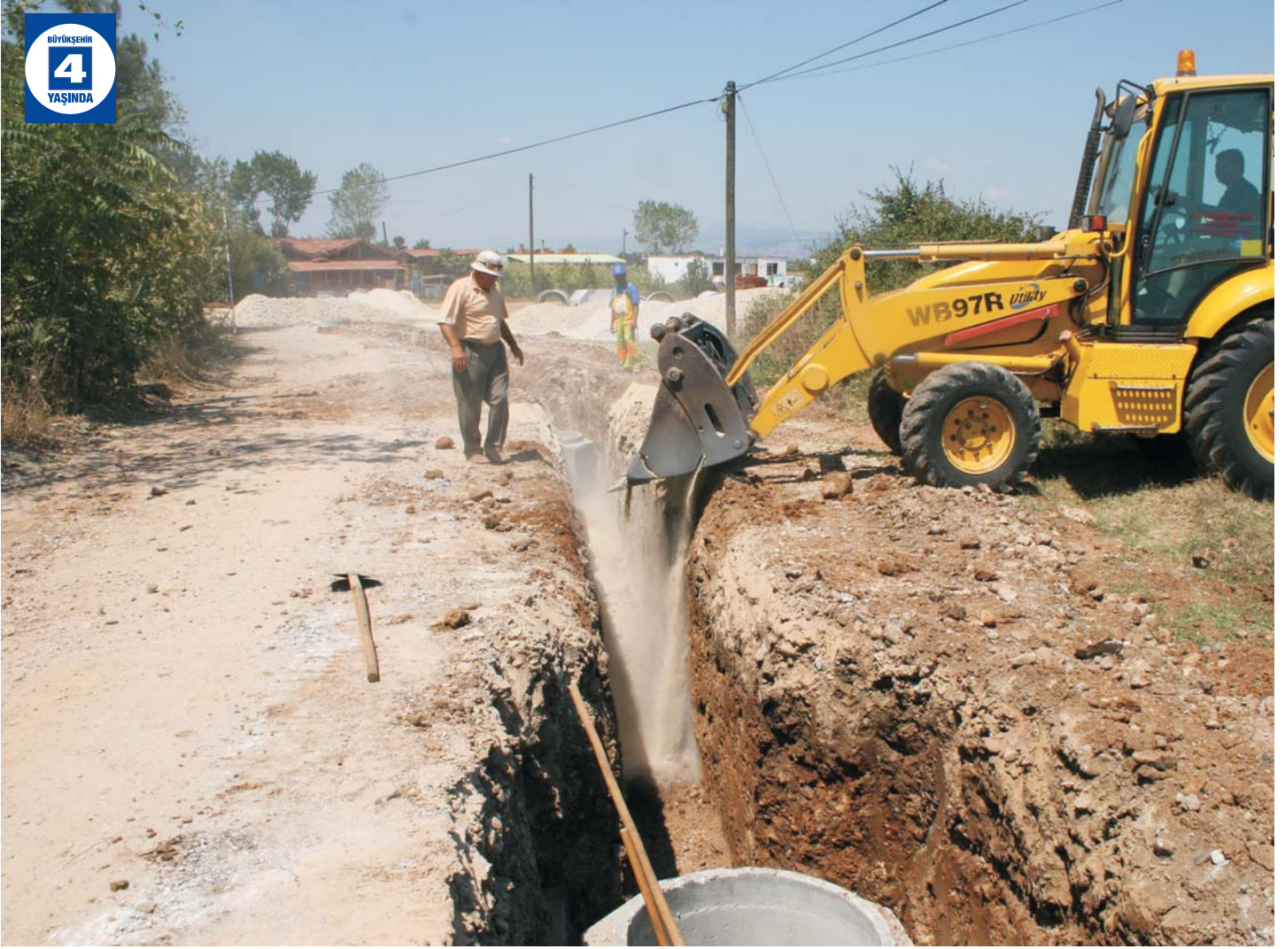
Acısu, Büyük Derbent, Sarımeşe İçme Suyu ve Kanalizasyon Hattı