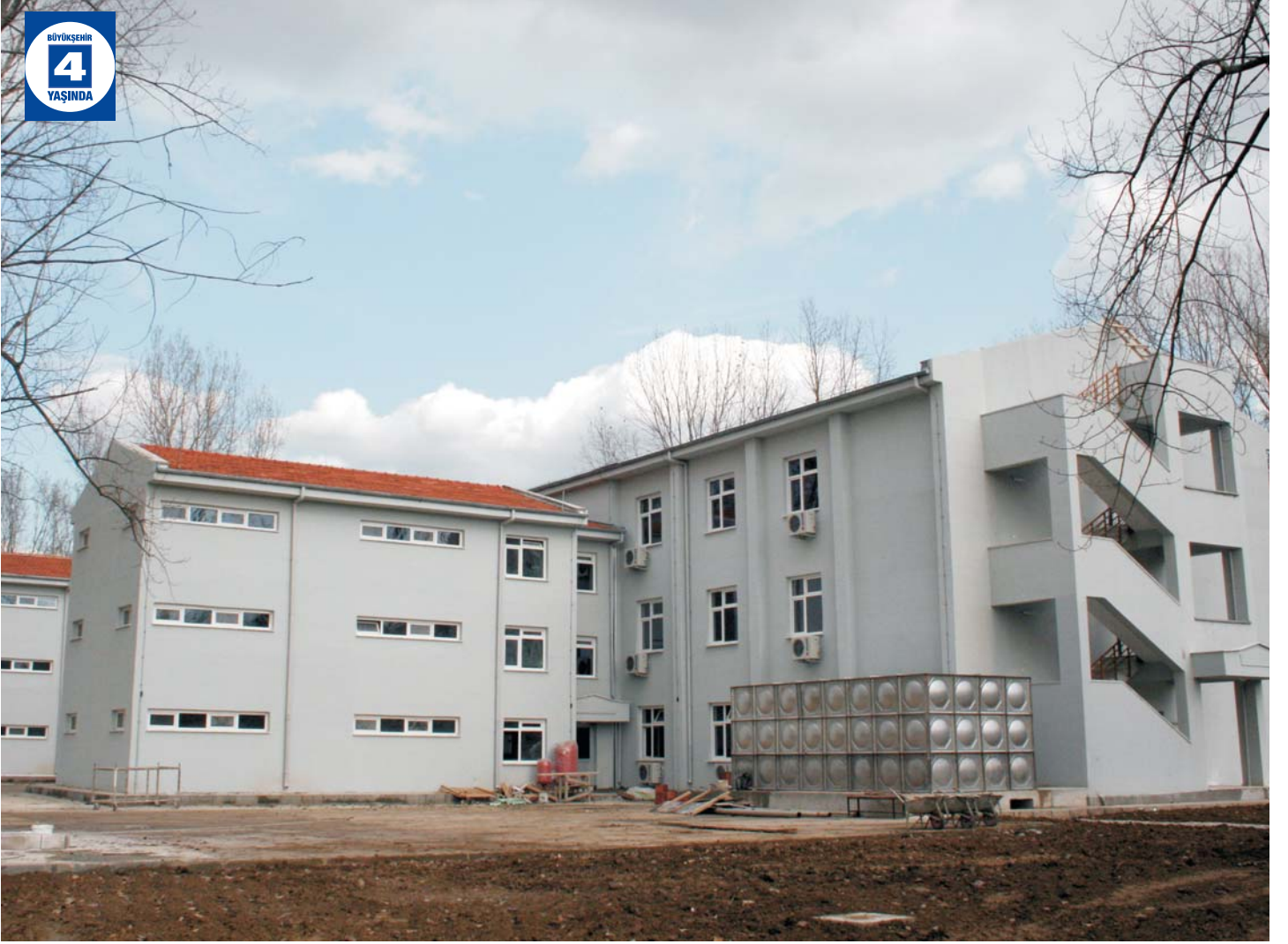
Orgeneral Mehduh Tağmaç Kışlası