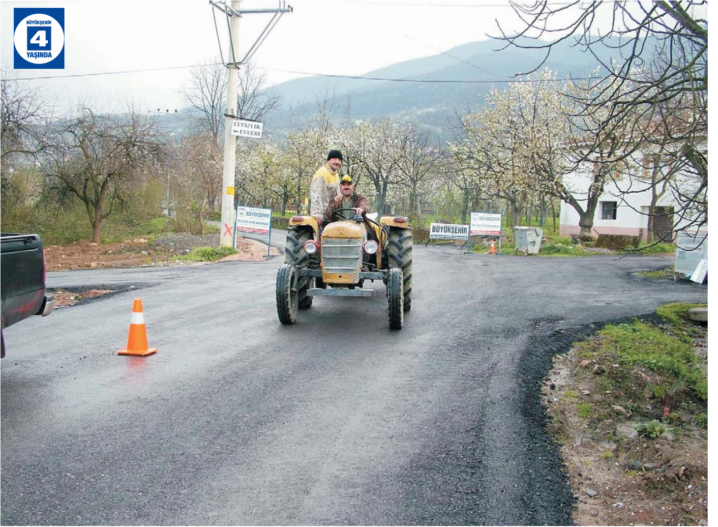
Suadiye Balaban Yolu