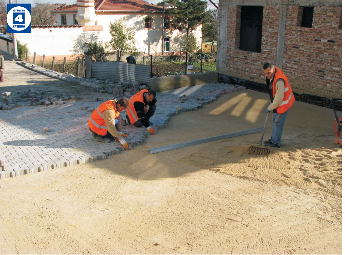
Büyük Derbent ve Eşme'ye Parke Yol ve Çevre Düzenlemesi