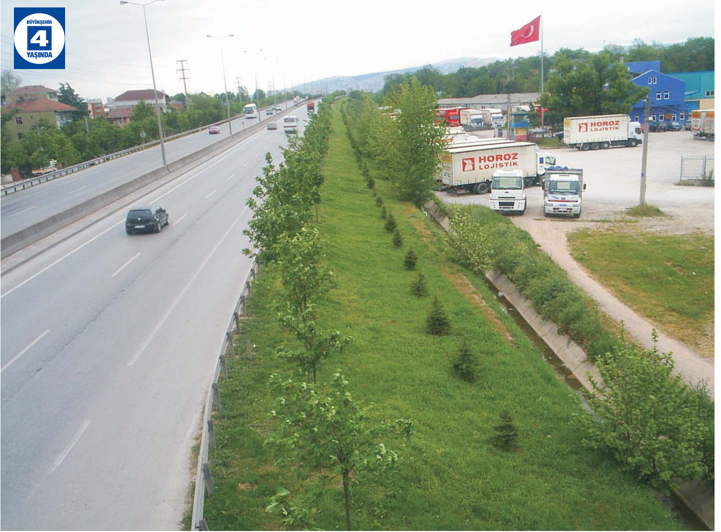
Köseköy D-100 Karayolu Ağaçlandırma