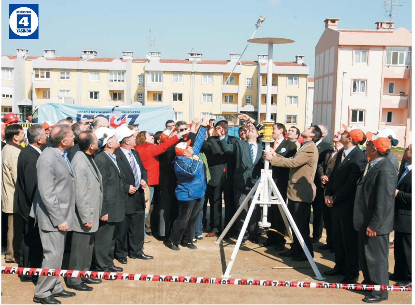
Kartepe' ye Doğalgaz Verilmesi