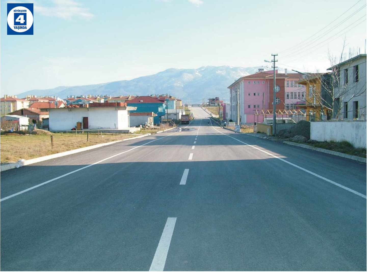
Suadiye ve Uzunçiftlik Caddelerinin Üstyapı Düzenlemesi