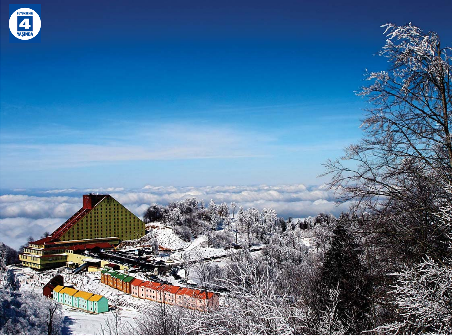
Kartepe'ye Doğalgaz Ulaştırılması