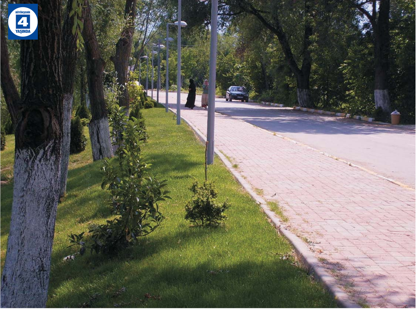
Eşme Yürüyüş Yolu