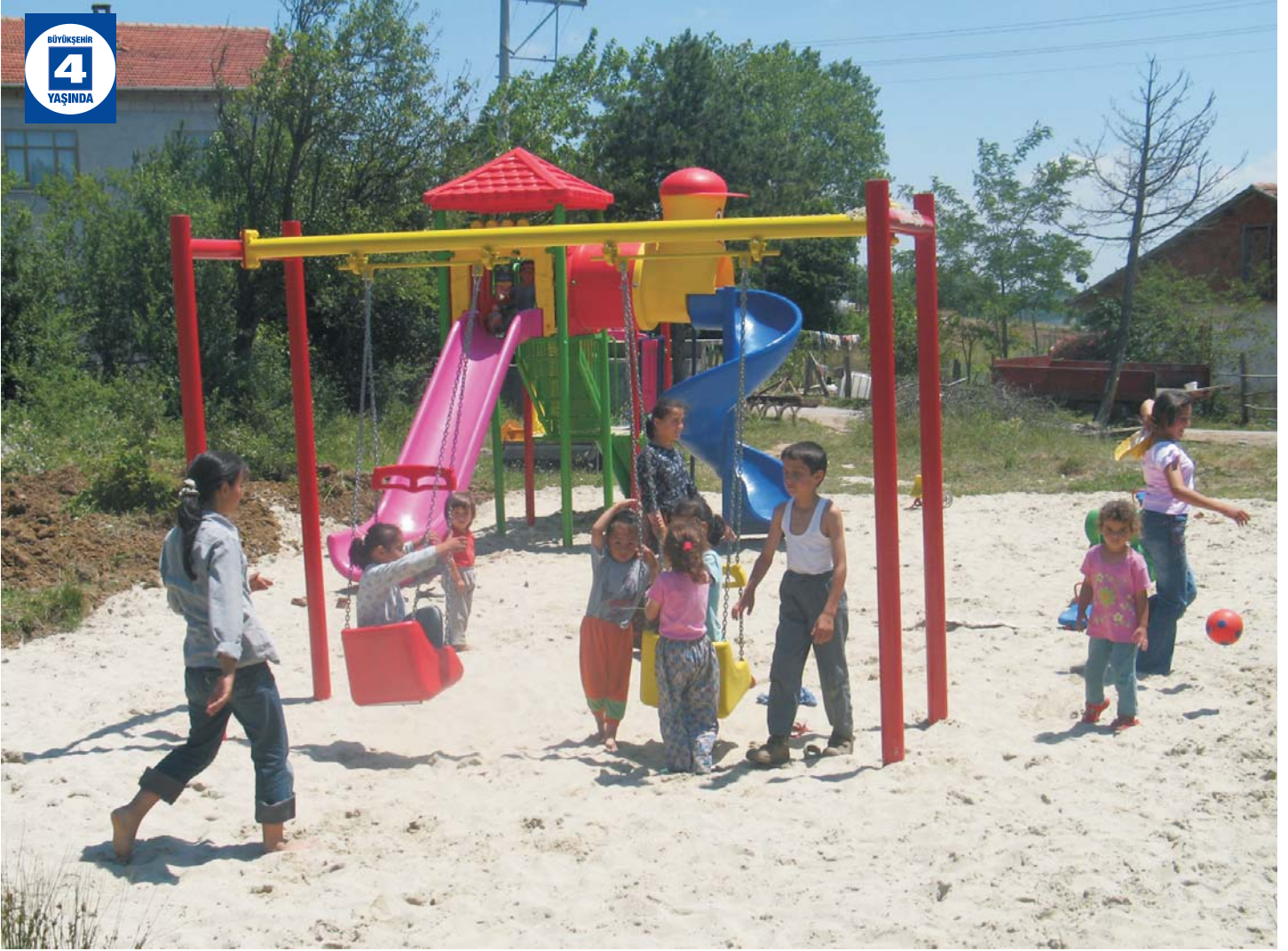
Karatepe Köylerine Çocuk Oyun Grubu