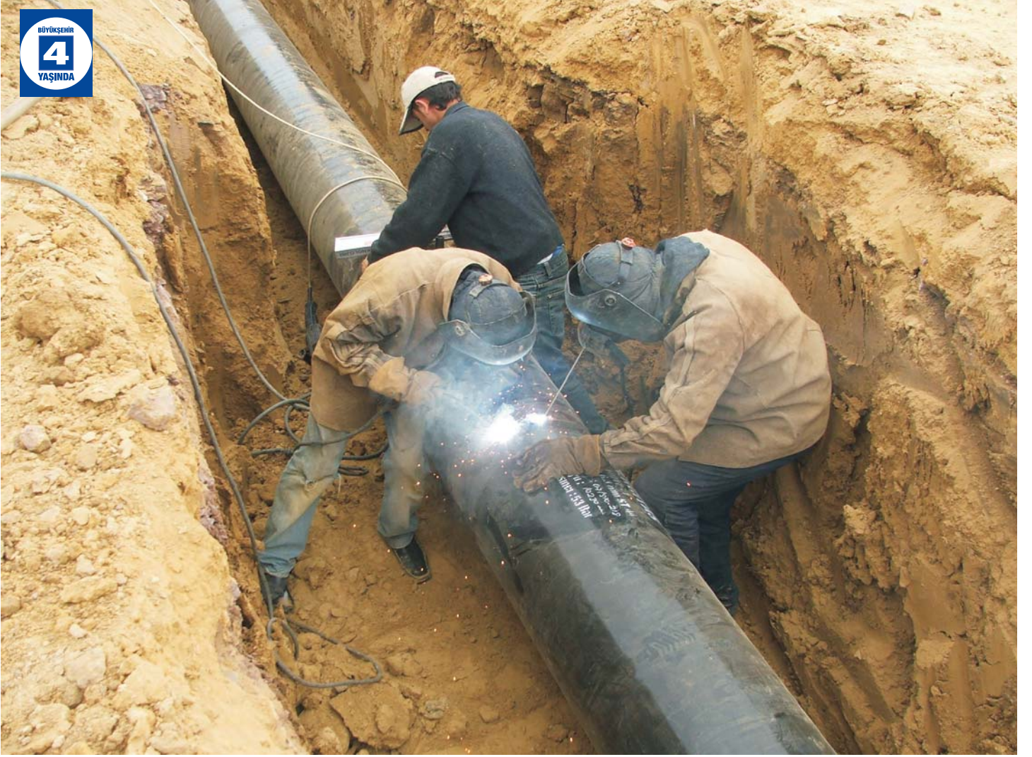
Eşme Avluburun Terfi Sistemi