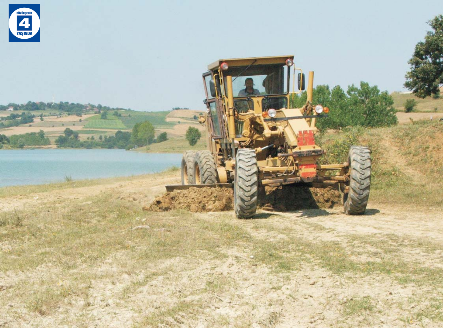
Kartepe'de Köylere Tarla Yolu Açılması