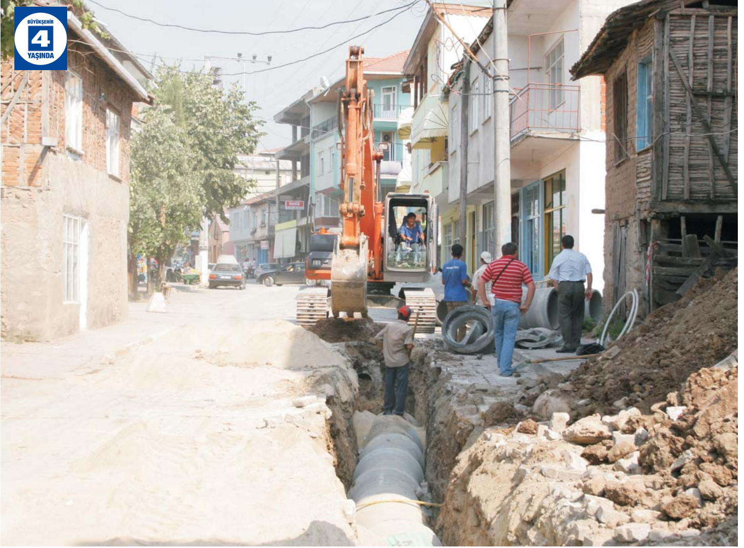
Suadiye, Arslanbey, Rahmiye'de Altyapı Çalışmaları