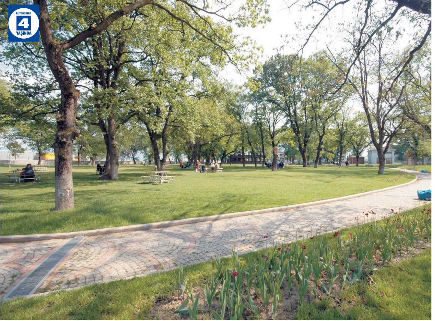
Köseköy Meşelik ve Semt Parkları