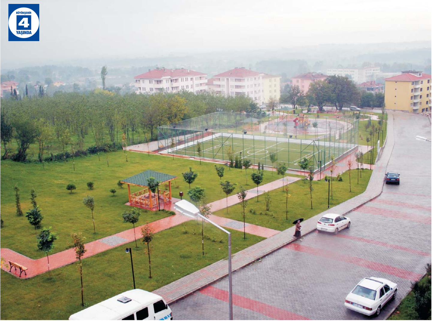
Büyük Derbent Balaban Gençlik Parkı