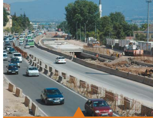
MESELA SEKA TÜNEL GEÇİŞİ