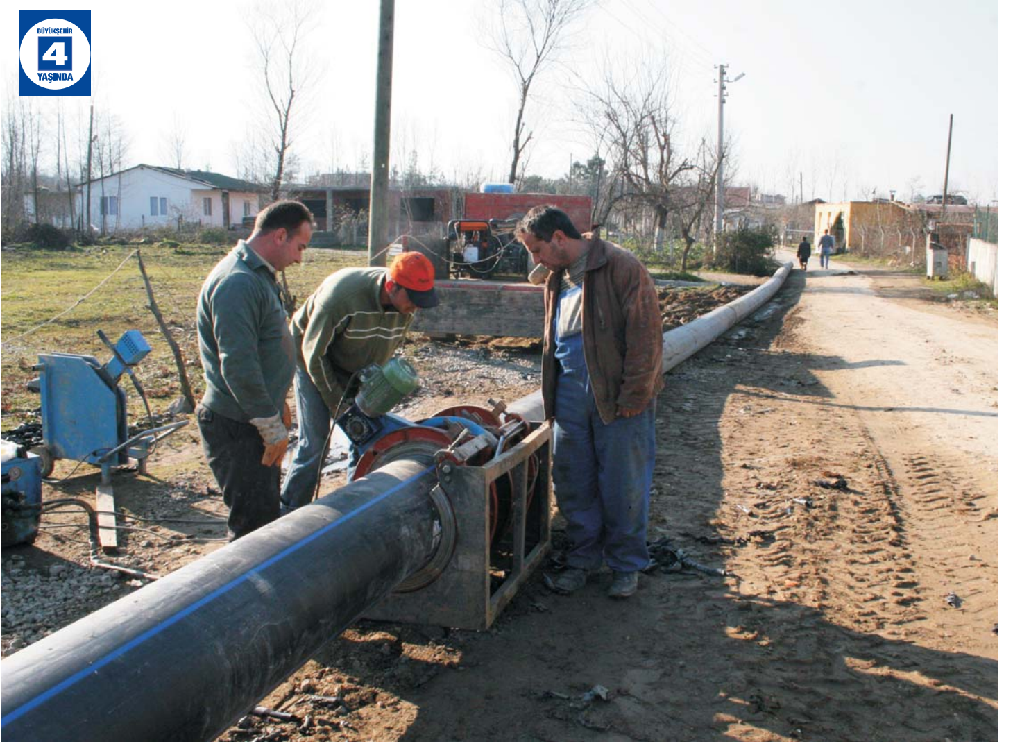
Eşme- Maşukiye İshale Hattı