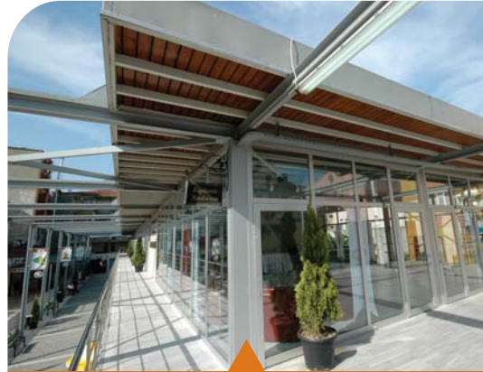
MESELA GÖLCÜK SANAT GALERİSİ