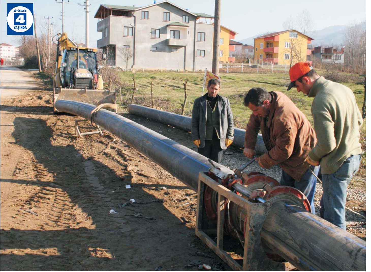
Suadiye'den Maşukiye ve Eşme'ye İçme Suyu Hattı