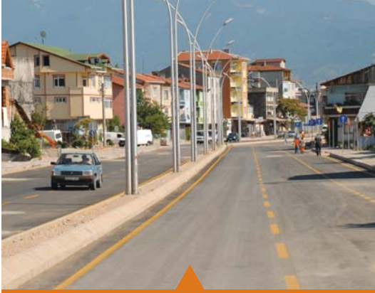
MESELA ADNAN MENDERES (KANALBOYU) BULVARI