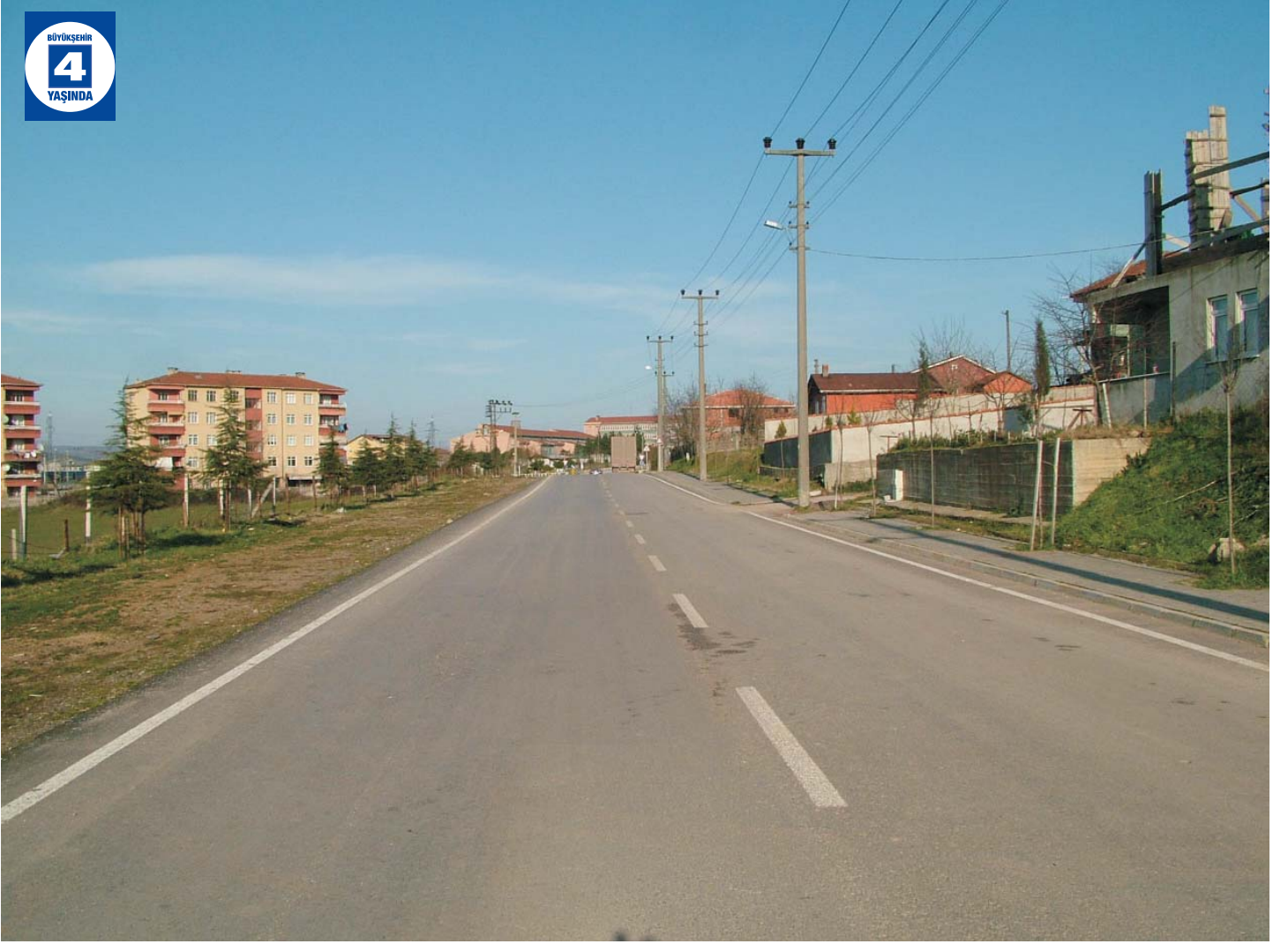
Kartepe'de Yenilenen Caddeler