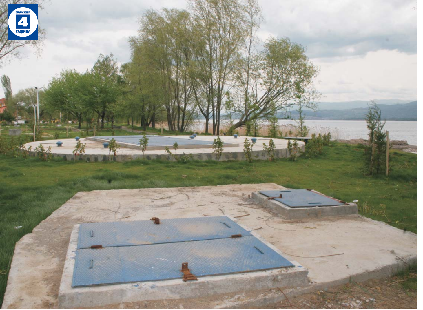
Eşme Atık Su Terfi Merkezi ve Terfi Hattı