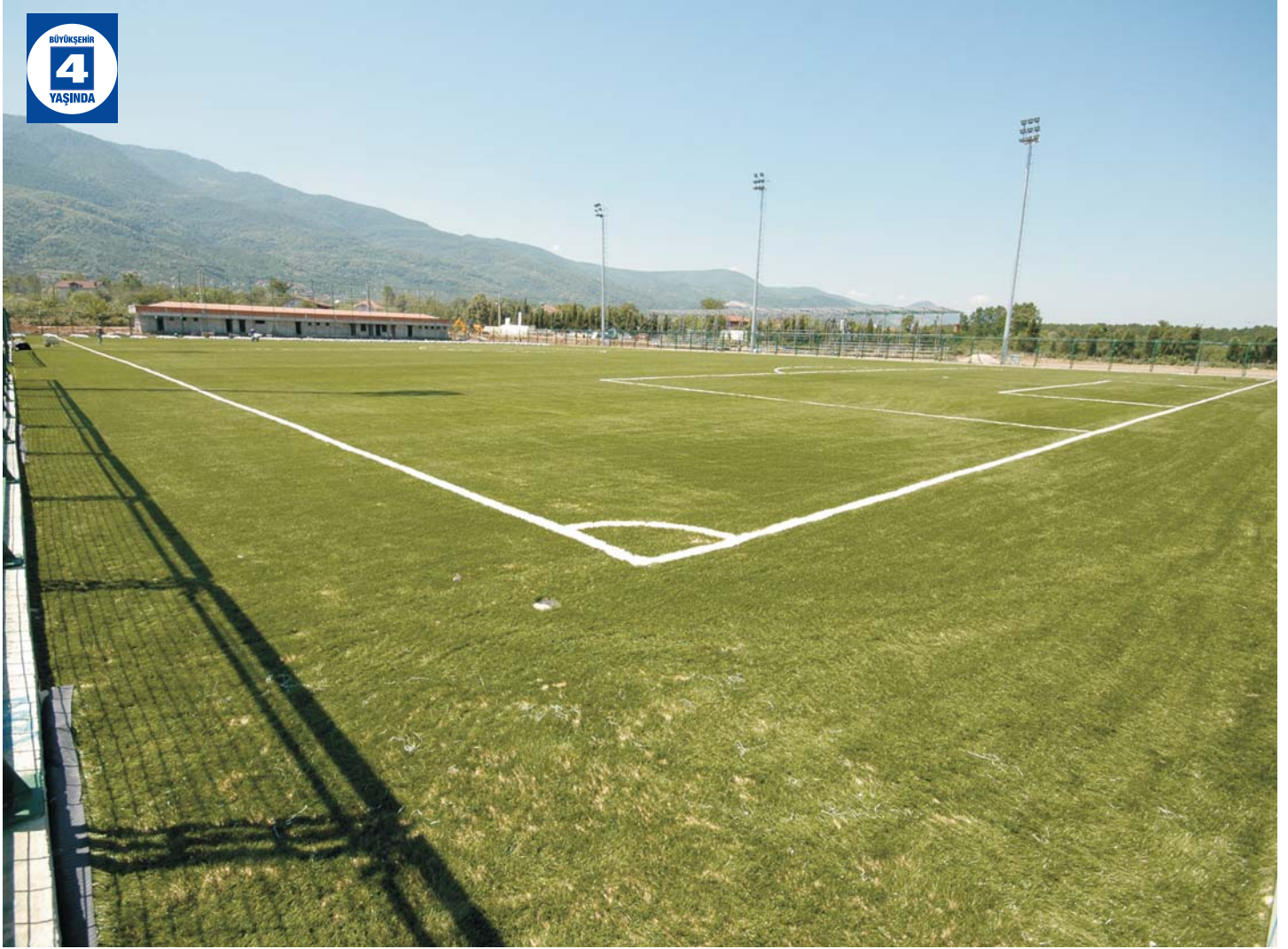
Büyük Derbent Futbol Sahası