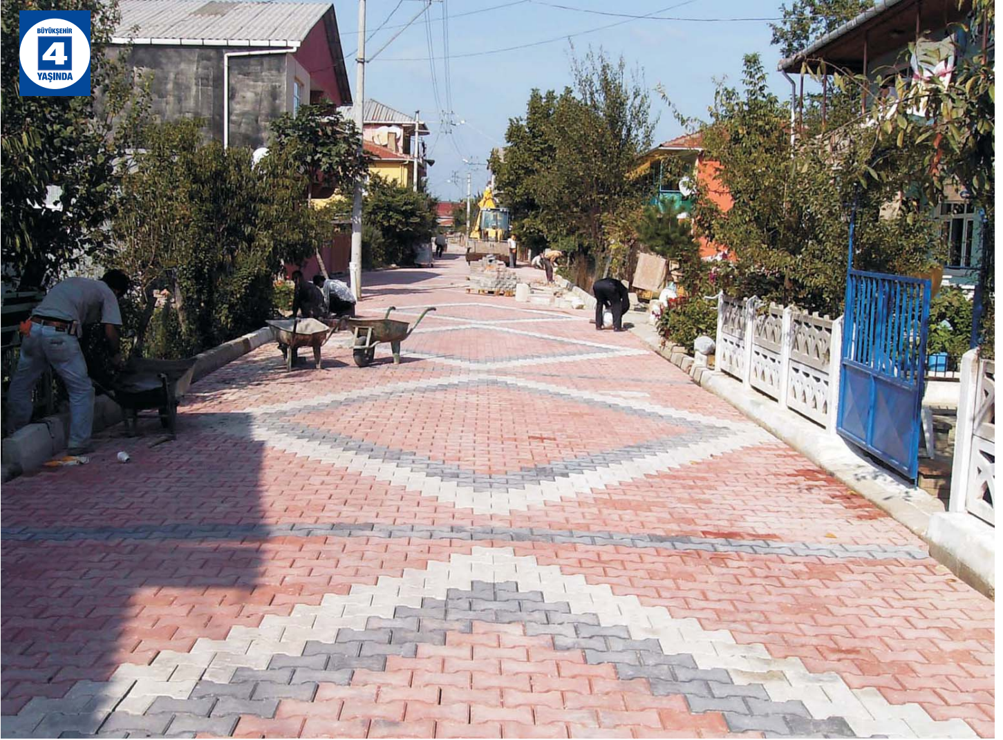
Arslanbey'de Parke Çalışması