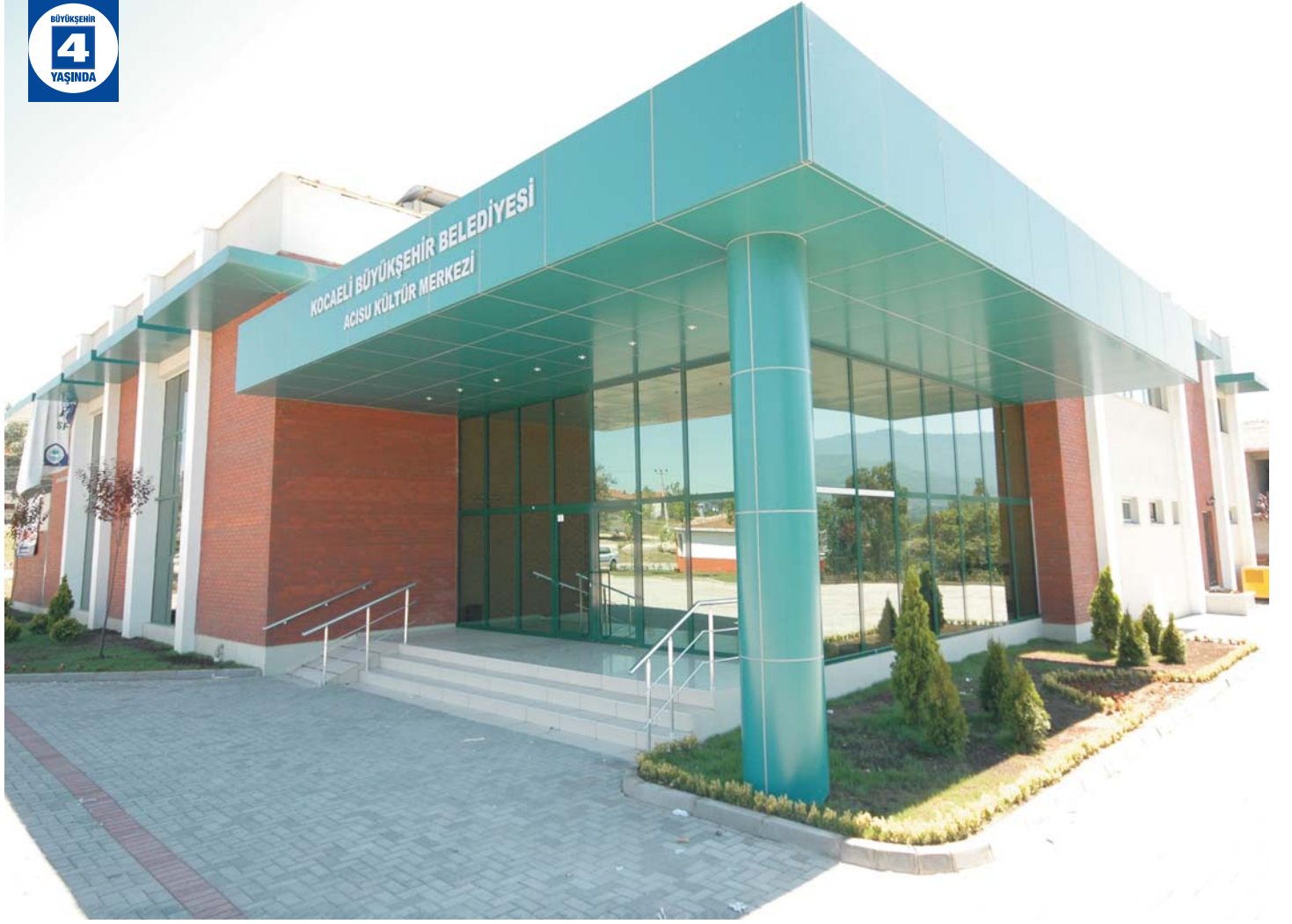
Acısu Kültür Merkezi