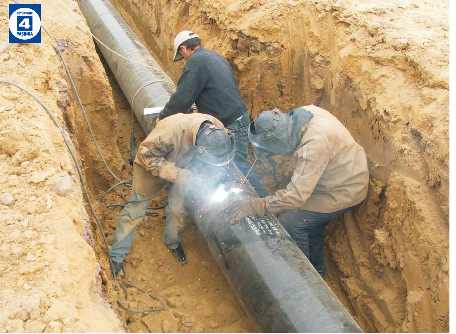
Eşme-Avluburun Terfi Sistemi