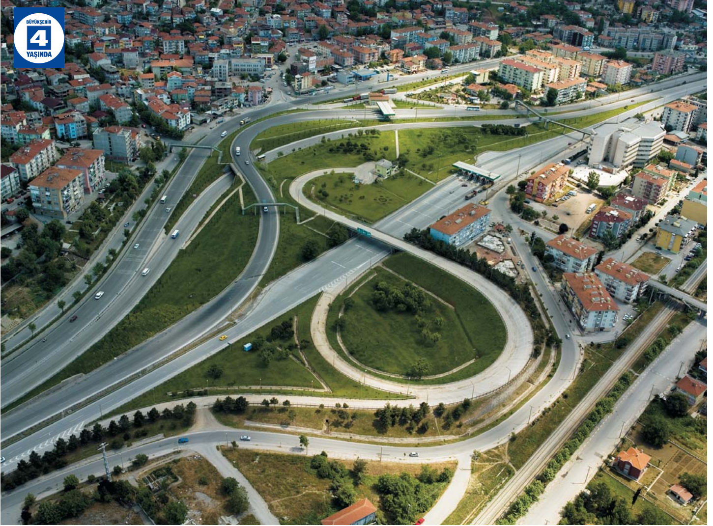
Otoyol Girişleri Çevre Düzenlemesi