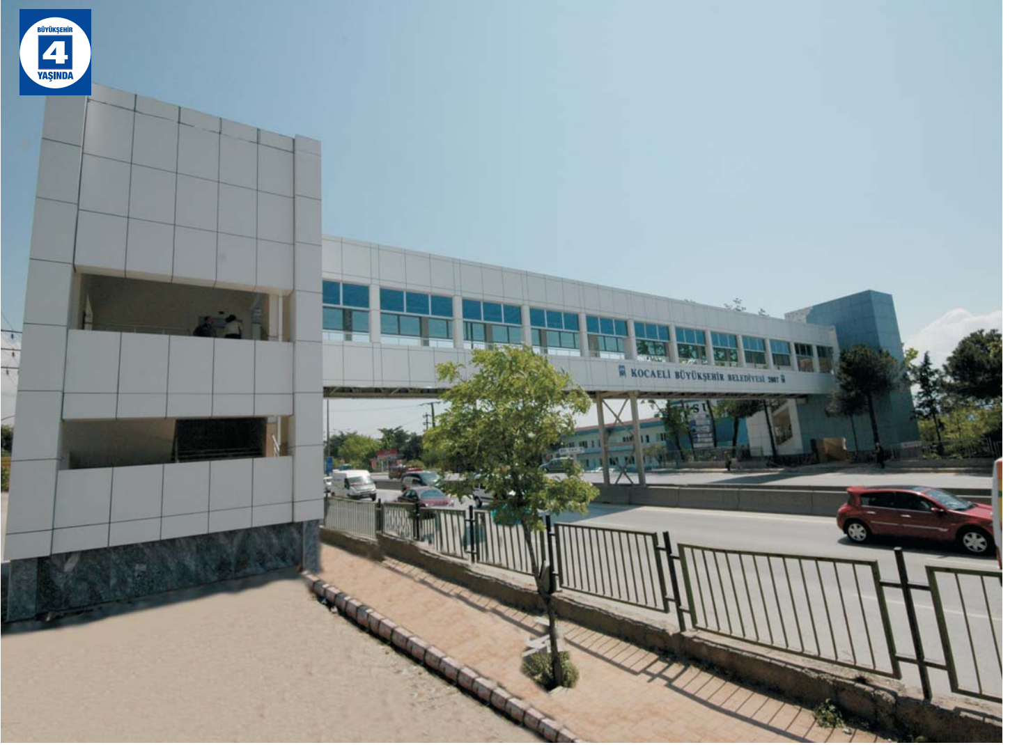
İSU Yaya Üst Geçidi