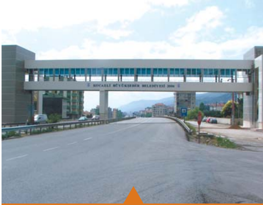
MESELA YAYA ÜST GEÇİTLERİ