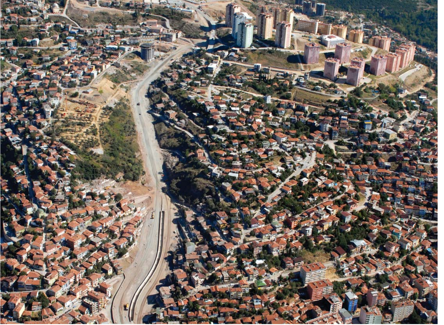
Umuttepe Double Yolu 2. Etap