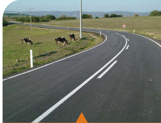
MESELA DELİVELİ-AKÇAOVA YOLU