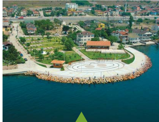
MESELA KIRAZLIYALI SAHİL PARKI