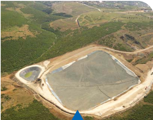
MESELA DÜZENLİ DEPOLAMA