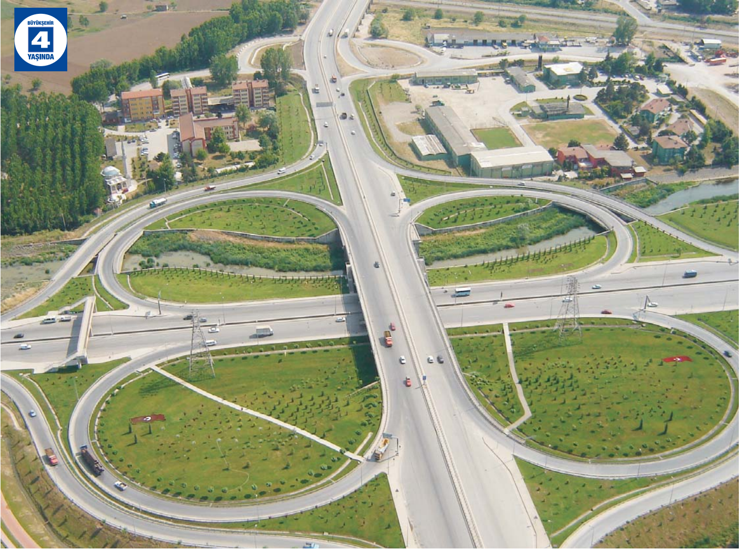
Köprülü Kavşaklar Çevre Düzenlemesi