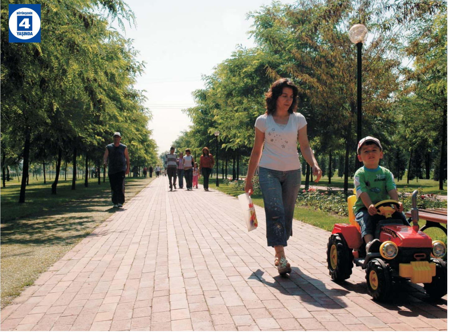
İzmit Yürüyüş Yolu 3. Etap