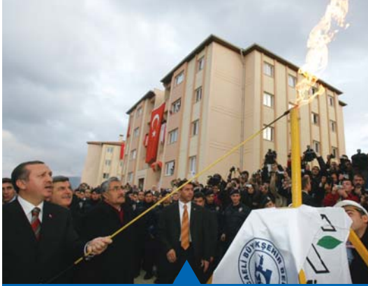
MESELA DOĞALGAZ YATIRIMLARI