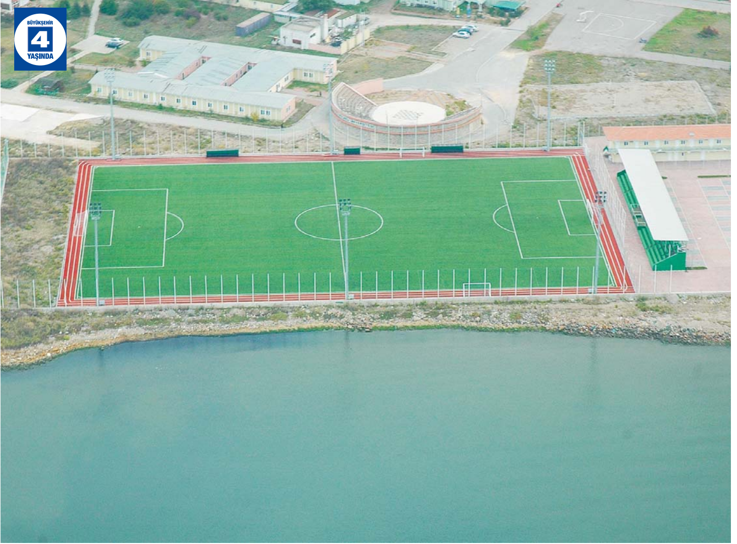
Izmit Sanayi Mahallesi Spor Tesisleri