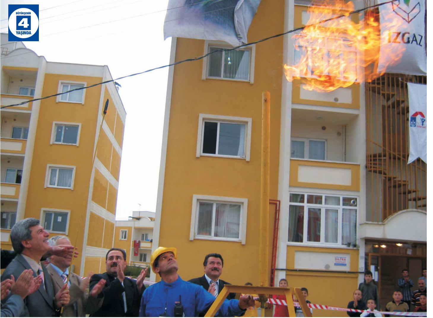
İzmit'e Doğalgaz Verilmesi