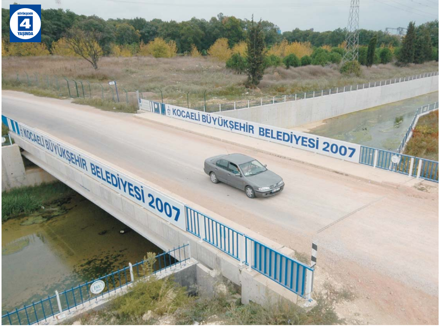
Alikahya-Yahya Kaptan Akarca Köprüsü