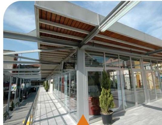
MESELA GÖLCÜK SANAT GALERİSİ