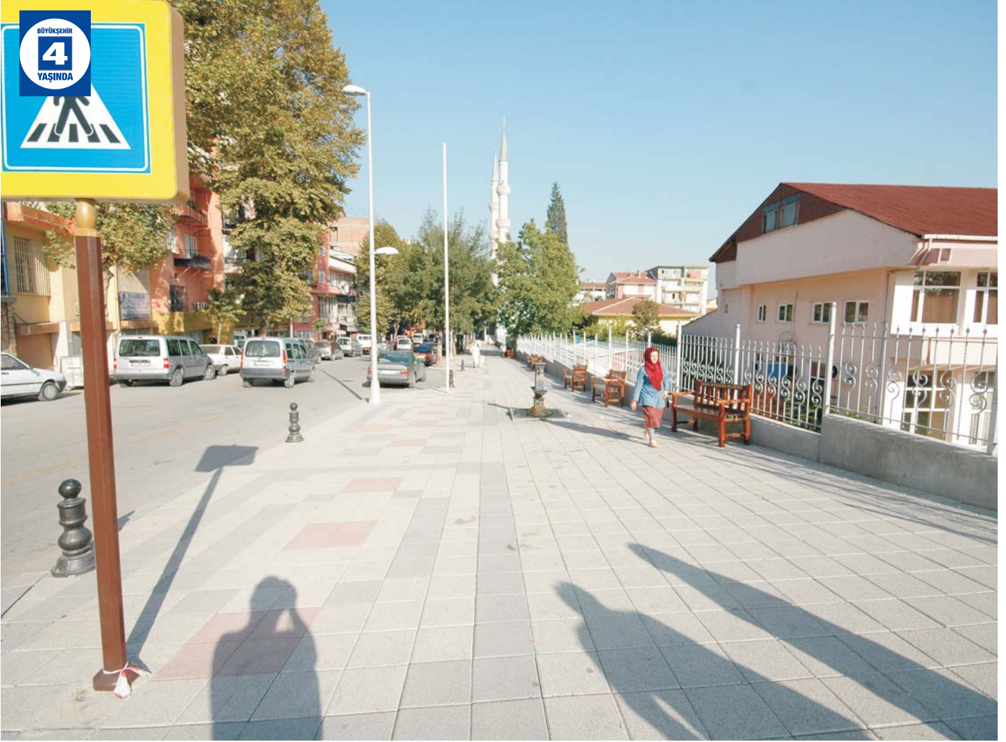
Bekirpaşa Bağdat Caddesi