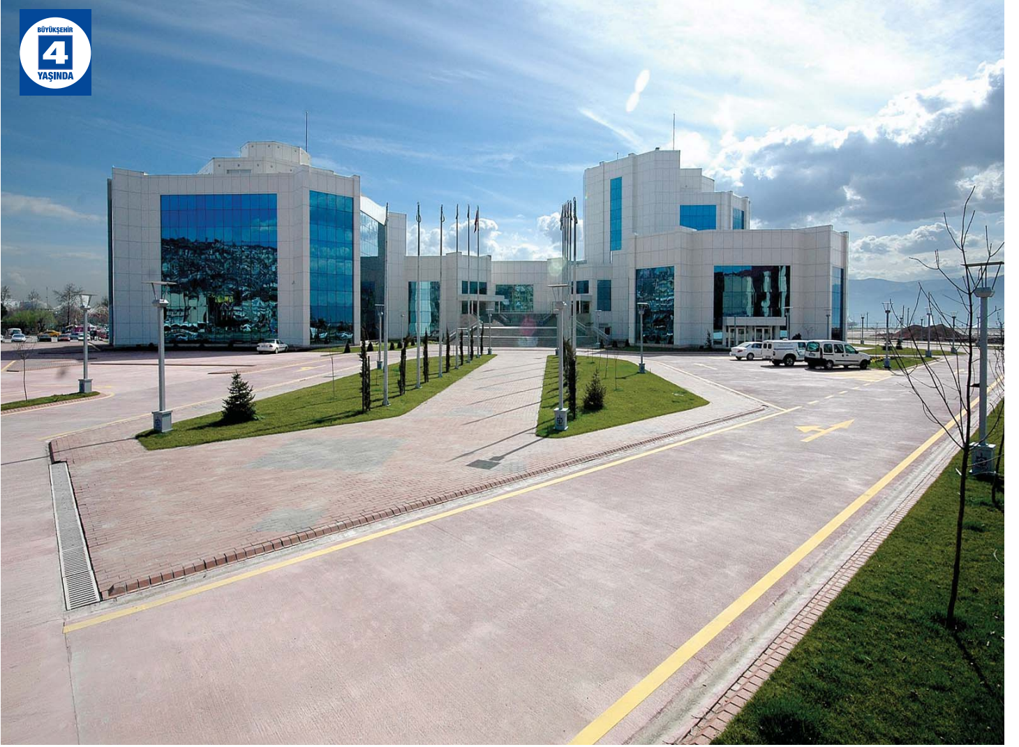
Kocaeli Büyükşehir Belediyesi Hizmet Binası