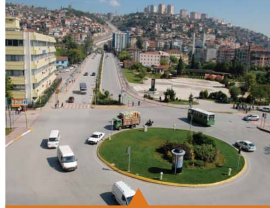
MESELA GAZANFER BİLGE BULVARI