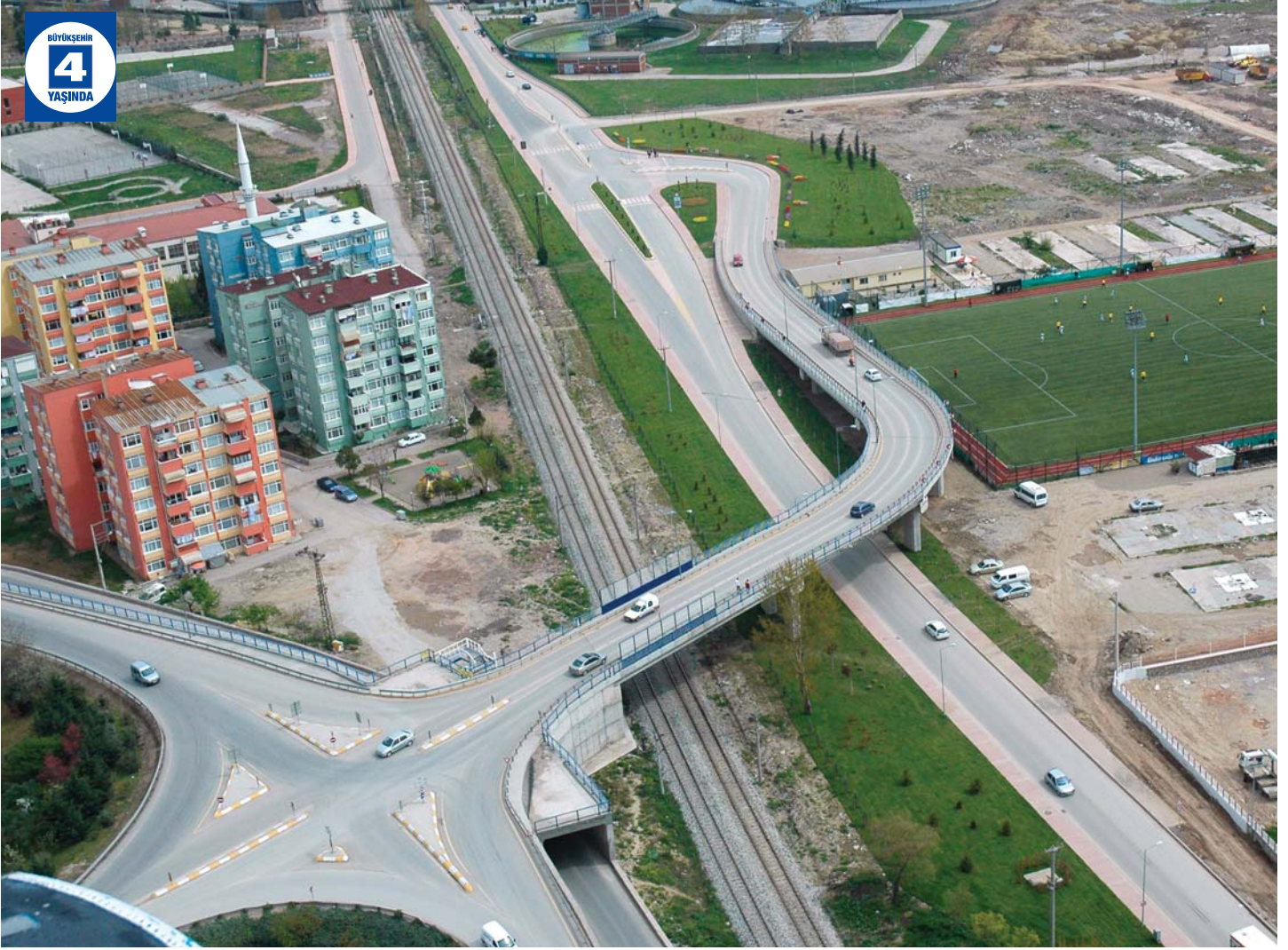
Mevlana Köprüsü Kavşağı