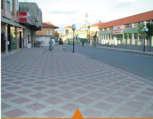
MESELA DENİZCİLER CADDESİ