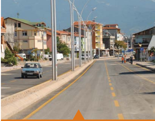
MESELA ADNAN MENDERES (KANALBOYU) BULVARI