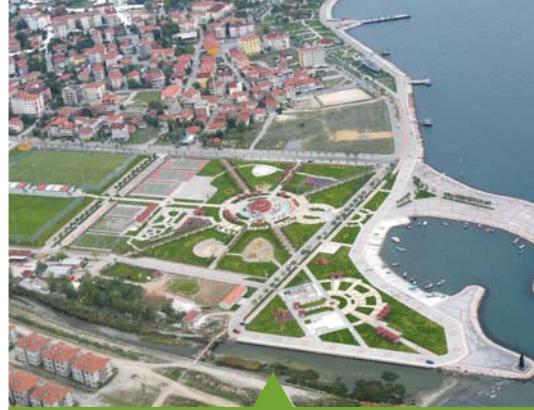
MESELA BARBAROS HAYRETTİN PAŞA PARKI