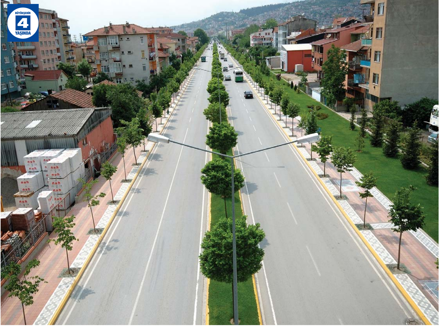
Şehit Rafet Karacan Bulvarı