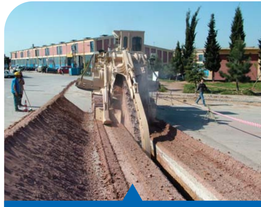
MESELA İÇME SUYU YATIRIMI