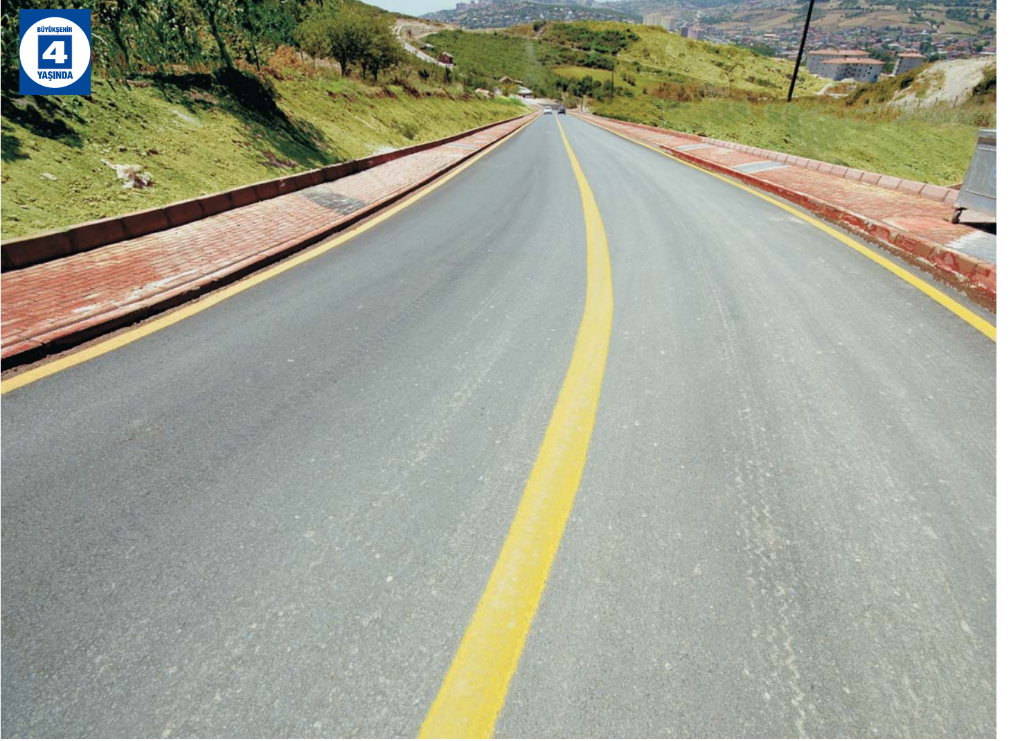
Alikahya Kadın Doğum Hastanesi Yolu