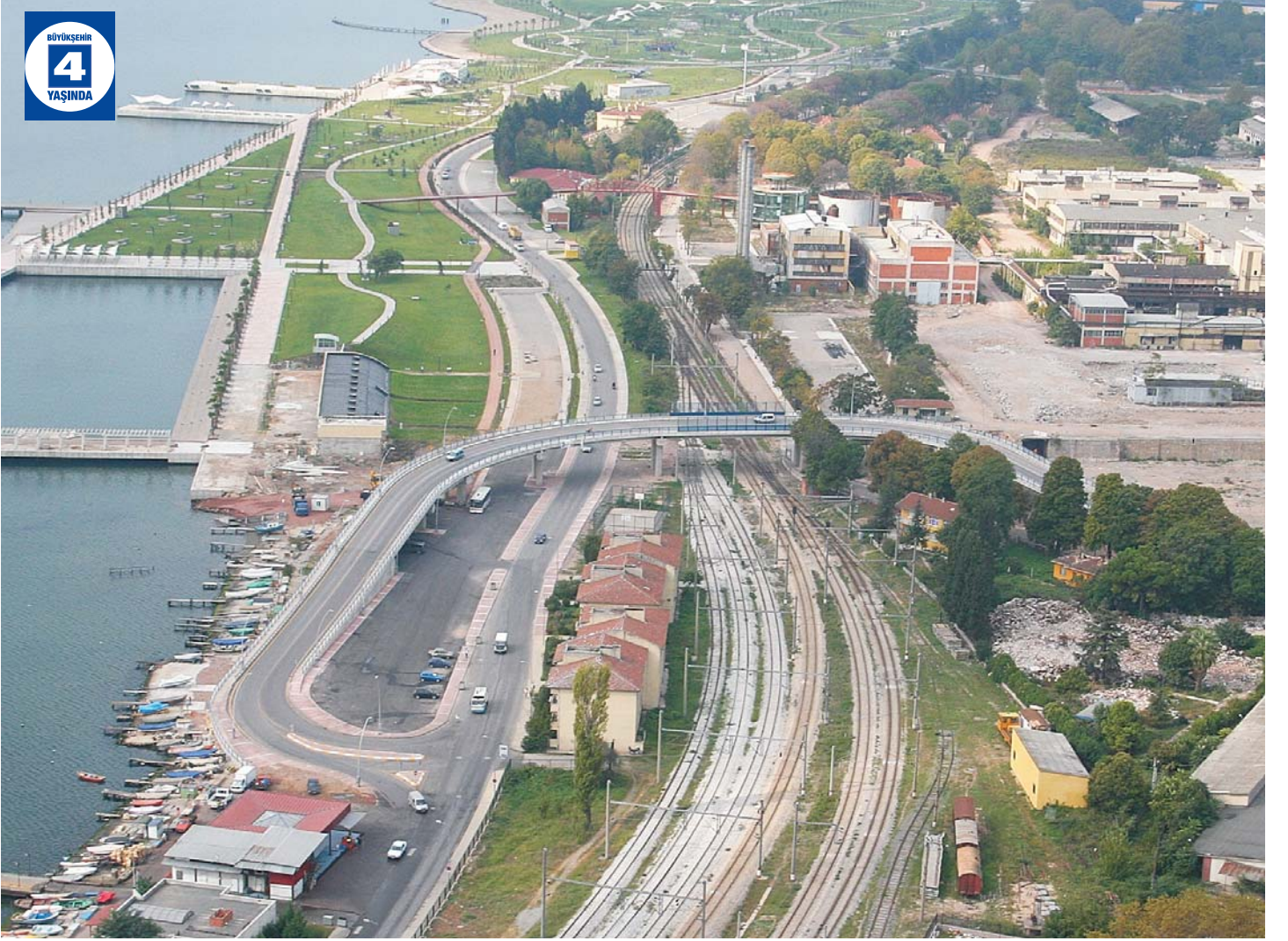
Seka Köprülü Kavşağı