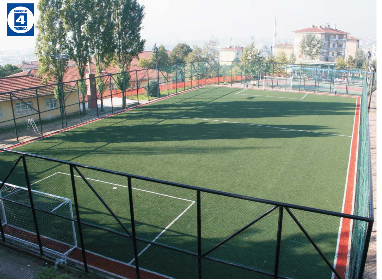
İzmit Şirintepe Spor Tesisleri