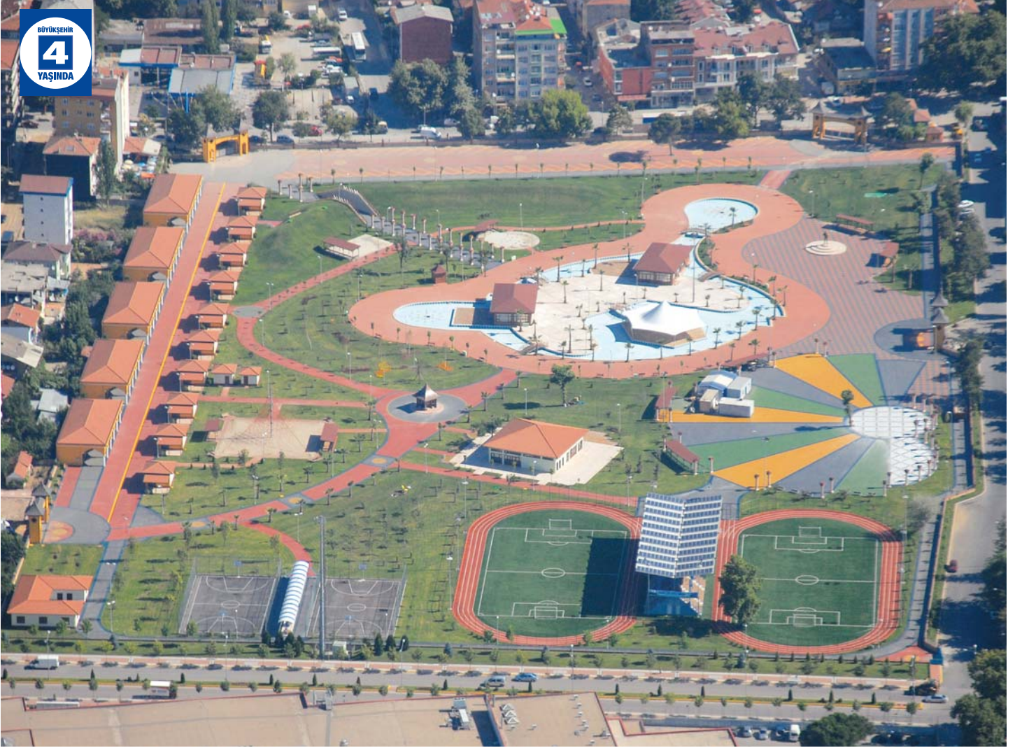
Doğu Kışla Gençlik Parkı