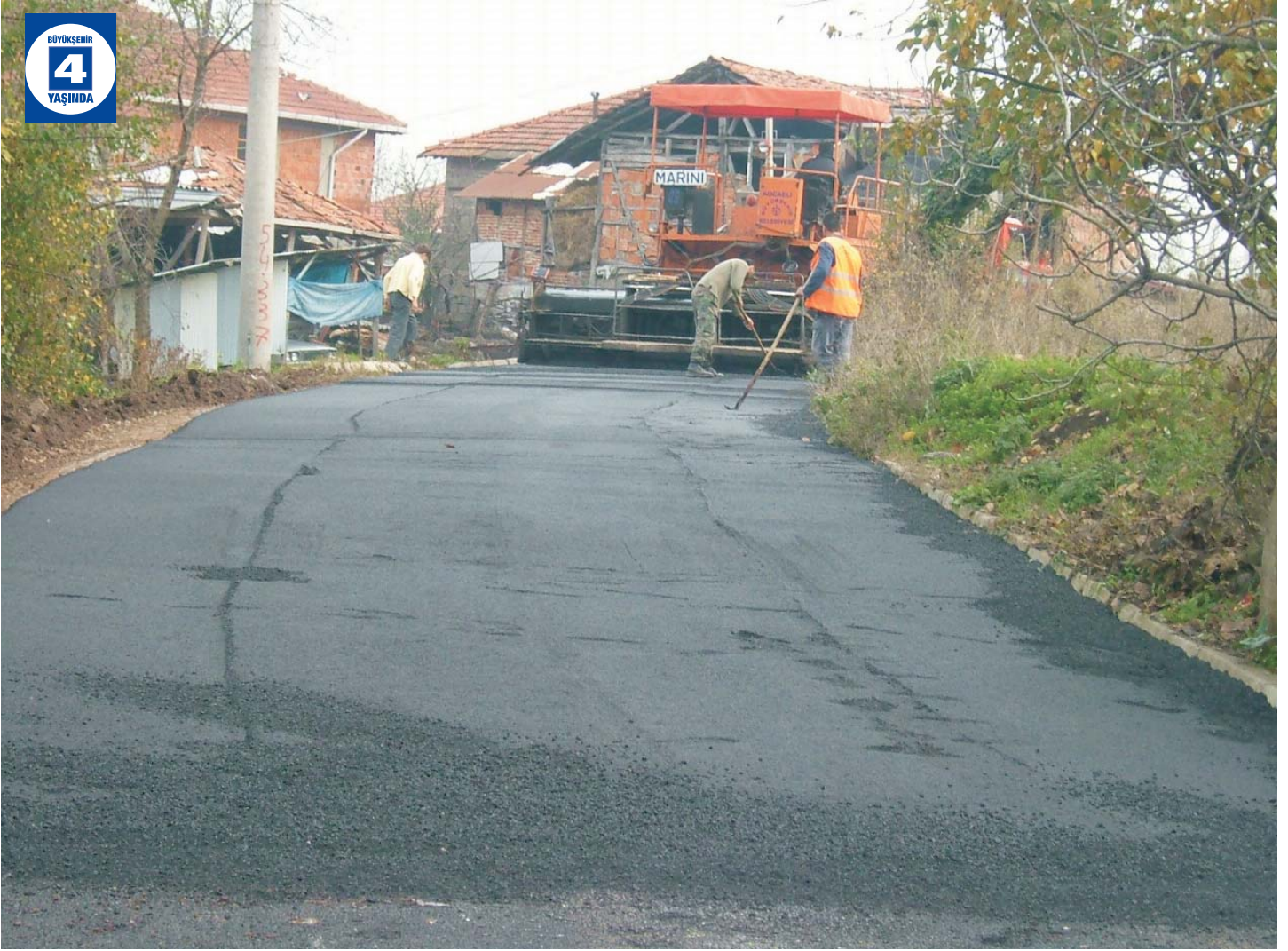
Köy Yollarında Asfalt Çalışması