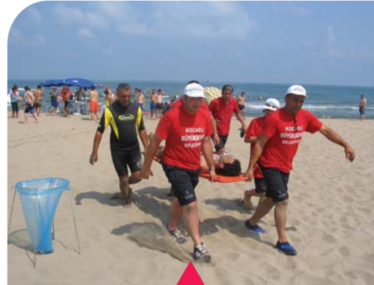
MESELA SAHİL GÜVENLİK