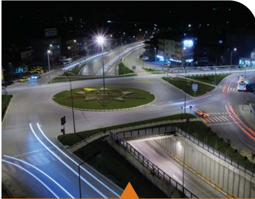
MESELA ESKİHİSAR TÜNEL GEÇİŞİ