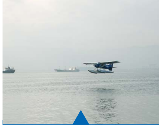
MESELA DENİZ DENETİMİ