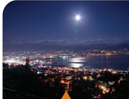
MESELA ŞEHİR İMAR PLANLARI