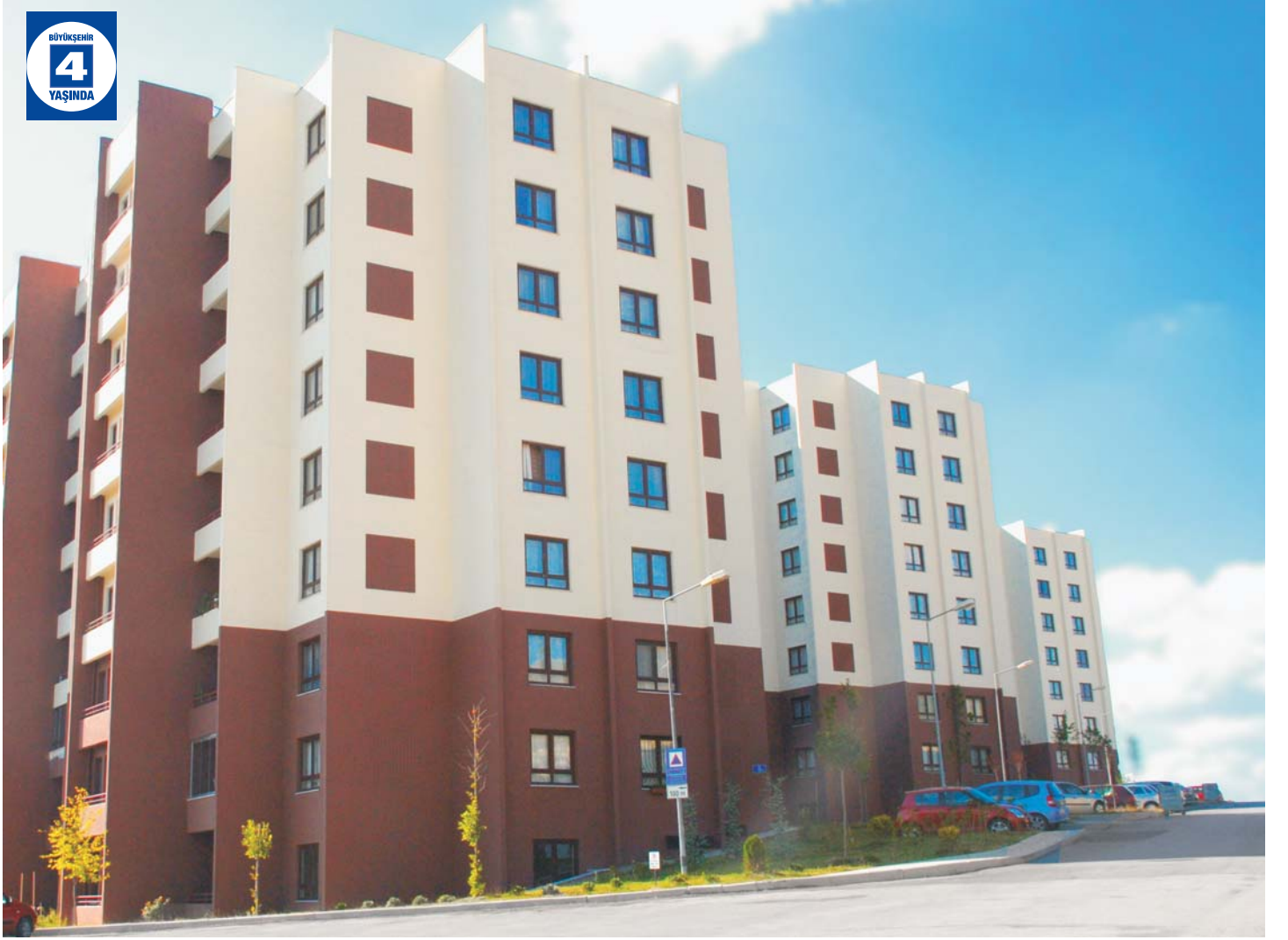
Yeni Yuvam Konutları