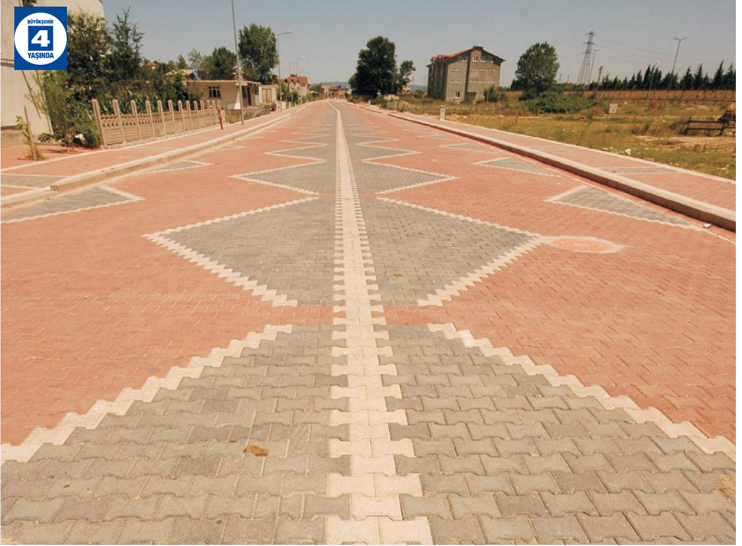
Parke İle Kaplanan Yollar