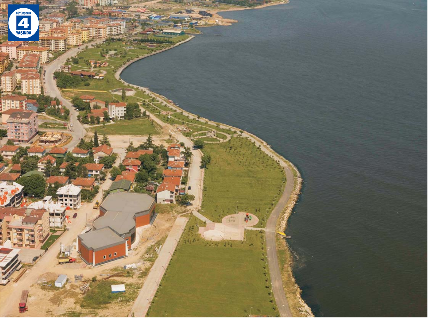
Plaj Yolu Demokrasi Parkı