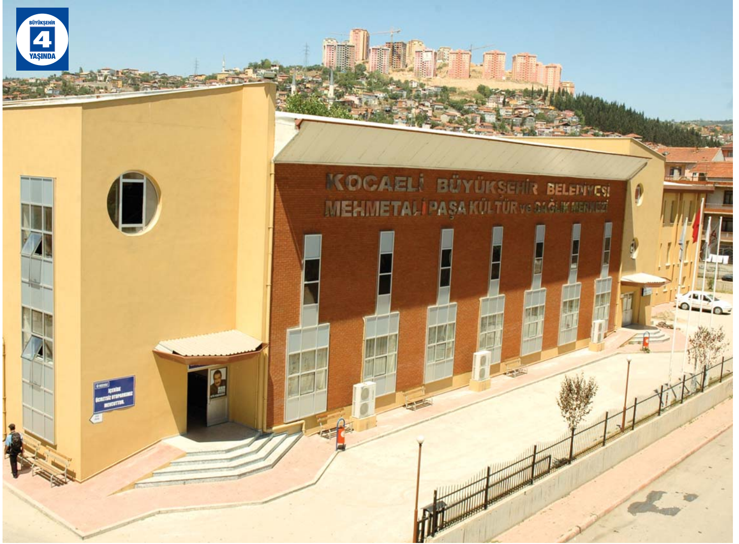
Mehmet Ali Paşa Kültür ve Sağlık Merkezi