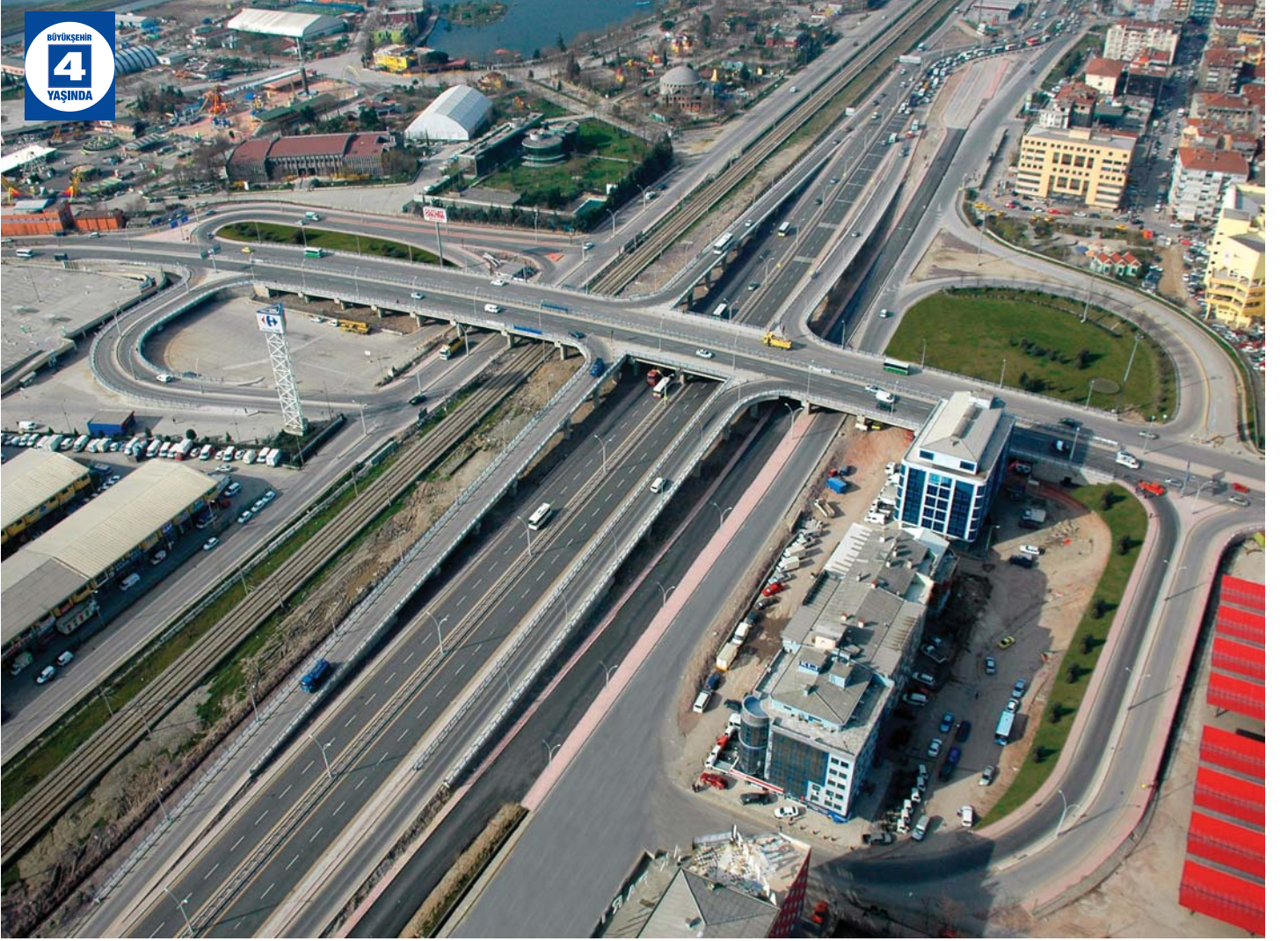
Adalet Köprüsü Kavşağı