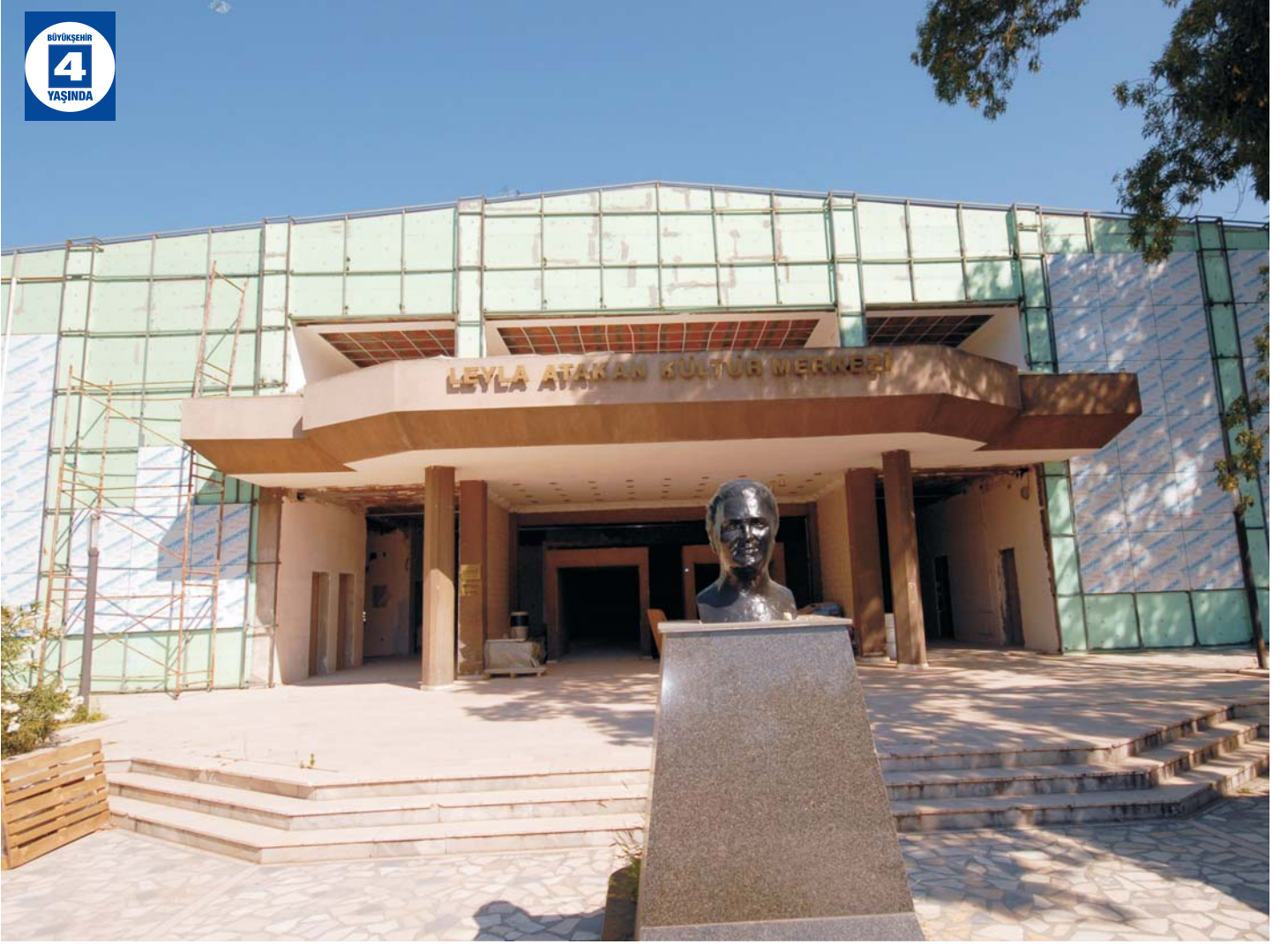
Leyla Atakan Kültür Merkezi Tadilatı