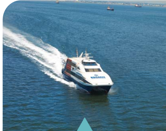
MESELA DENİZ ULAŞIMI