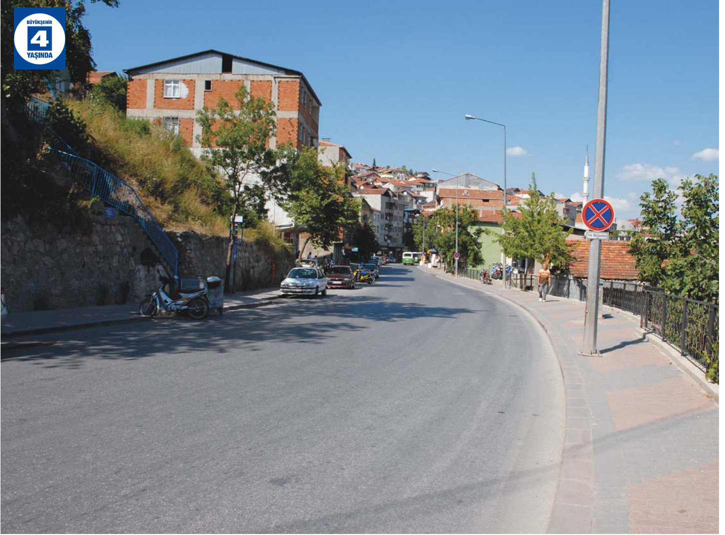
Bekirpaşa Turan Güneş Caddesi