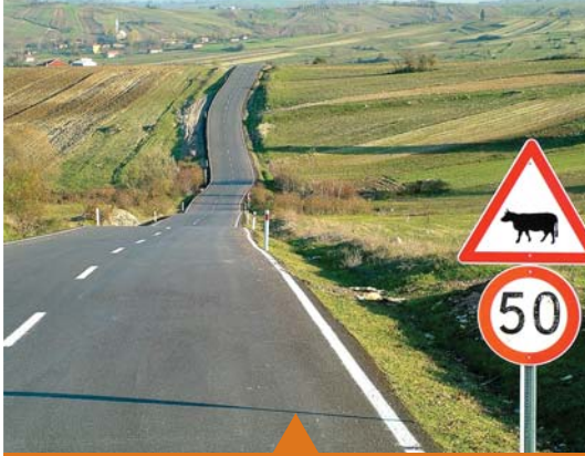
MESELA KÖYLERE HİZMET