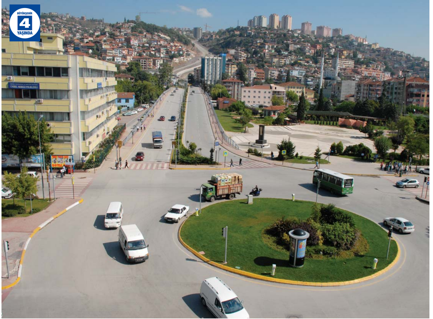
Gazanfer Bilge Bulvarı