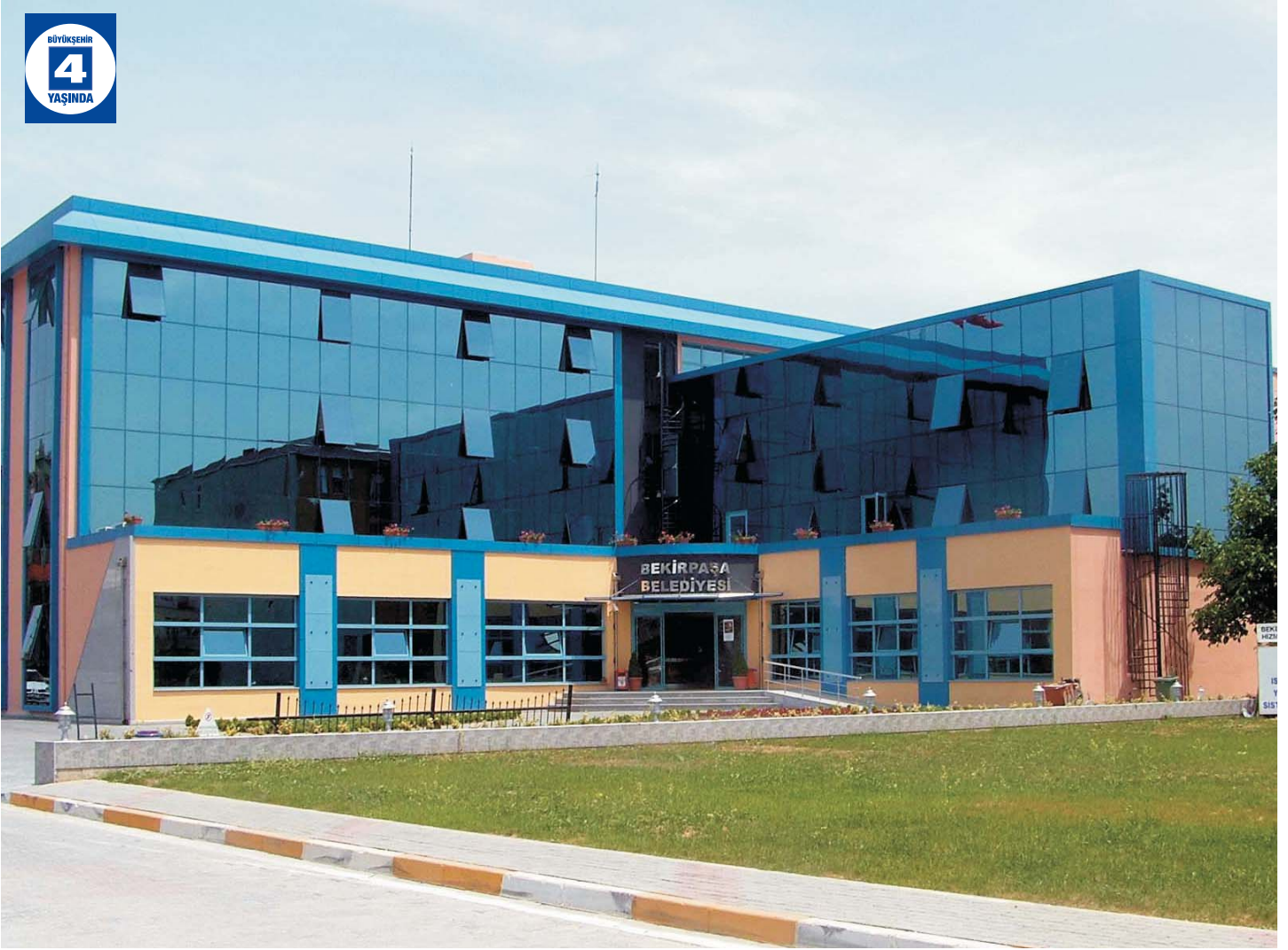
Bekirpaşa Belediye Hizmet Binası