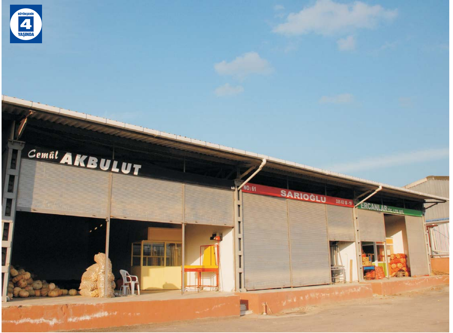
İzmit Hali Patates Deposu