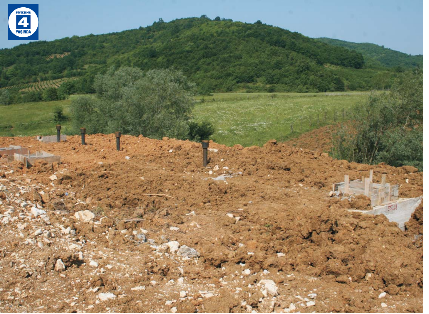
Köylerde foseptik çalışmaları