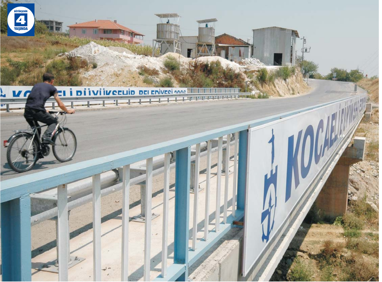
Gündoğdu Malta Köprüsü