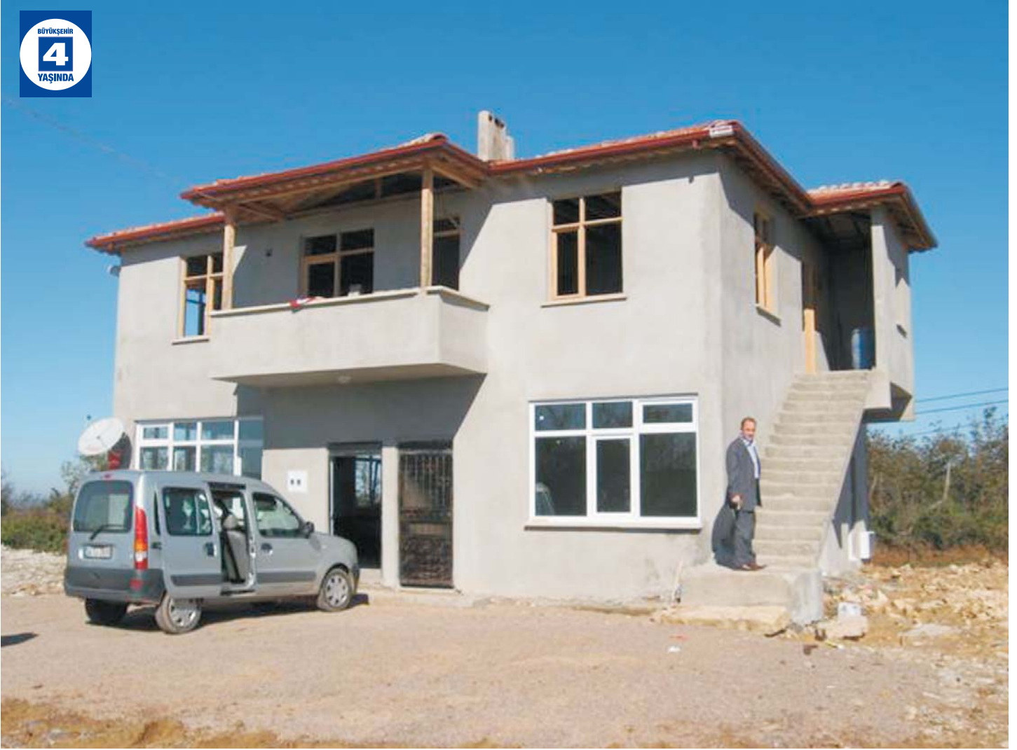
Köylere İnşaat Malzemesi Yardımı