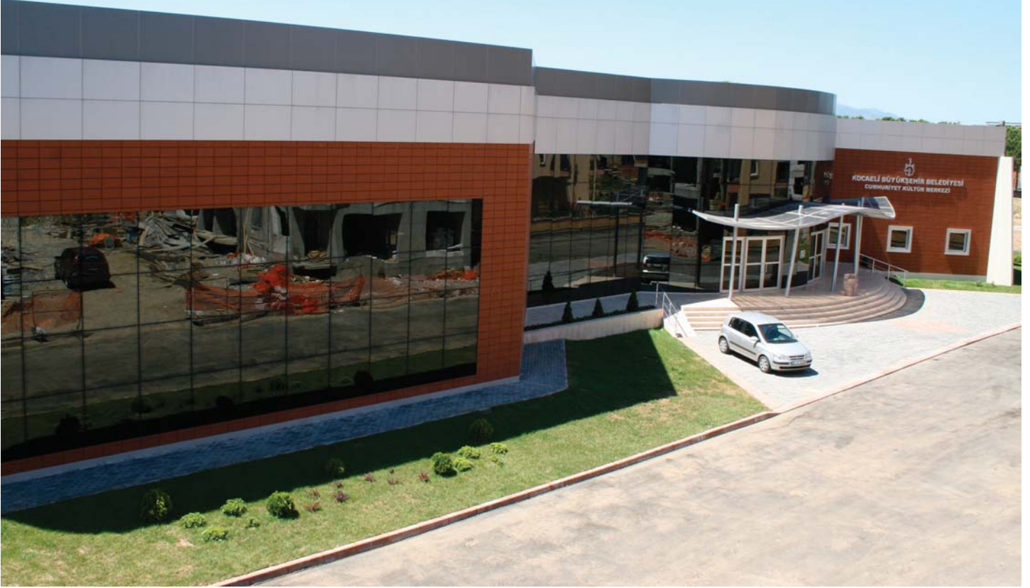
Cumhuriyet Mahallesi Kültür Merkezi