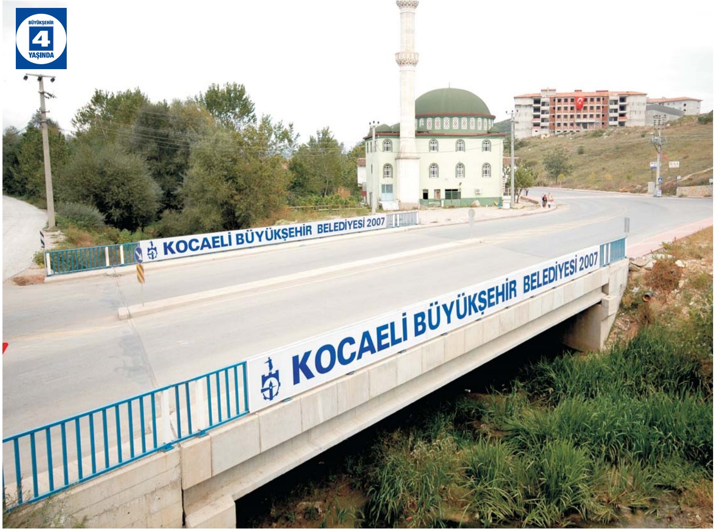
Alikahya Karadenizliler Mahallesi Bıçkı Deresi Köprüsü