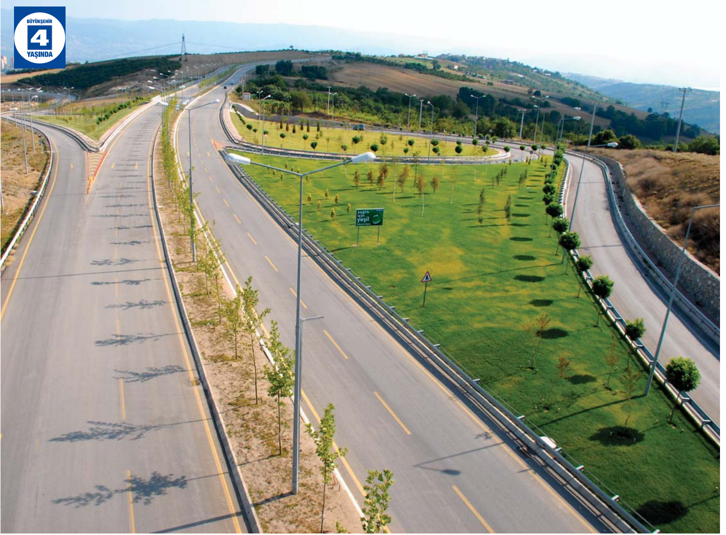
Umuttepe Double Yolu