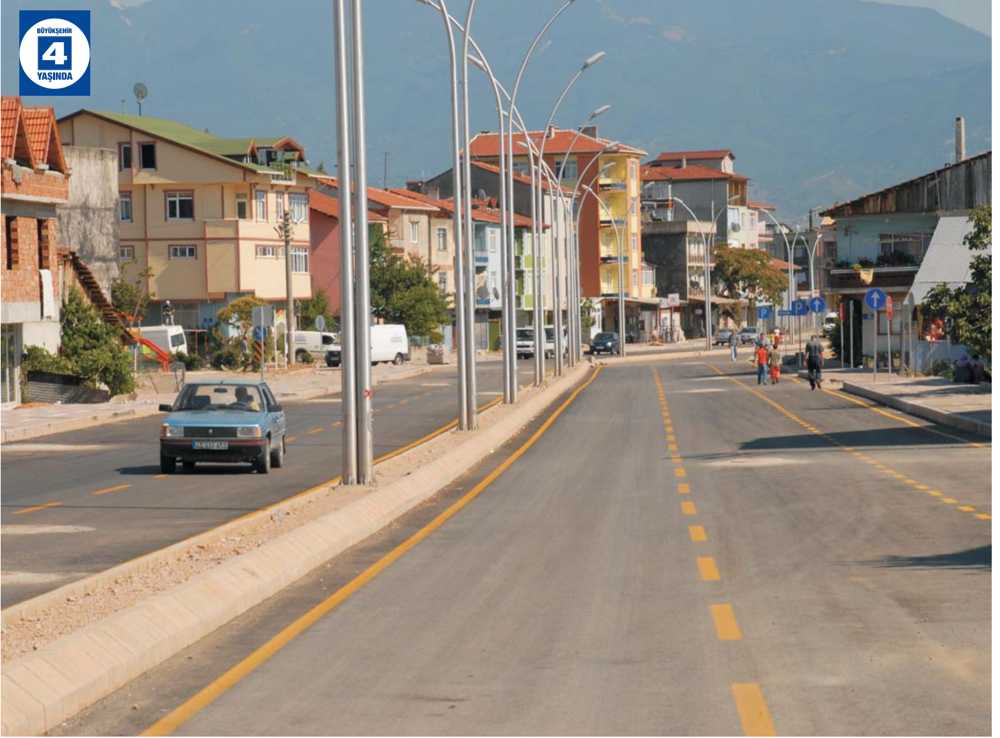
Adnan Menderes (Kanalboyu) Bulvarı