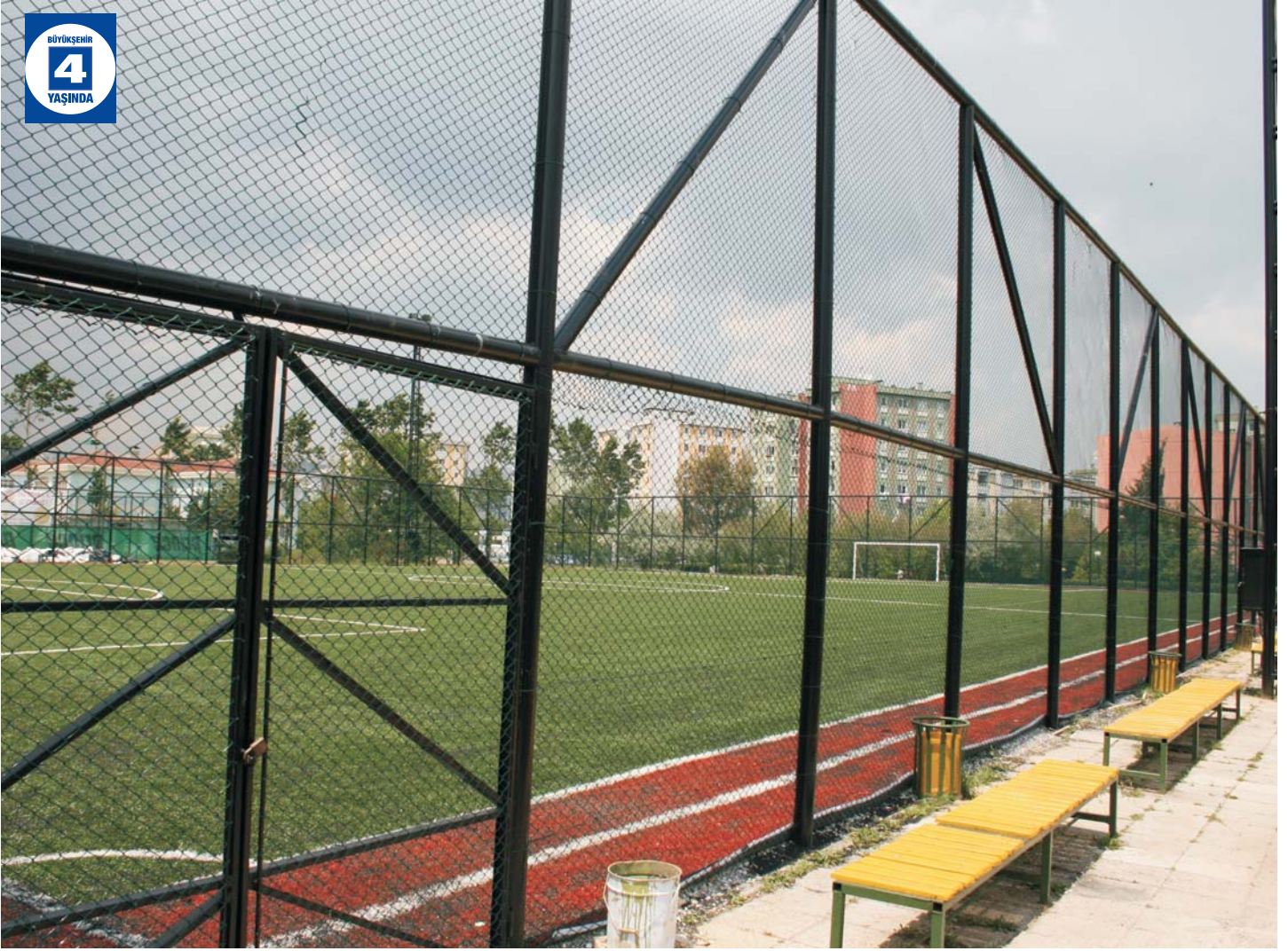
Bekirpaşa Yahya Kaptan Futbol Sahası