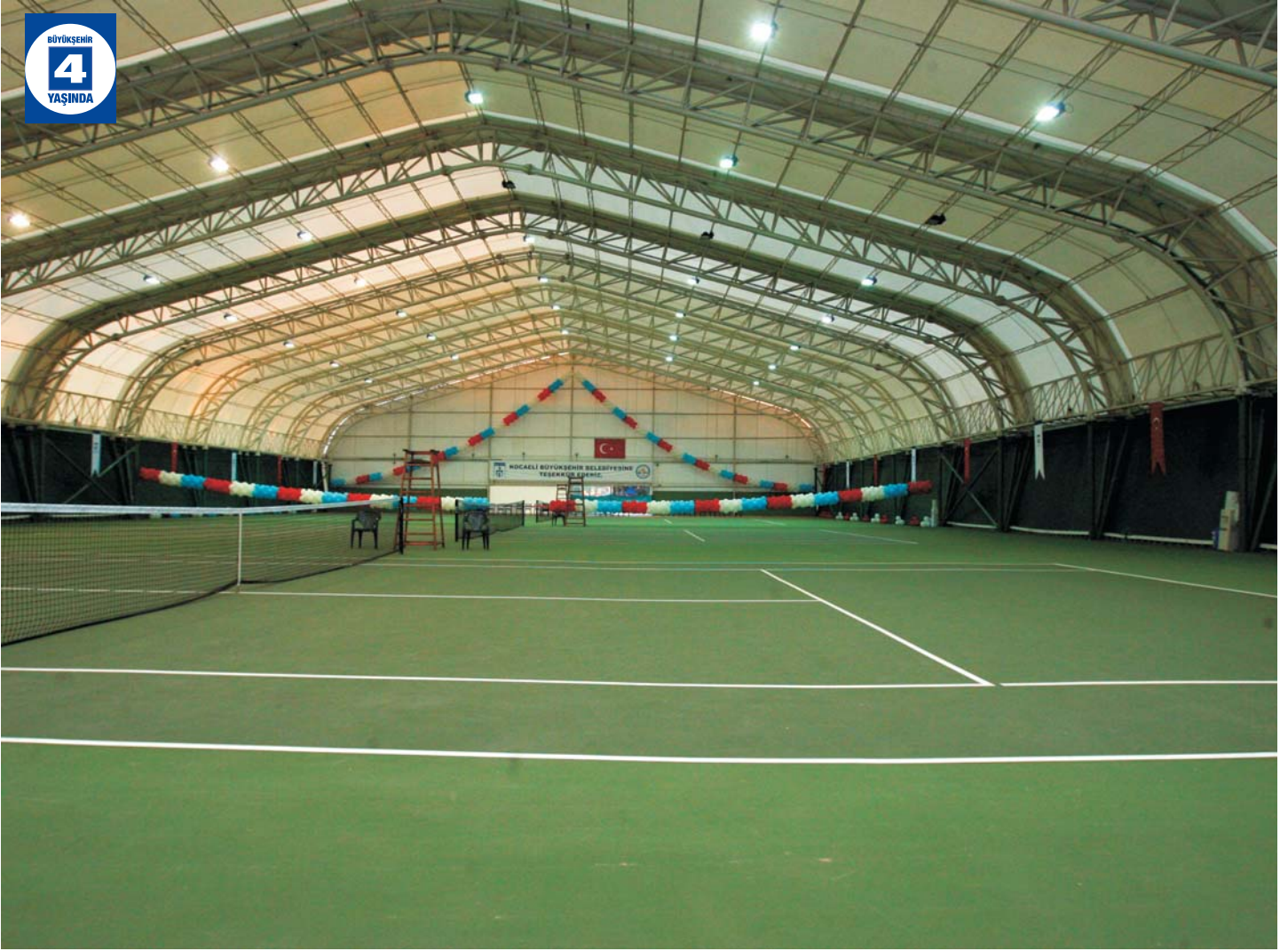
İzmit Tenis Kulübü Kapalı Tenis Kortu