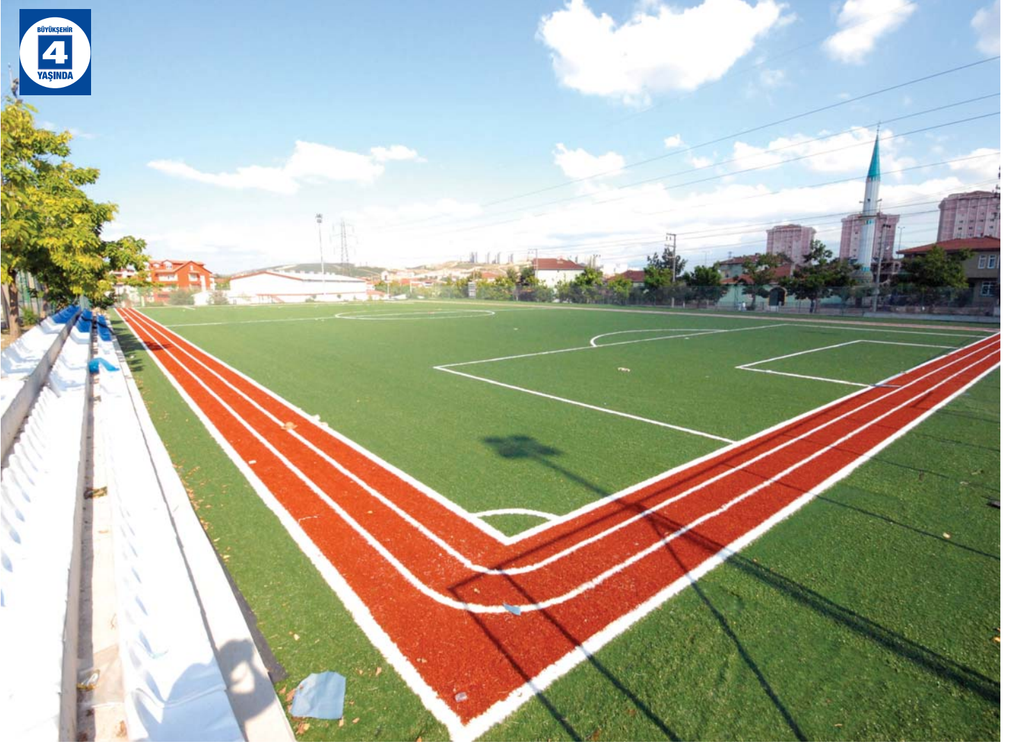
Yeşilova Spor Tesisi