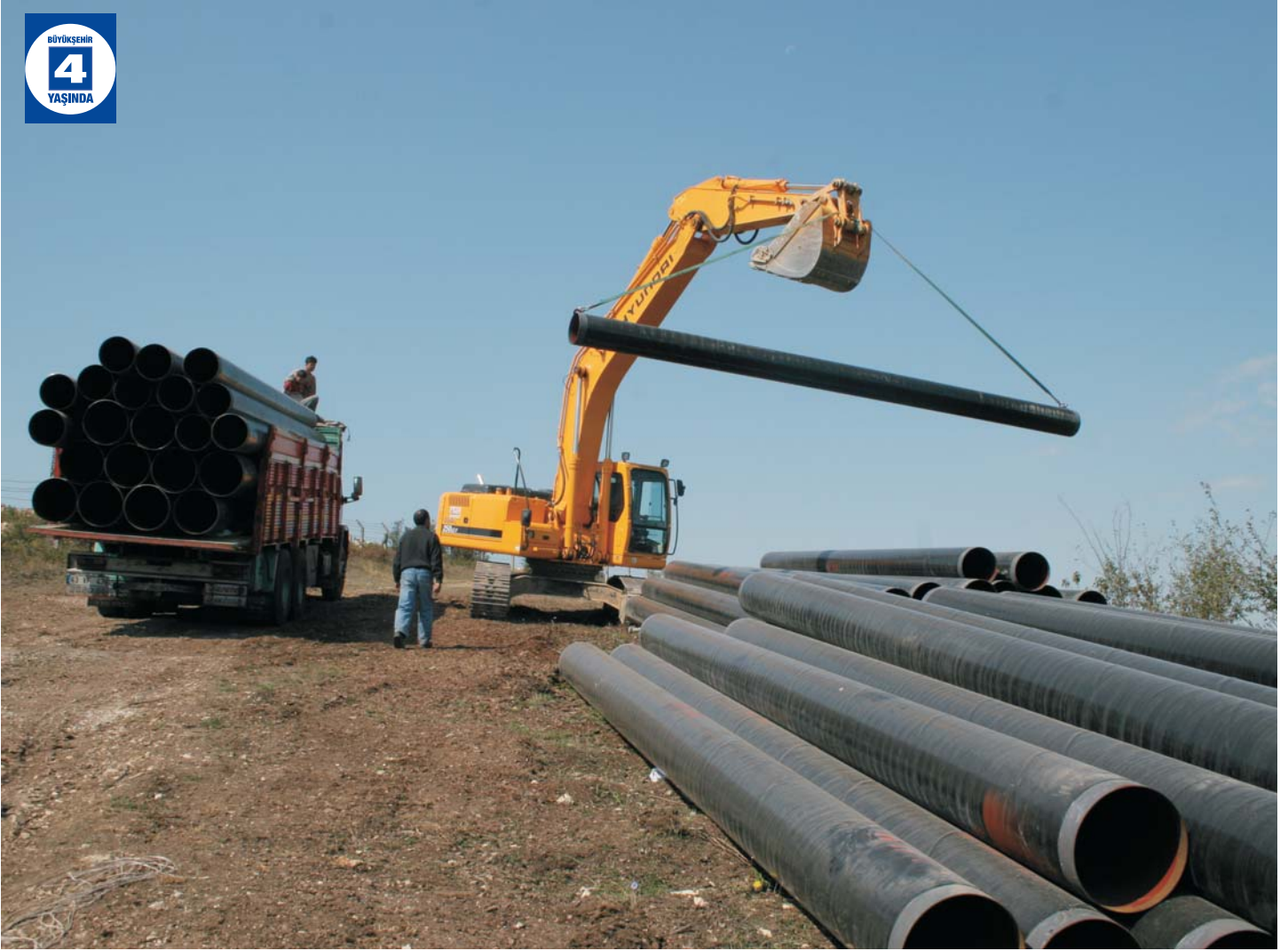
KOÜ Umuttepe Kampüsü Su Temini