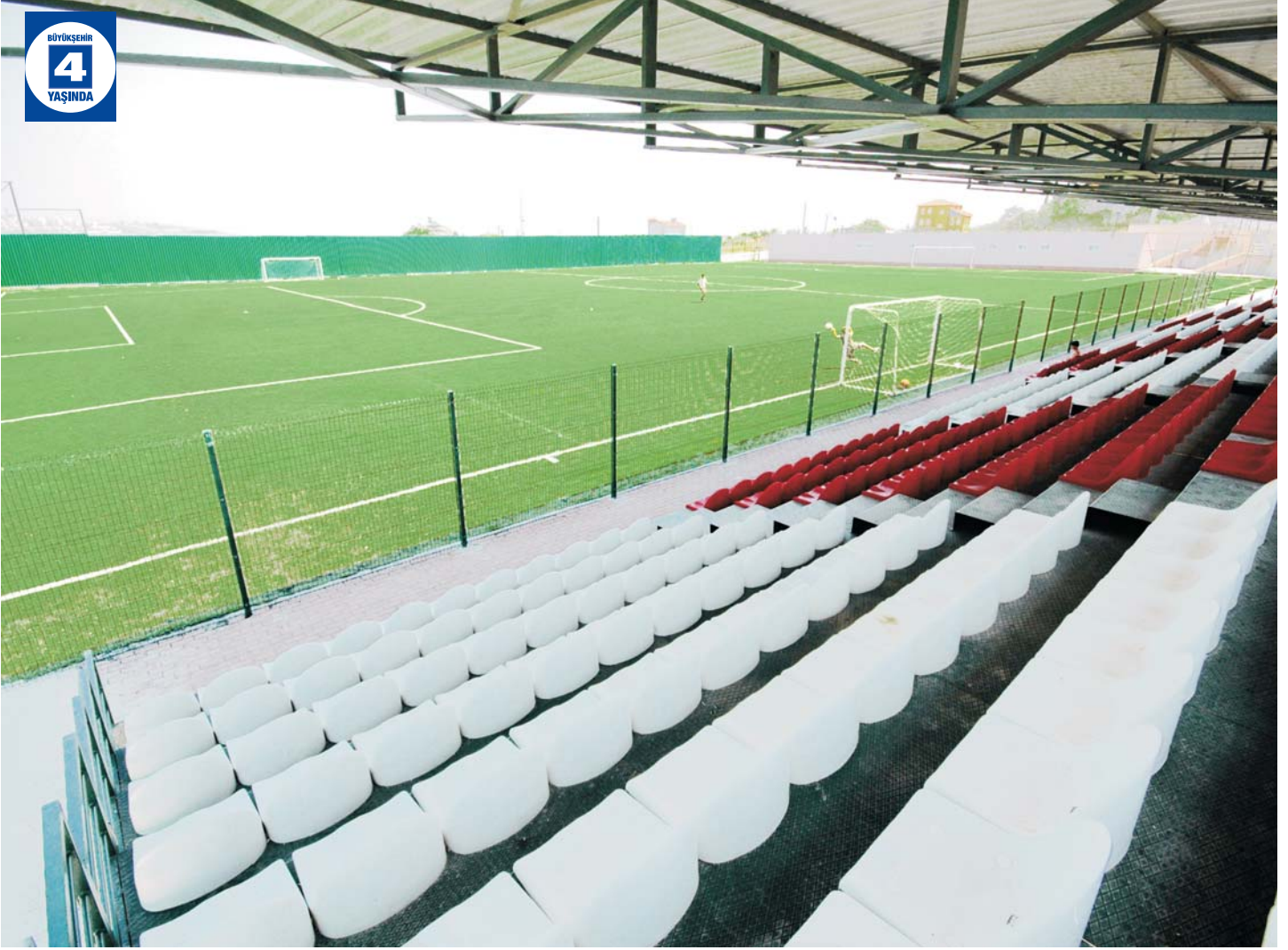
Izmit Orhan Mahallesi Spor Kompleksi