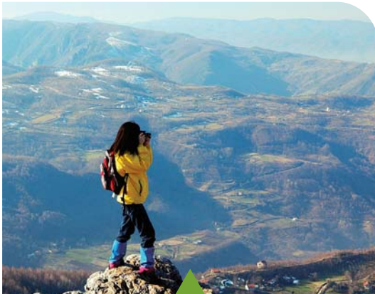
MESELA TREKKING PARKURLARI