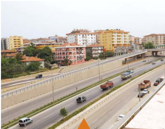
MESELA GEBZE TATLIKUYU KAVŞAĞI