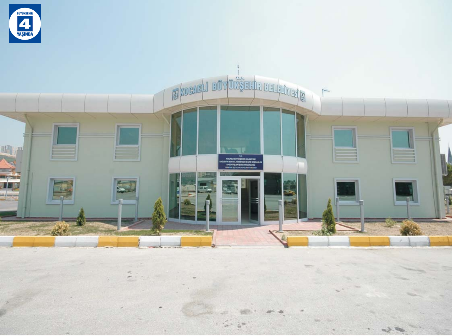
Bekirpaşa Otogar Sağlık ve Ambulans Merkezi