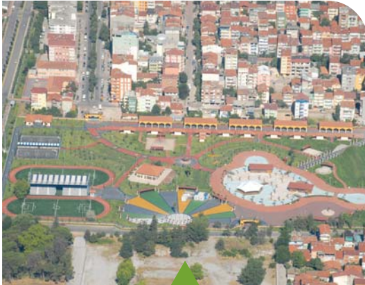
MESELA DOĞU KIŞLA GENÇLİK PARKI