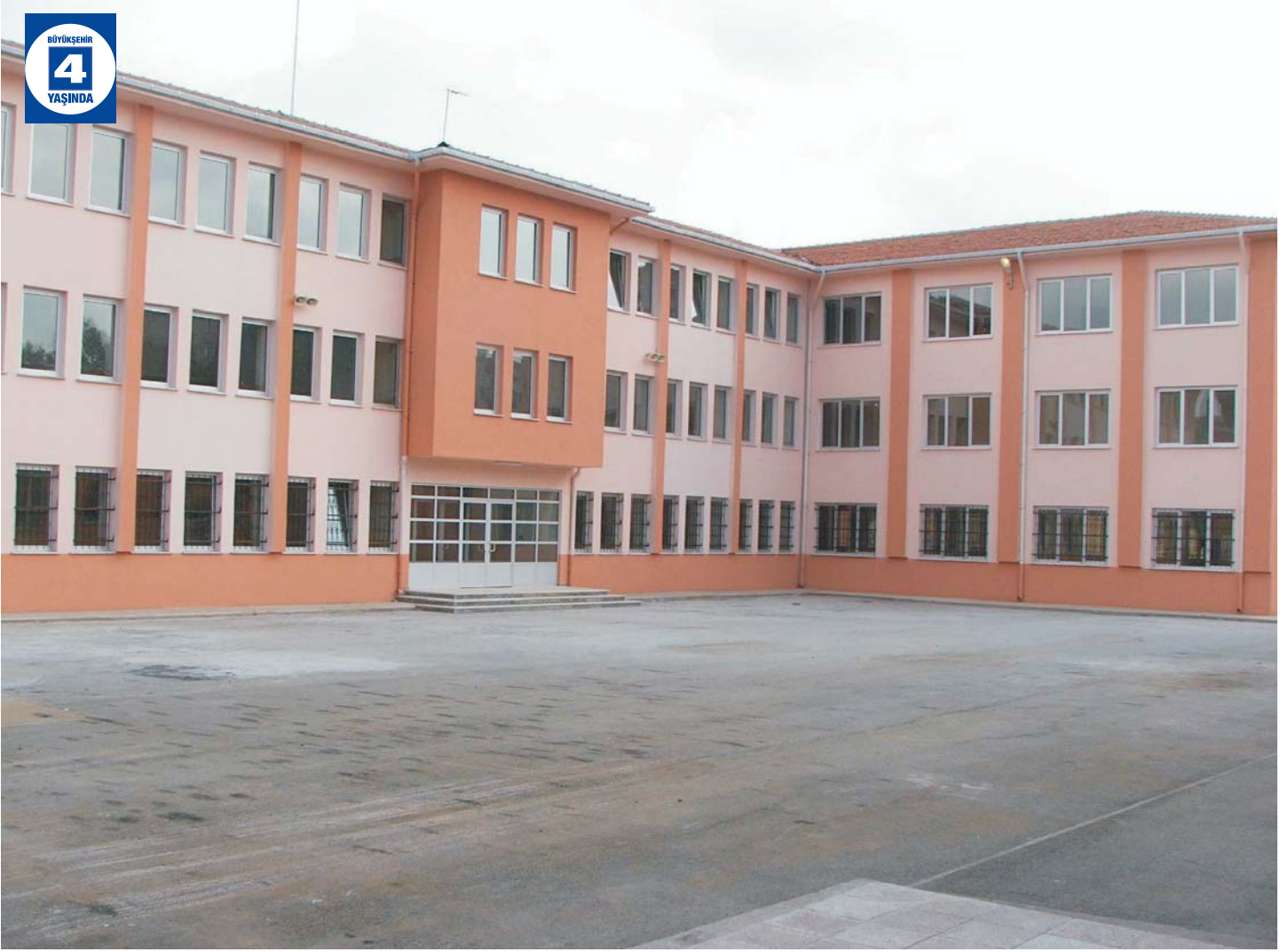
Kocaeli EML Ek Binası