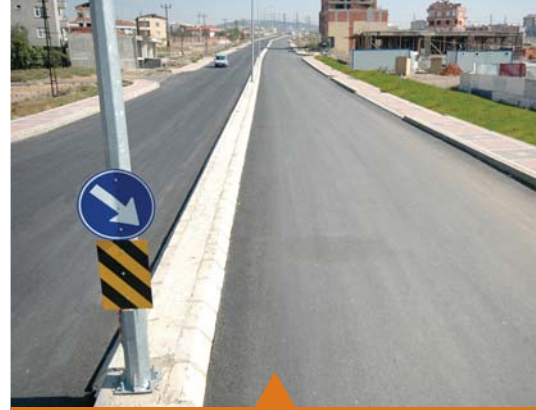
MESELA RAGIP DEMİRKOL BULVARI