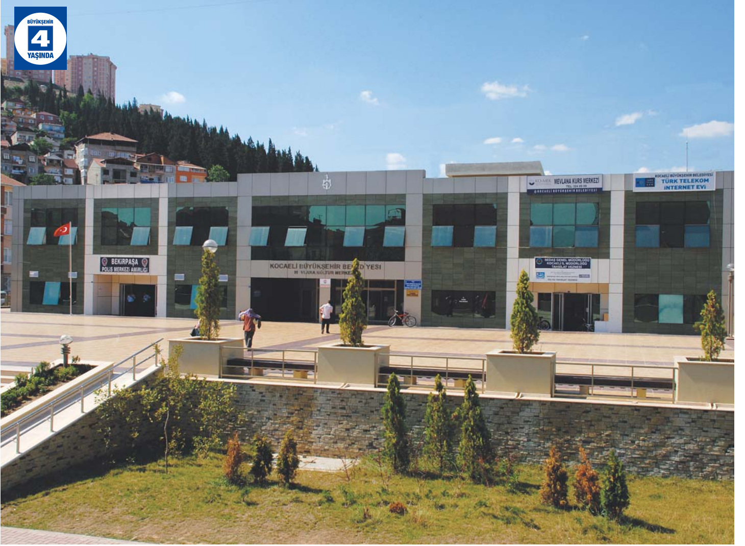
Mevlana Kültür Merkezi