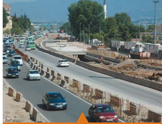
MESELA SEKA TÜNEL GEÇİŞİ