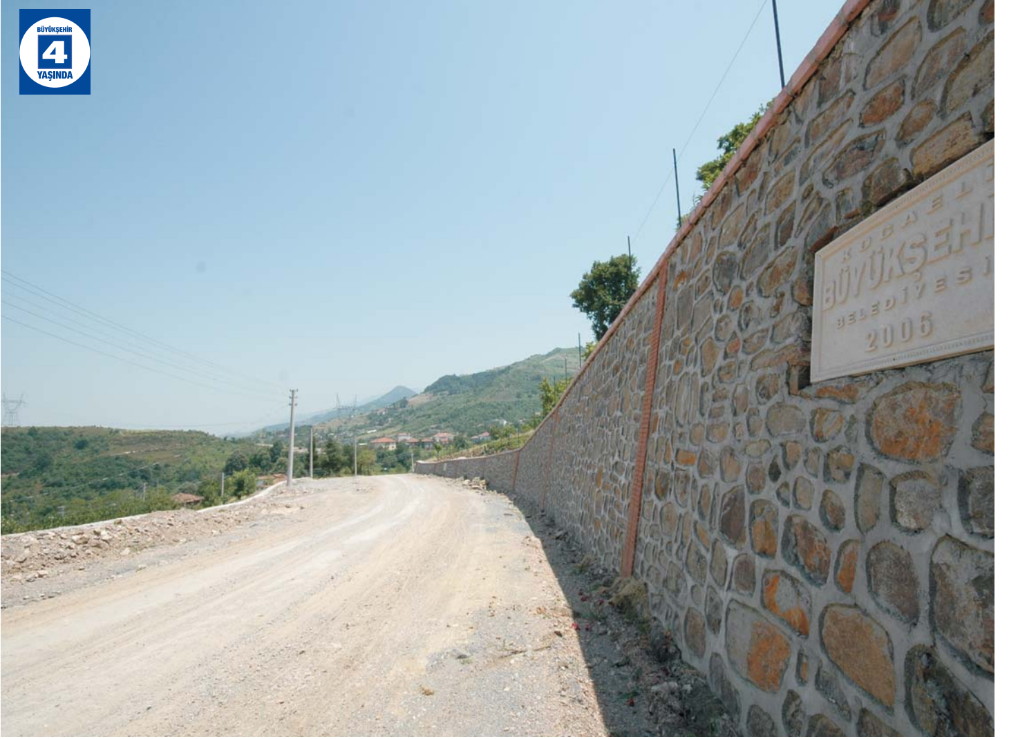
Yuvacık-Karşıyaka-Bahçecik Bağlantı Yolu