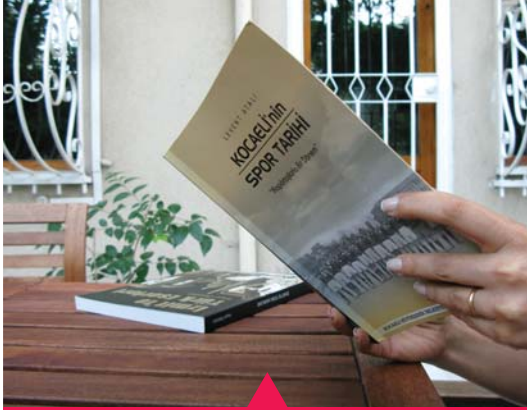
MESELA KÜLTÜR YAYINLARI