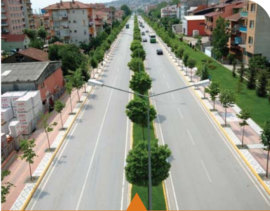
MESELA ŞEHİT RAFET KARACAN BULVARI