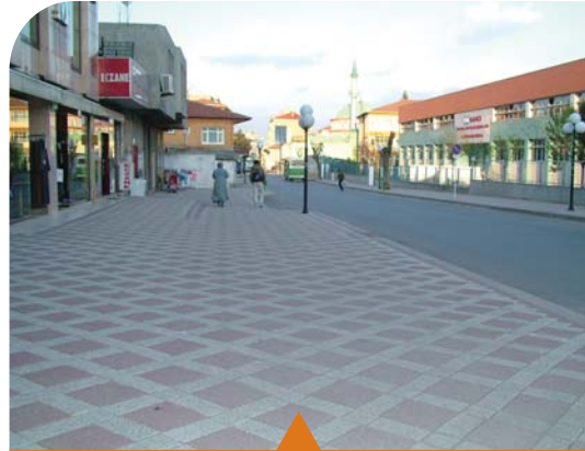
MESELA DENİZCİLER CADDESİ