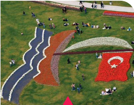
MESELA LALE FESTİVALİ