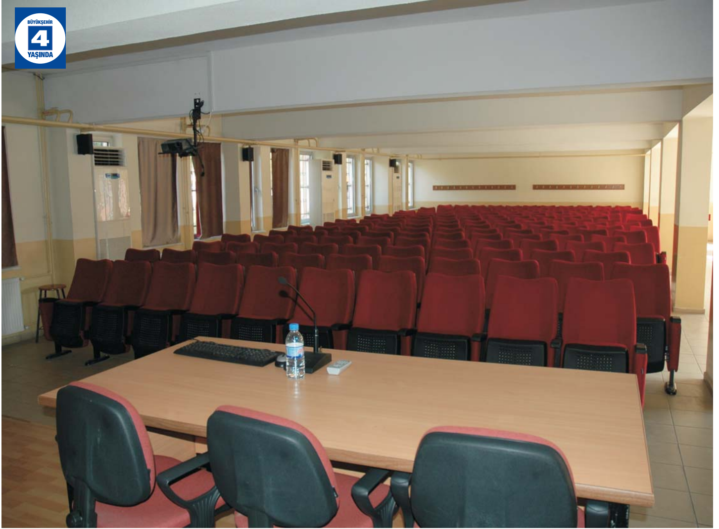
Bahçecik Körfez İlköğretim Okulu'na Konferans Salonu

Karşıyaka Kültür Sarayı çevre düzenlemesi Karşıyaka Cumhuriyet, Mimar Sinan, Atatürk, Pınar, Fatih, İbni Sina Caddeleri soğuk yol çizgisi yapımı Karşıyaka Bağdat Caddesi ve çevresi taş duvar yapımı Bahçecik Sosyal Hizmet Binası'nda kullanılmak üzere mermer ve ısıcam alımı Kullar Kavşağı'na bitki ve çim ekimi