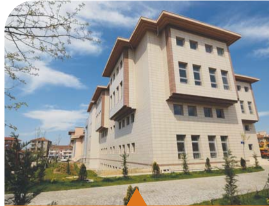
MESELA KÜLTÜR MERKEZLERİ