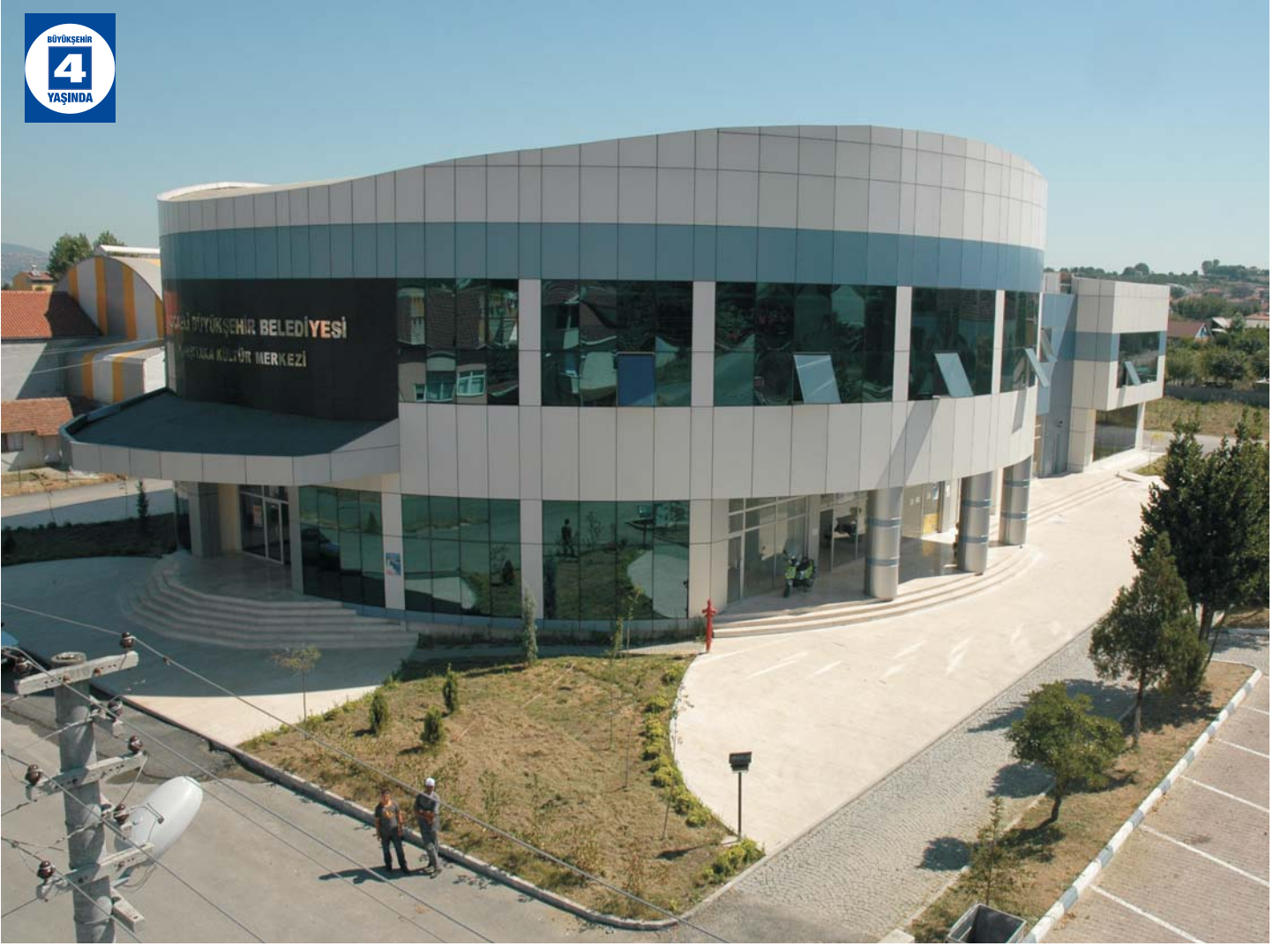
Karşıyaka Kültür Merkezi