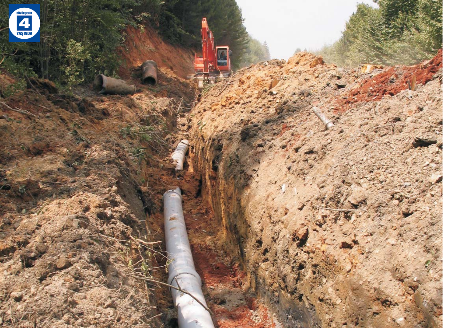
Servetiye Karşı Grubu İçme Suyu İsale Hattı ve Su Deposu