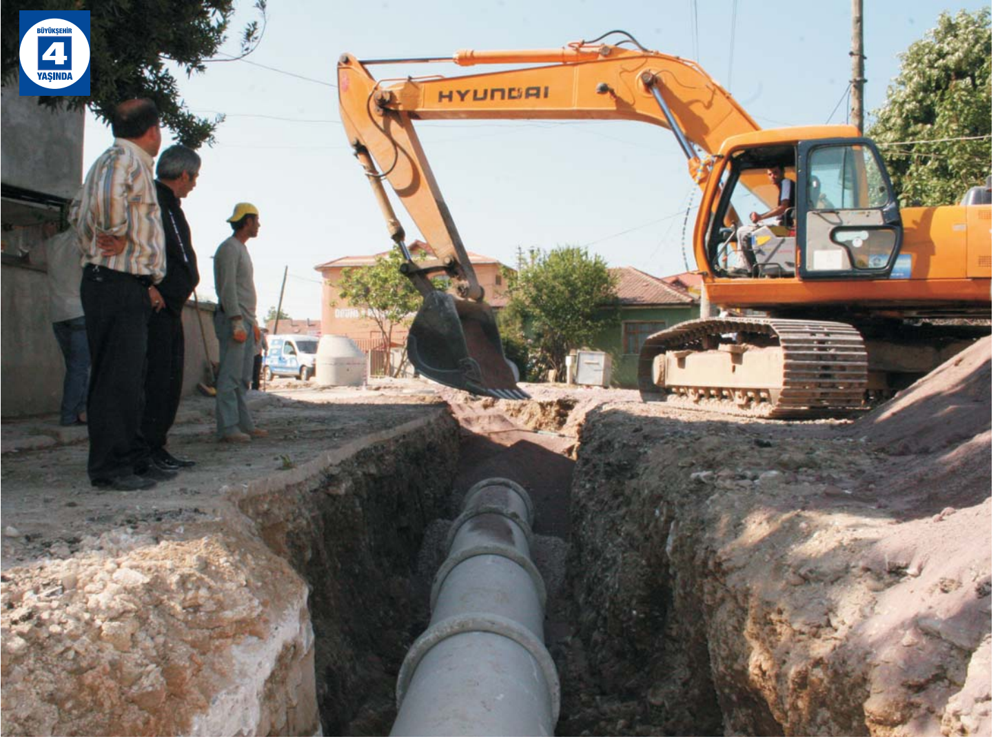
Kanalizasyon ve Yağmur Suyu Hattı Çalışmaları