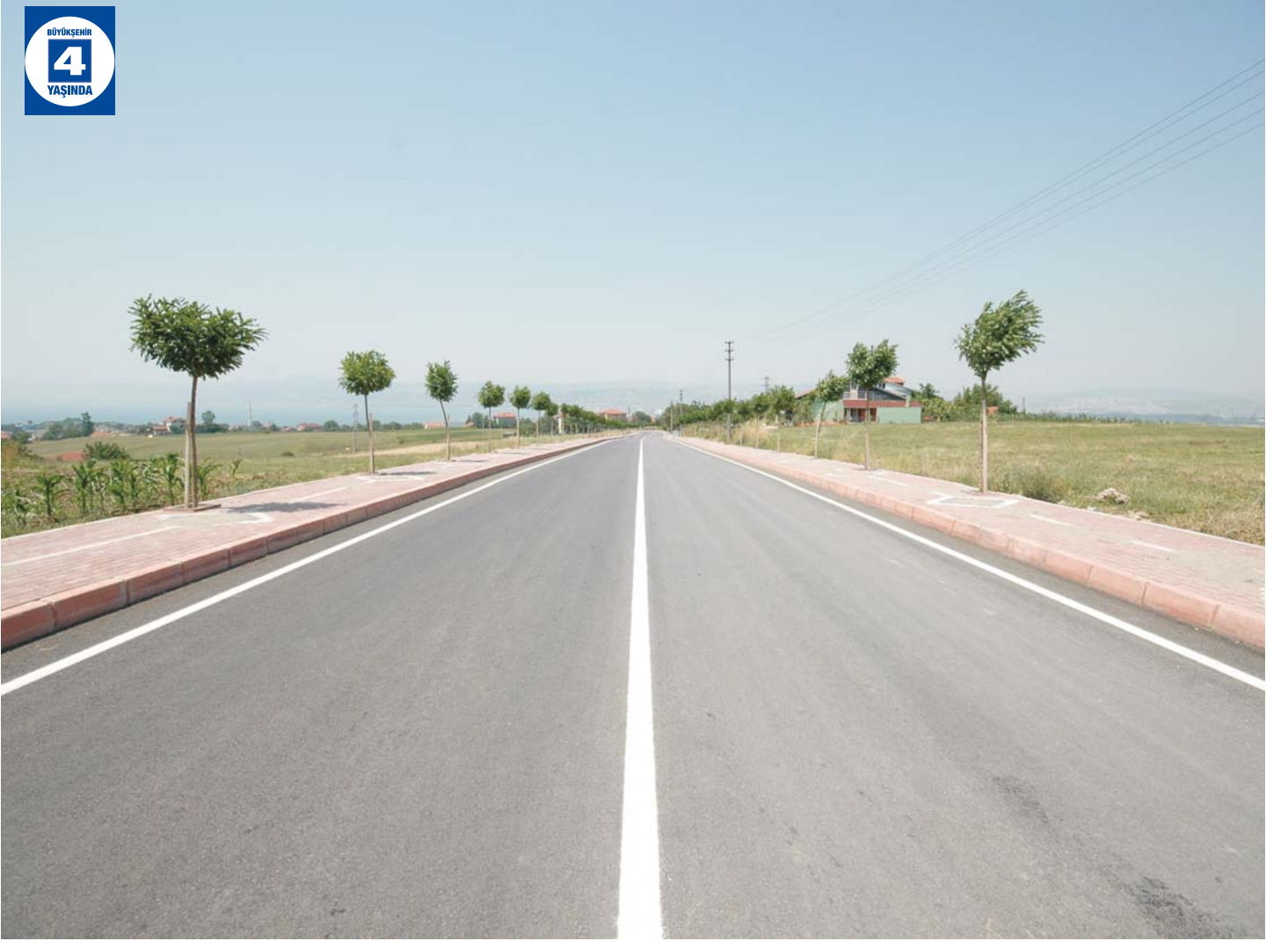
Yuvacık Tınaztepe Yolu