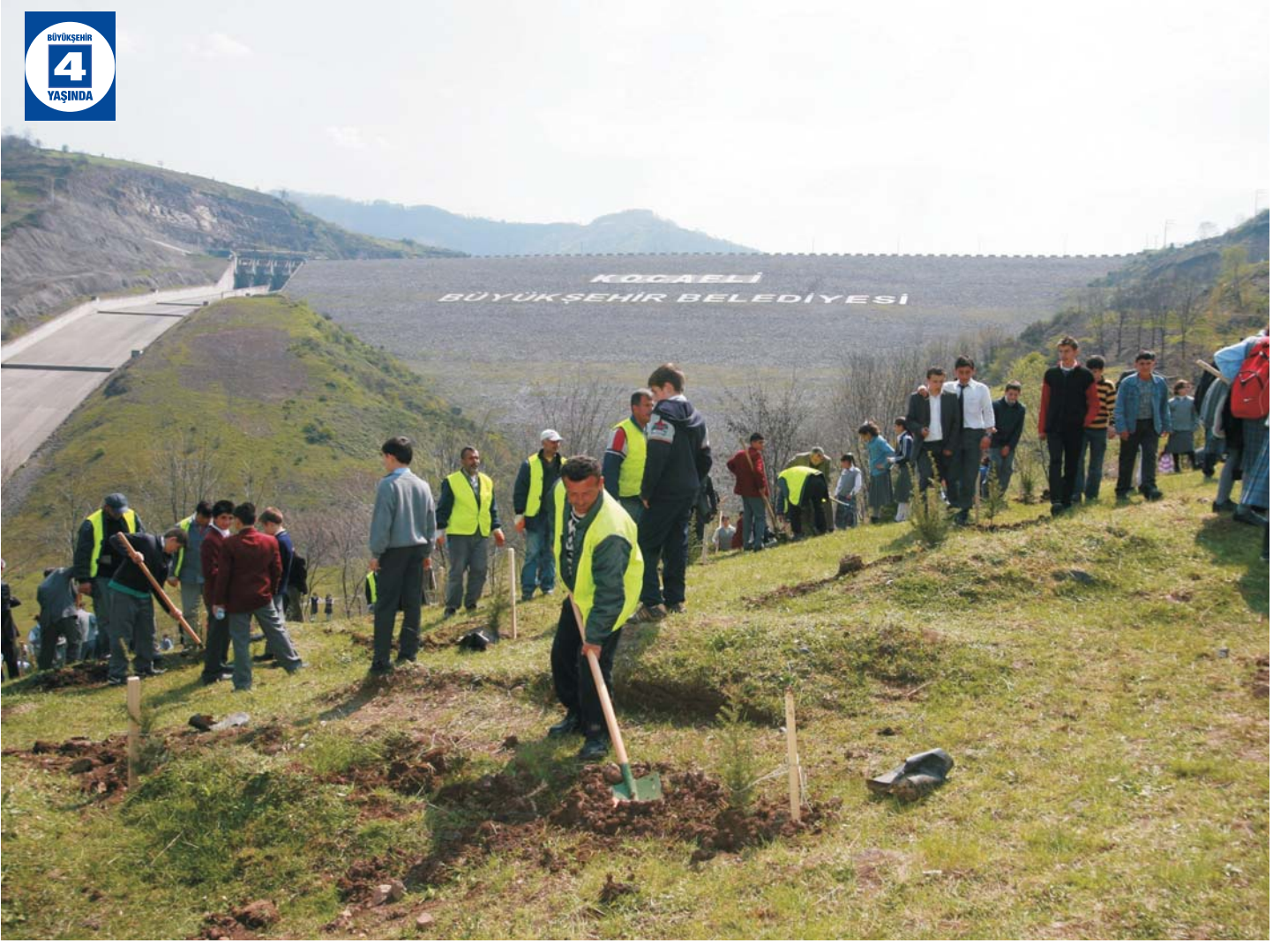
Yuvacık Barajı Çevre Düzenlemesi