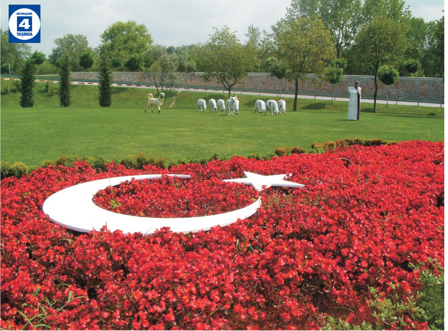
Başiskele Çevre Düzenlemeleri