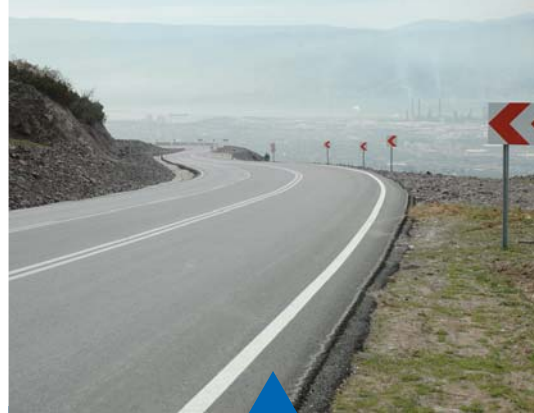
MESELA KÖRFEZ HAYAT YOLU