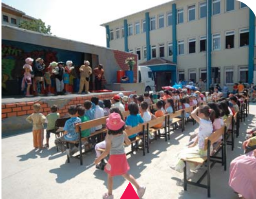
MESELA TİR TİYATROSU