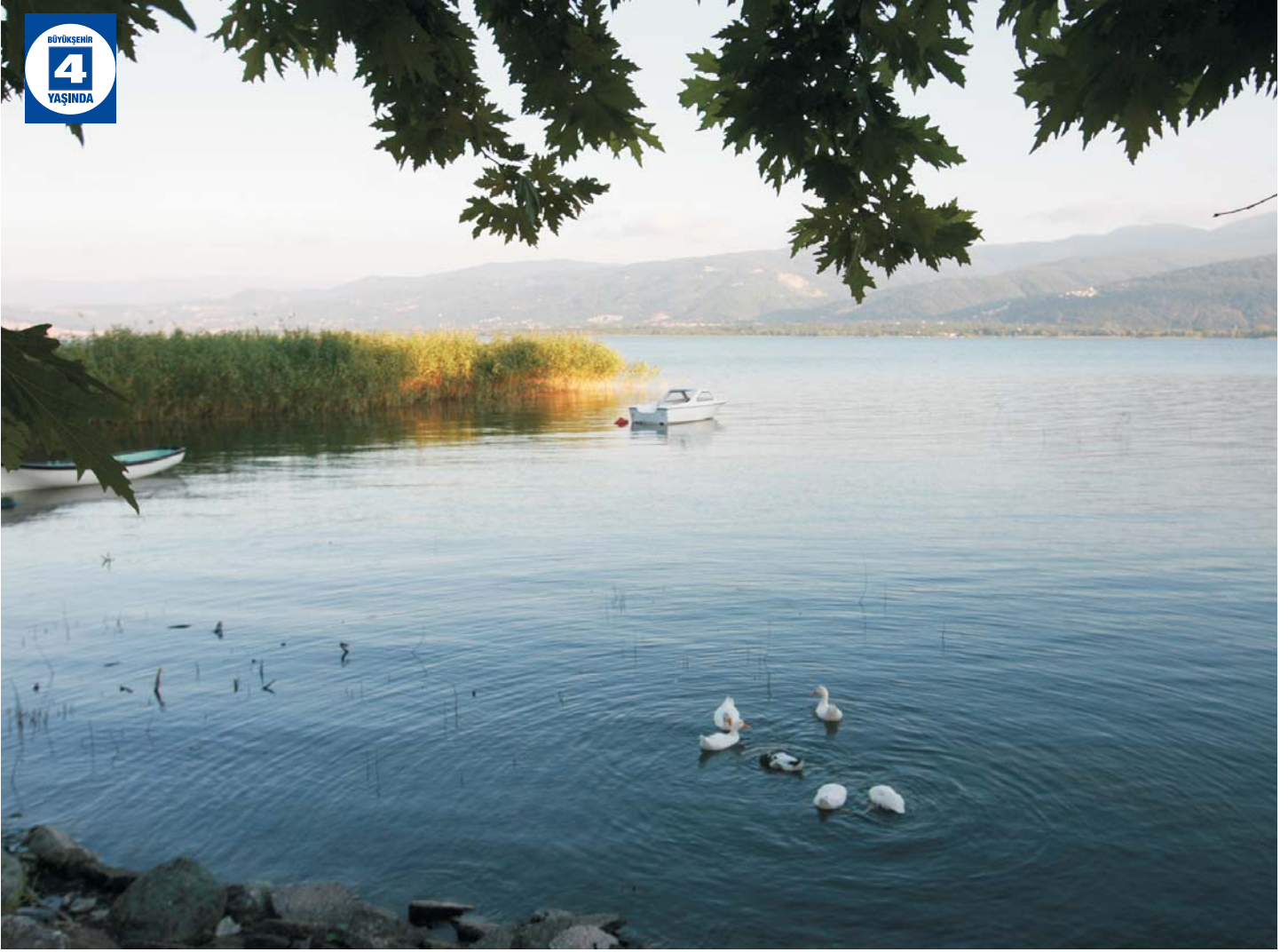
Yuvacık- Sapanca İçme Suyu Hattı ve Terfi Merkezi