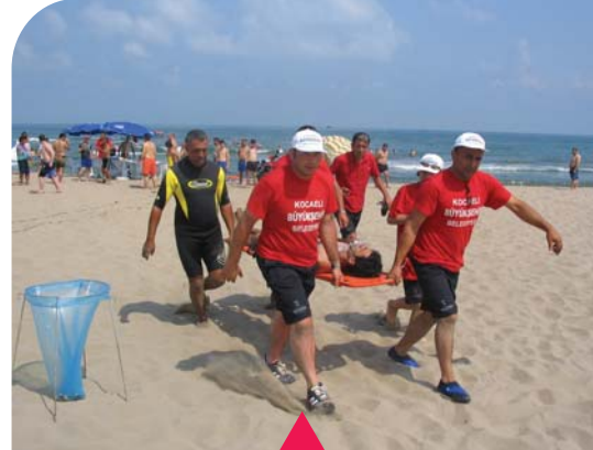
MESELA SAHİL GÜVENLİK