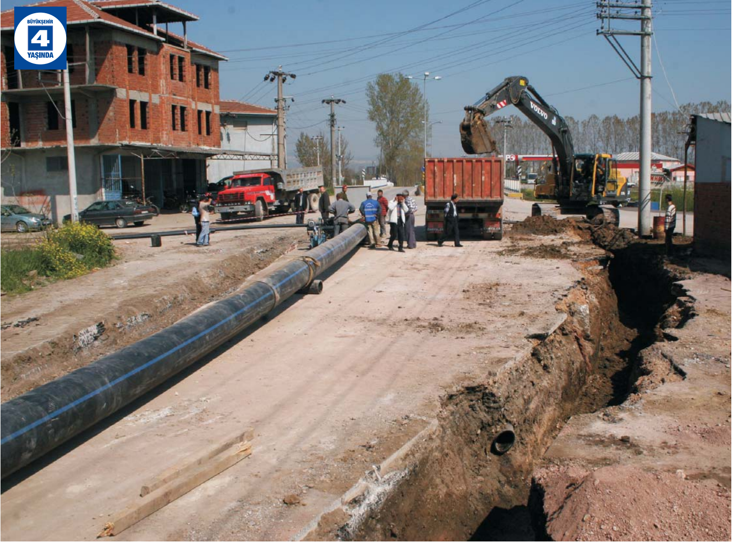
İçme Suyu Hattı Çalışmaları