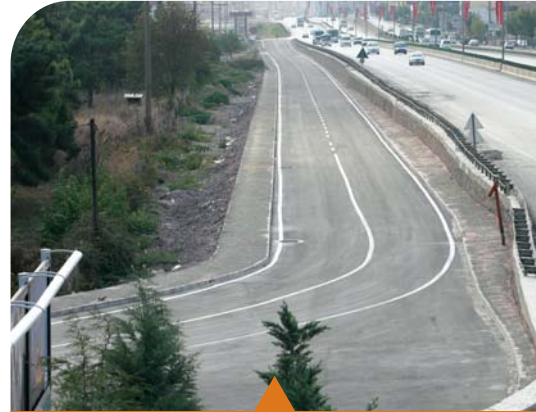
MESELA DERİNCE RO-RO YOLU