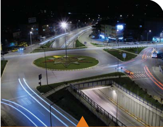
MESELA ESKİHİSAR TÜNEL GEÇİŞİ