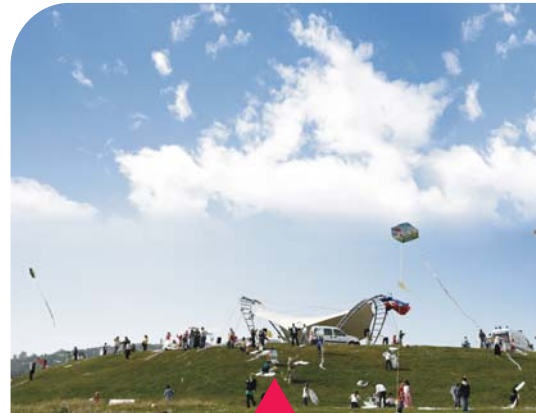
MESELA UÇURTMA ŞENLİĞİ