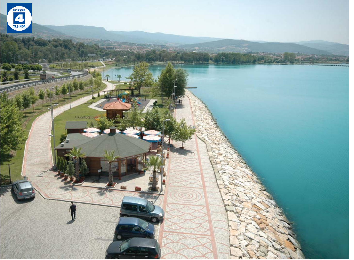
Başiskele Sahil Parkı - Naila Kafe