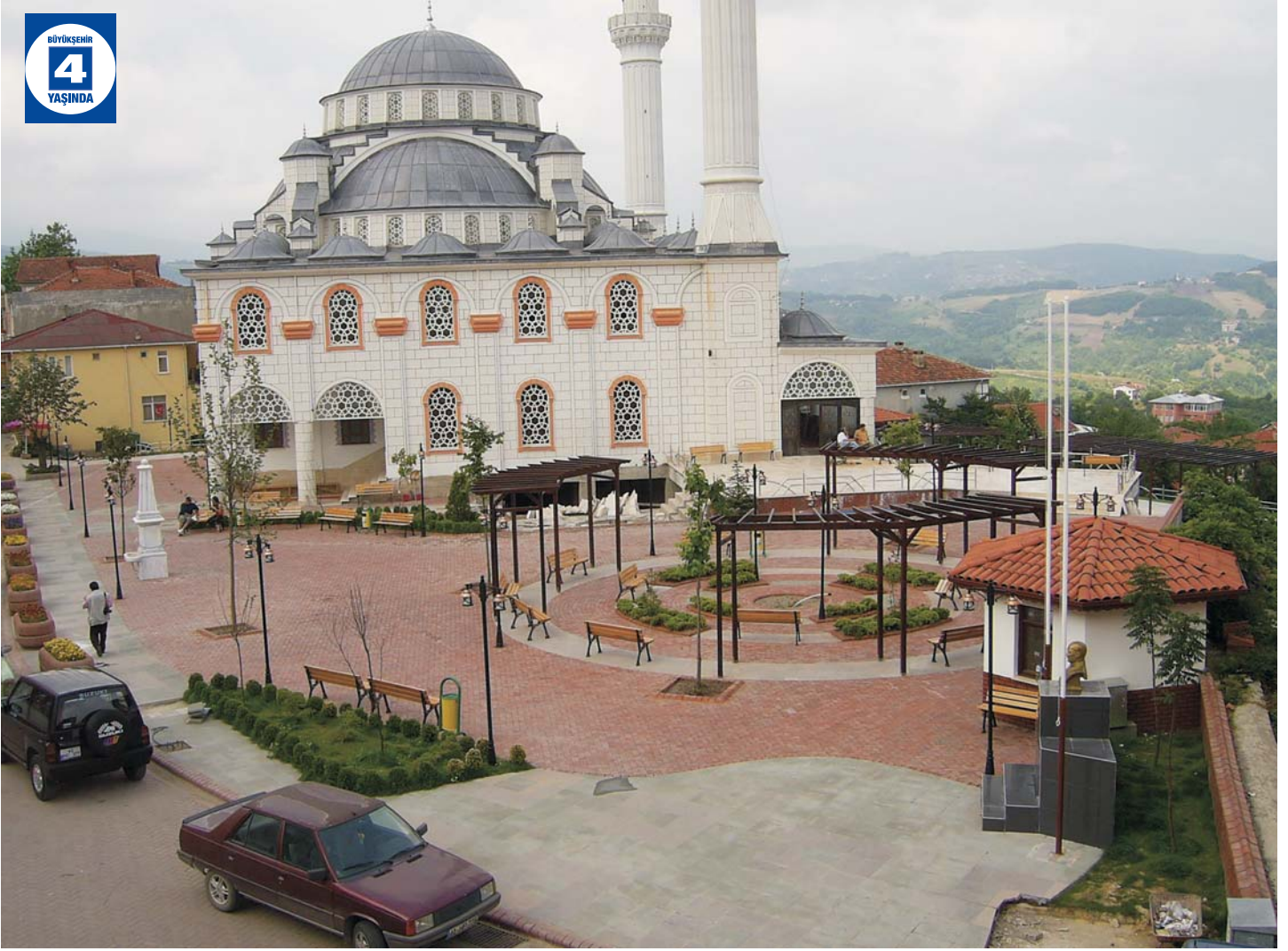
Bahçecik Meydan Düzenlemesi