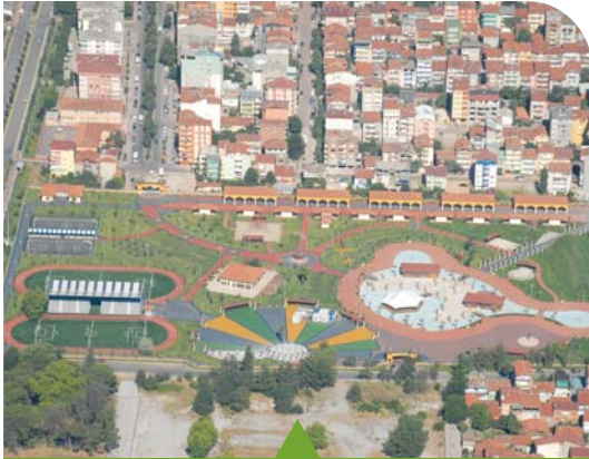
MESELA DOĞU KIŞLA GENÇLİK PARKI