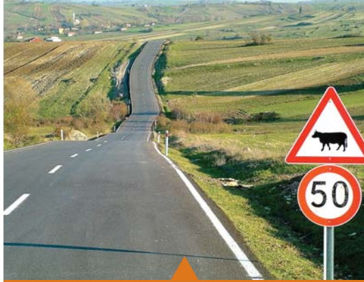
MESELA KÖYLERE HİZMET