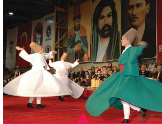
MESELA SEVGİDE BULUŞALIM