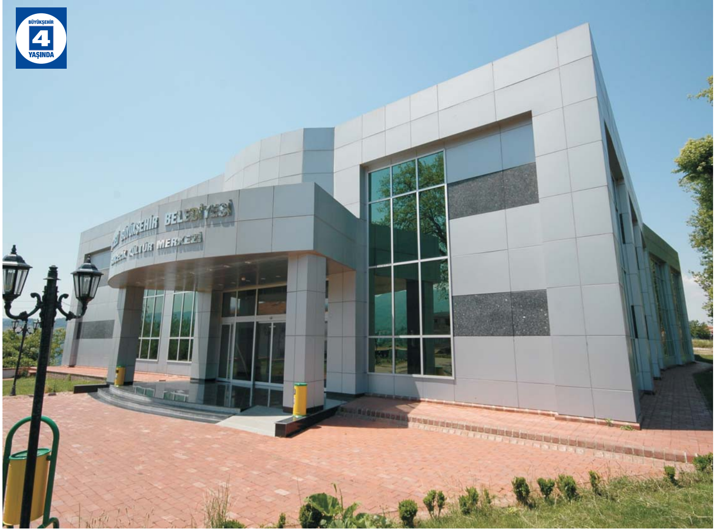
Bahçecik Kültür Merkezi