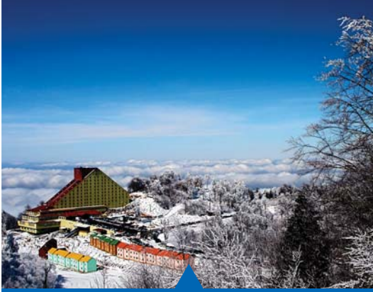
MESELA KARTEPE'YE DOĐALGAZ