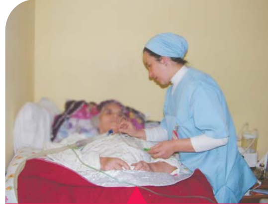
MESELA EVDE BAKIM