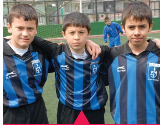
MESELA AMATÖR KULÜPLERE DESTEK