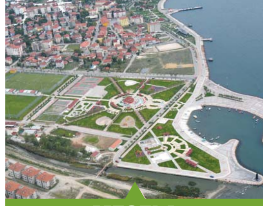
MESELA BARBAROS HAYRETTİN PAŞA PARKI