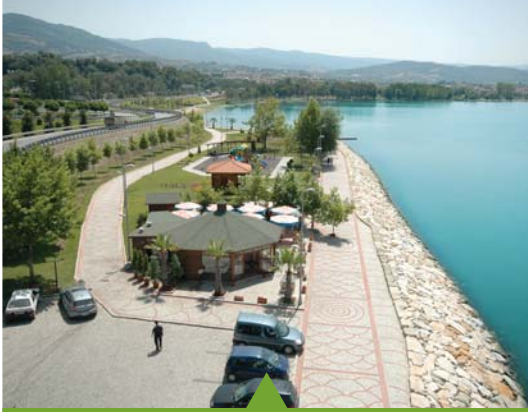
MESELA BAŞISKELE SAHİL PARKI