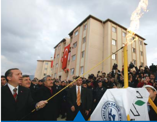
MESELA DOĞALGAZ YATIRIMLARI