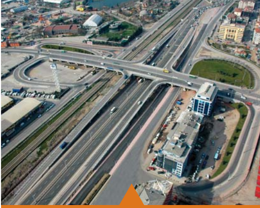
MESELA ADALET KÖPRÜSÜ