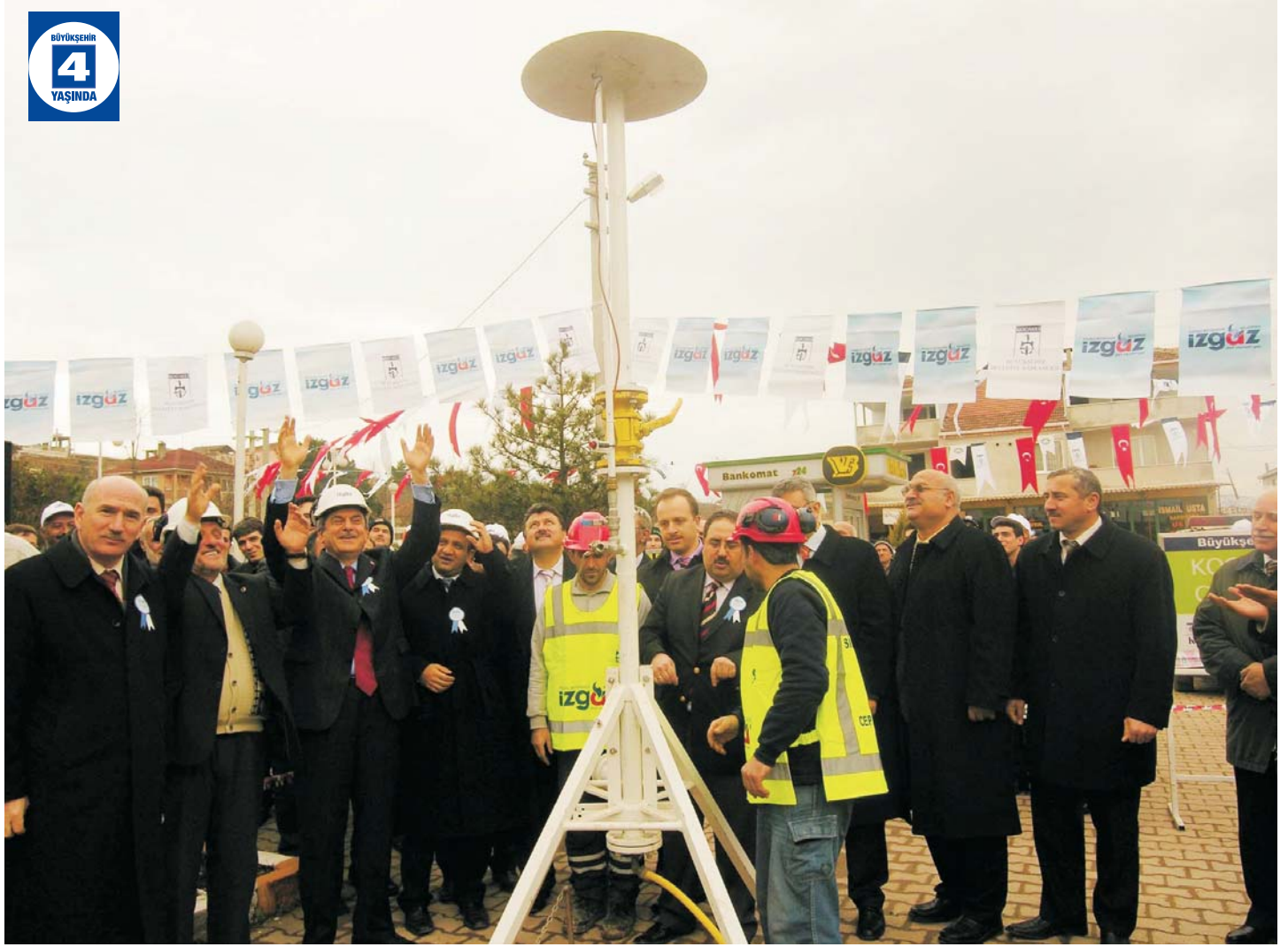
Başiskele'ye Doğalgaz Verilmesi