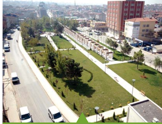
MESELA GEBZE EŞREF BİTLİS PARKI