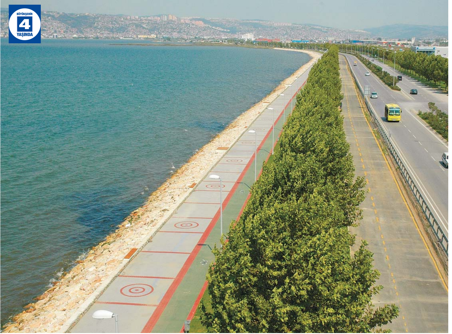
Başiskele Sahil Yürüyüş Yolu