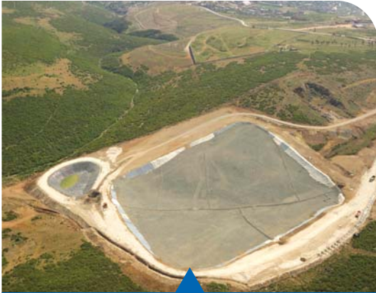
MESELA DÜZENLİ DEPOLAMA