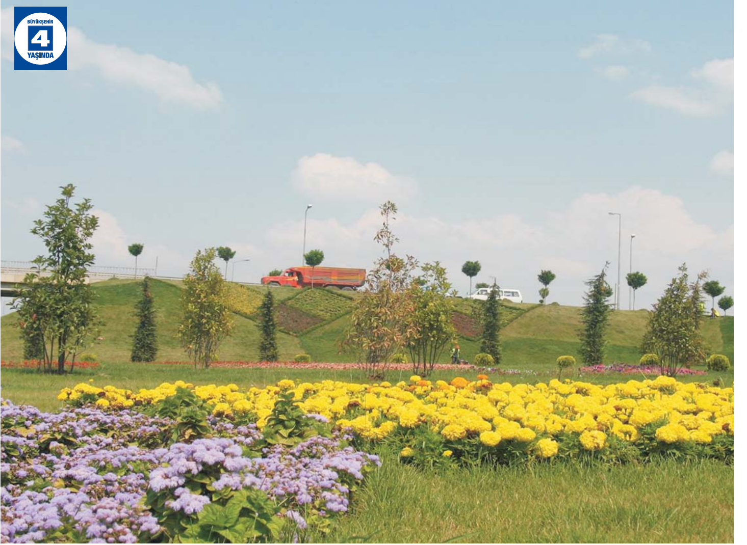
Yeniköy Köprülü Kavşağı Çevre Düzenlemesi