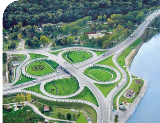
MESELA KAVŞAK DÜZENLEMELERİ