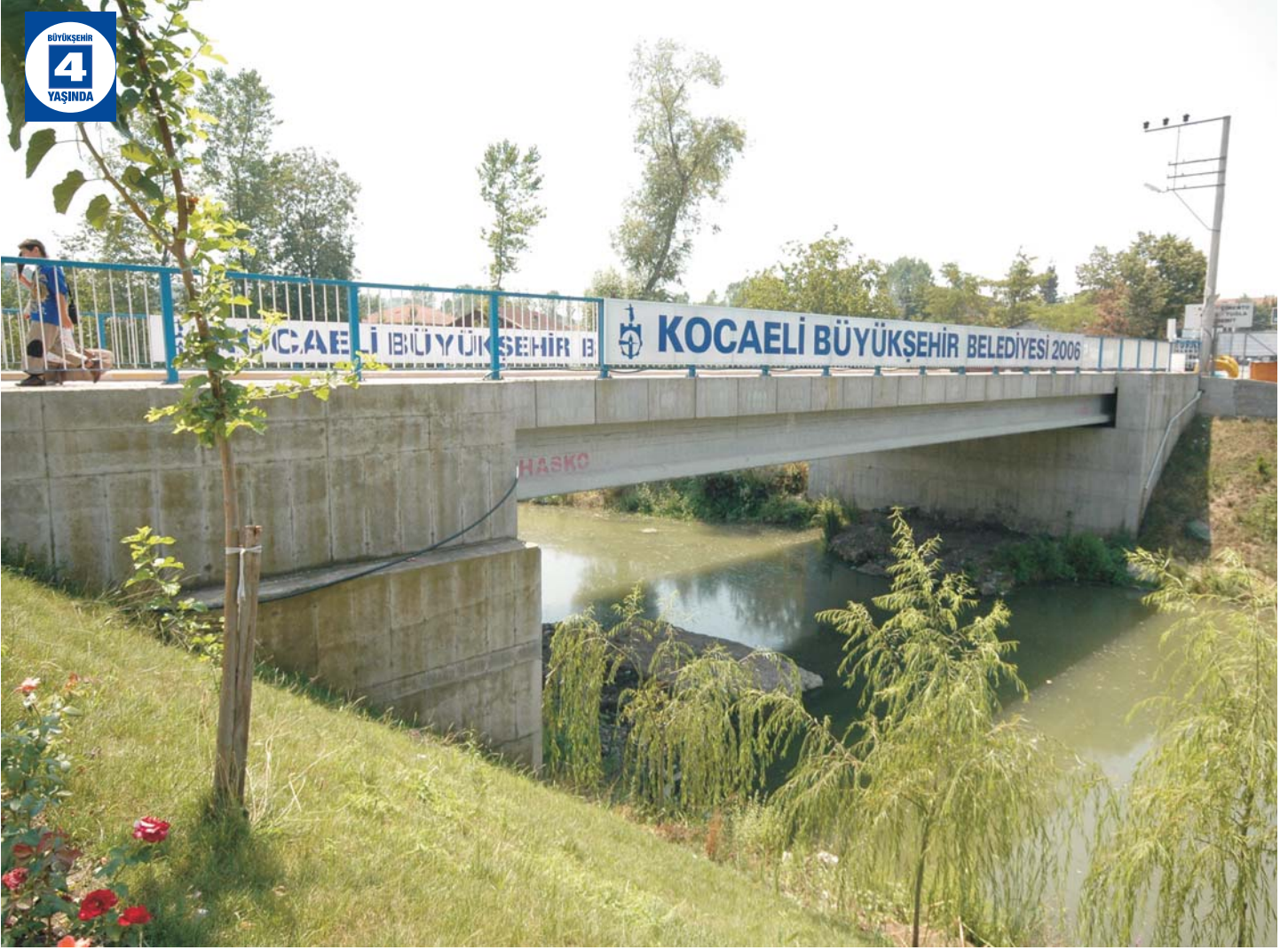
Kullar Merkez Köprüsü