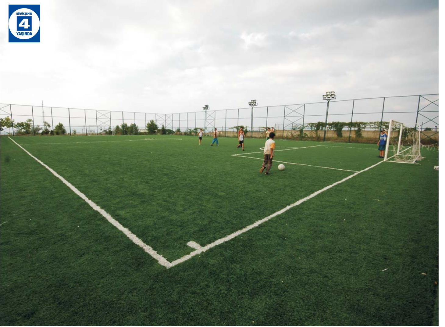
SHÇEK 75.Yıl Erkek Öğrenci Yurdu'na Sentetik Çim Halı Saha