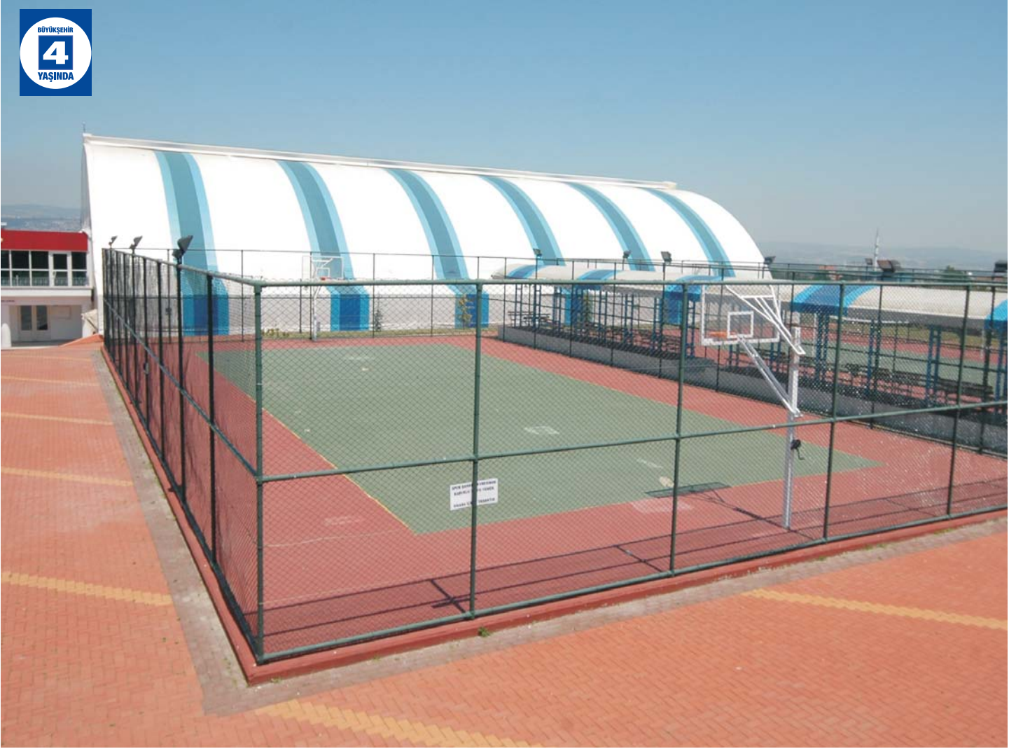
Yuvacık Aydınkent Spor Kompleksi