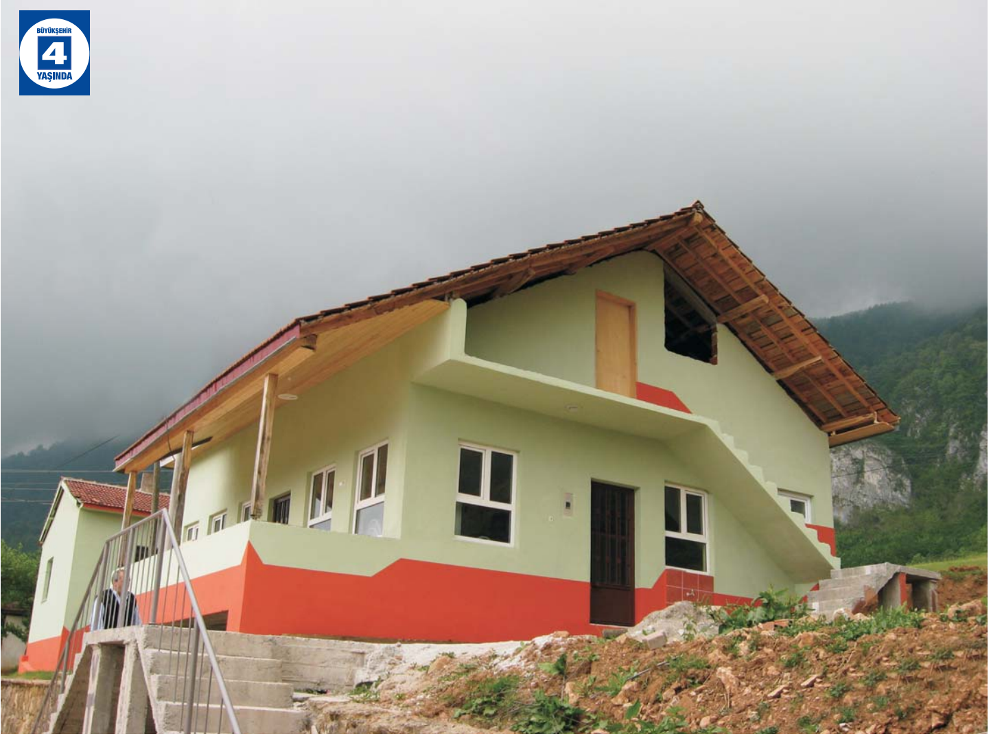
Köy Konaklarına Malzeme Yardımı