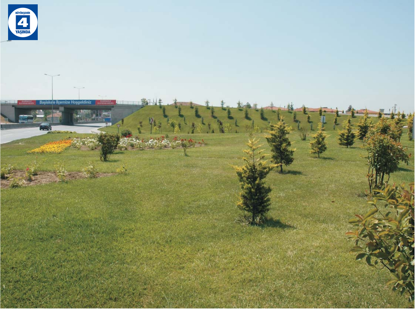
Karşıyaka Köprülü Kavşağı Çevre Düzenlemesi