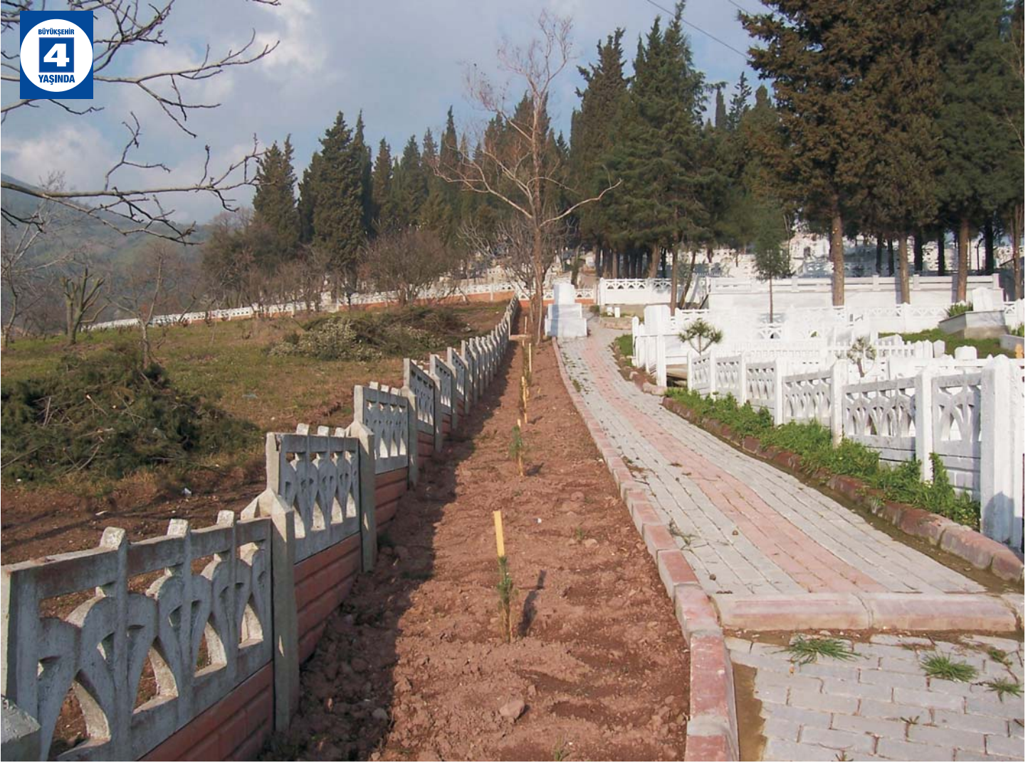
Başiskele Genelinde Mezarlık ve Parke Yol Düzenlemeleri