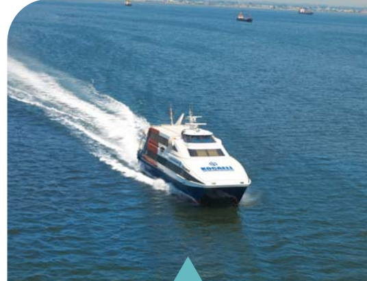
MESELA DENİZ ULAŞIMI