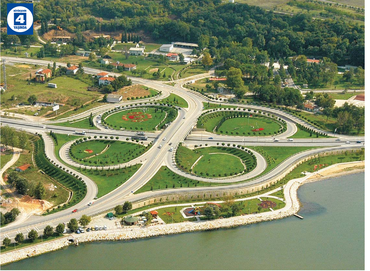
Başiskele Köprülü Kavşağı Çevre Düzenlemesi