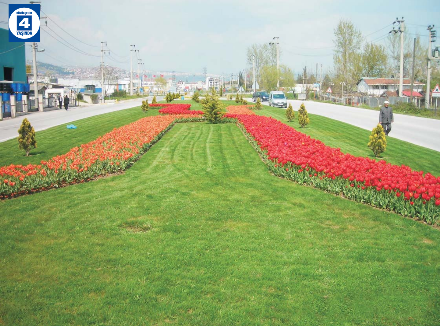
Kullar Köprülü Kavşağı Çevre Düzenlemesi