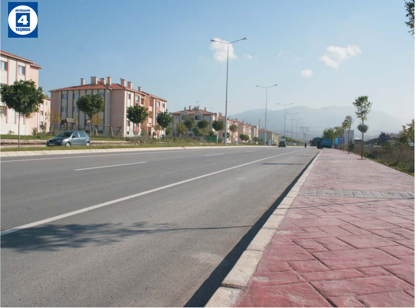
Yeniköy Vatan Caddesi Altyapı ve Üstyapı Düzenlemesi