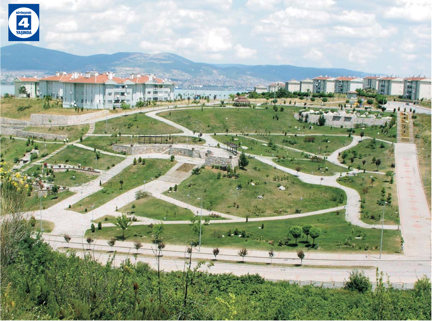
Yuvacık Koray Aydın Parkı Yenilenmesi