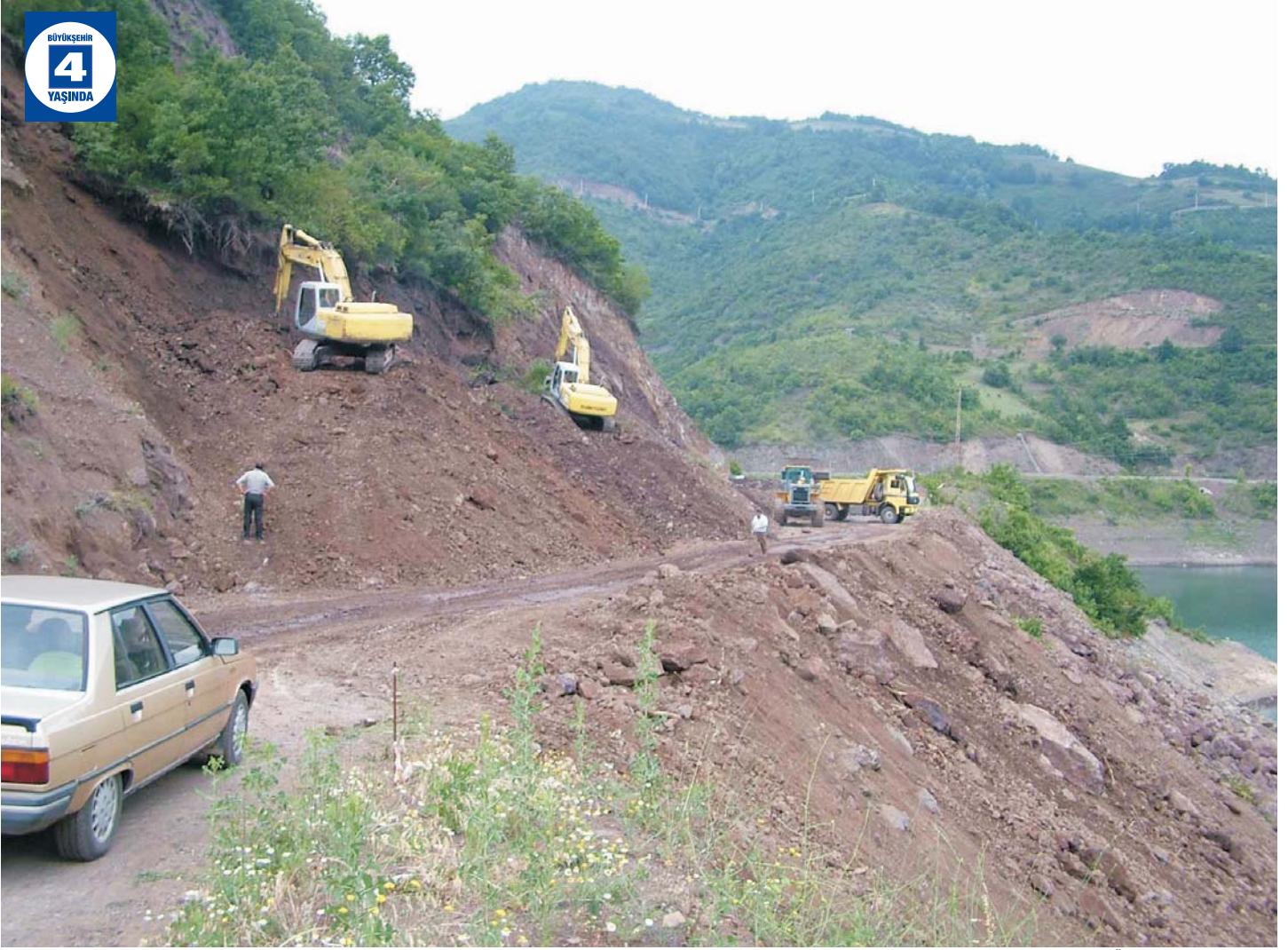
Yuvacık Baraj Yolu Heyelan Önleme Taş Duvar Yapımı