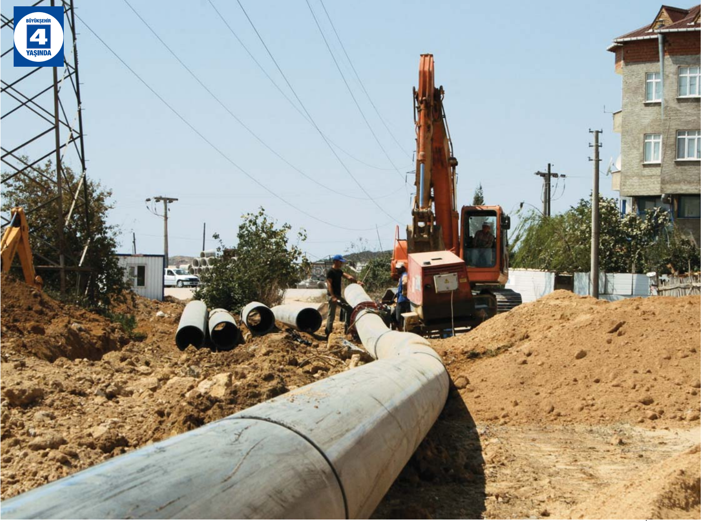
Şekerpınar İçme Suyu Hattı