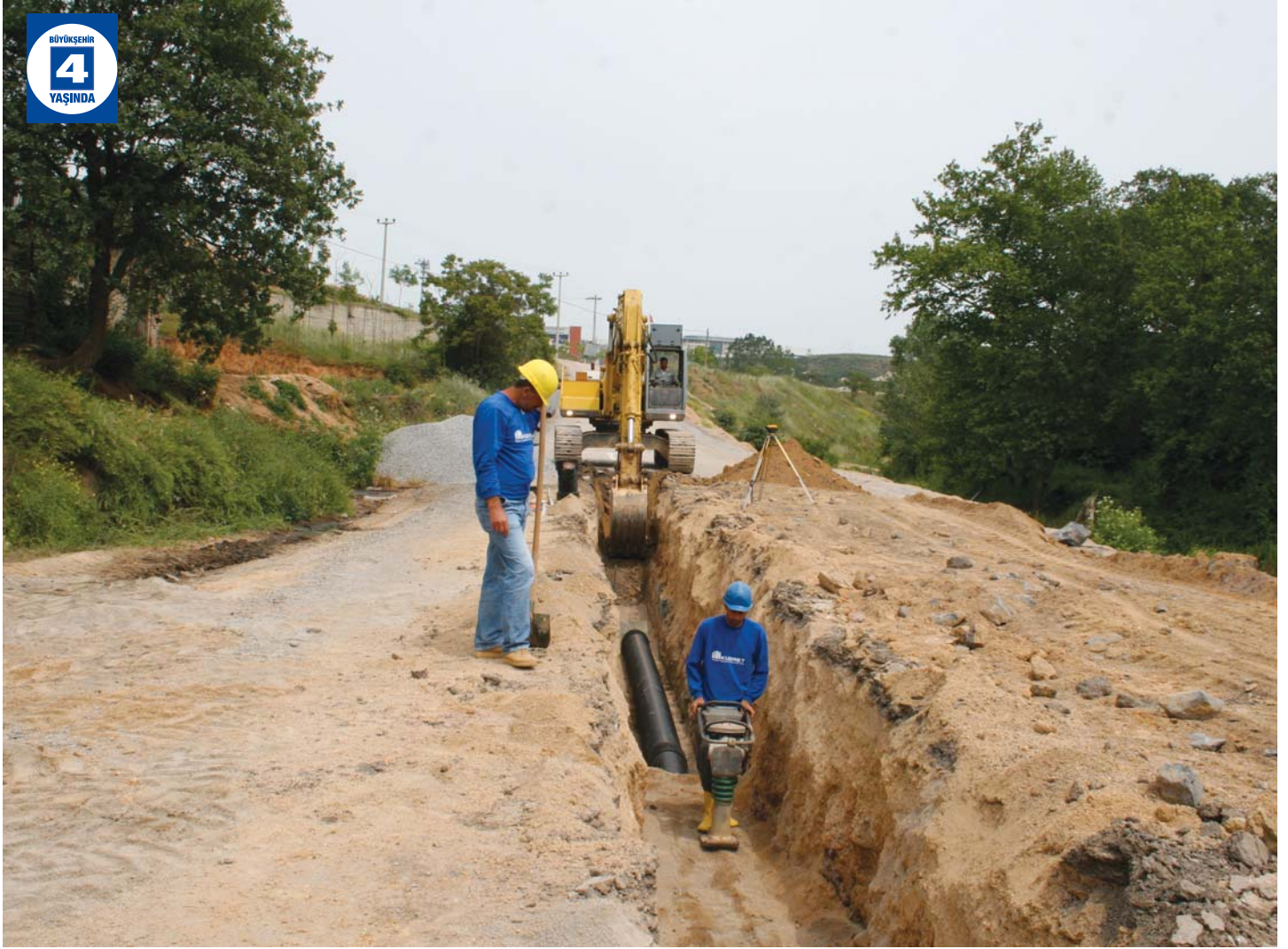
Şekerpınar Kanalizasyon Hattı