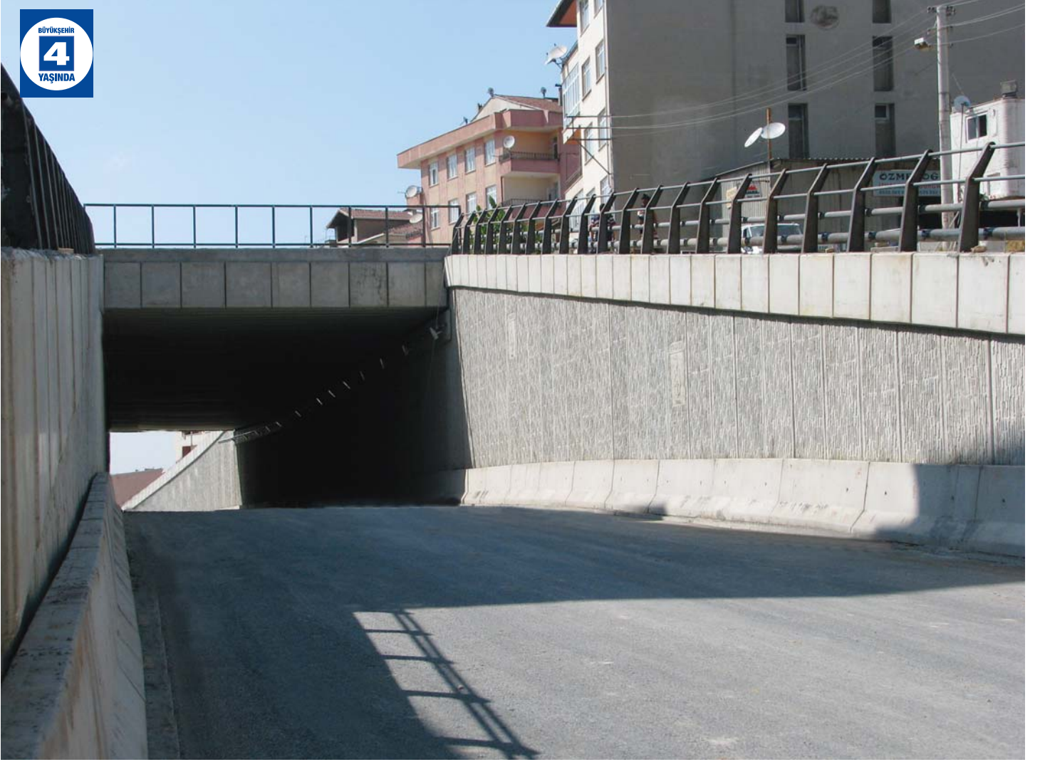
Fatih Caddesi Tünel Geçişi