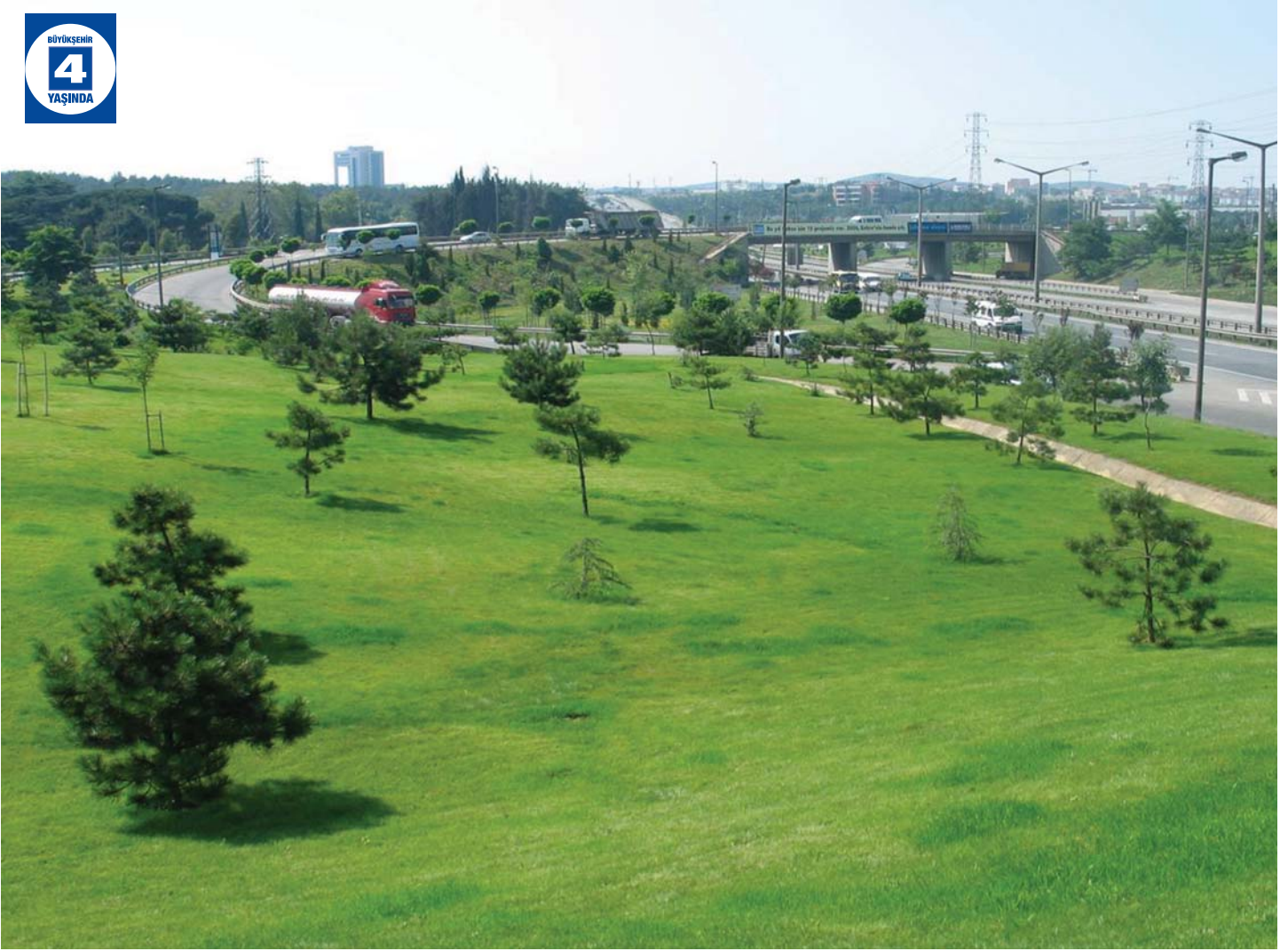
Çayırova Kavşağı Otomatik Sulama