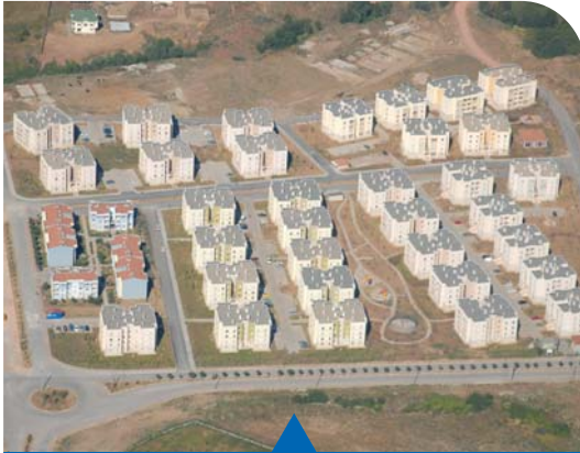
MESELA ARSLANBEY TAÇYAPRAK EVLERİ