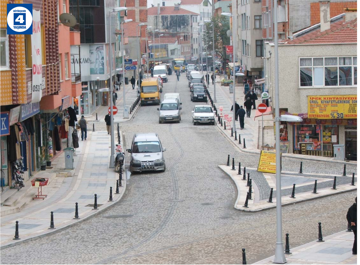
Fatih Caddesi Altyapı ve Üstyapı Düzenlemeleri