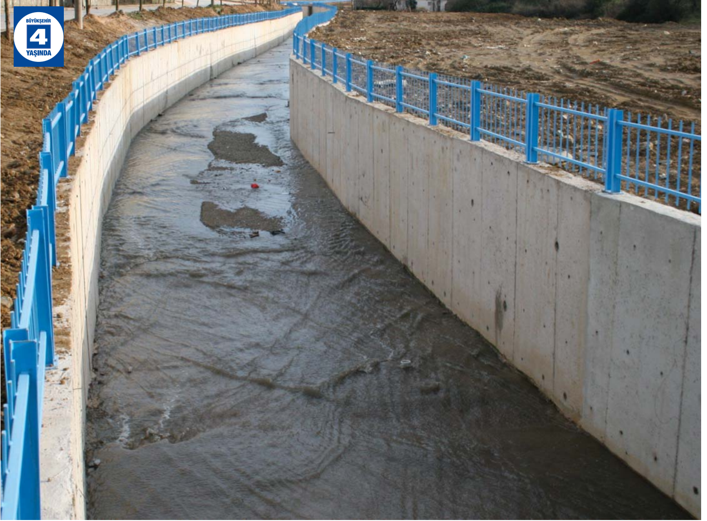
Çayırova Deresi Islahı