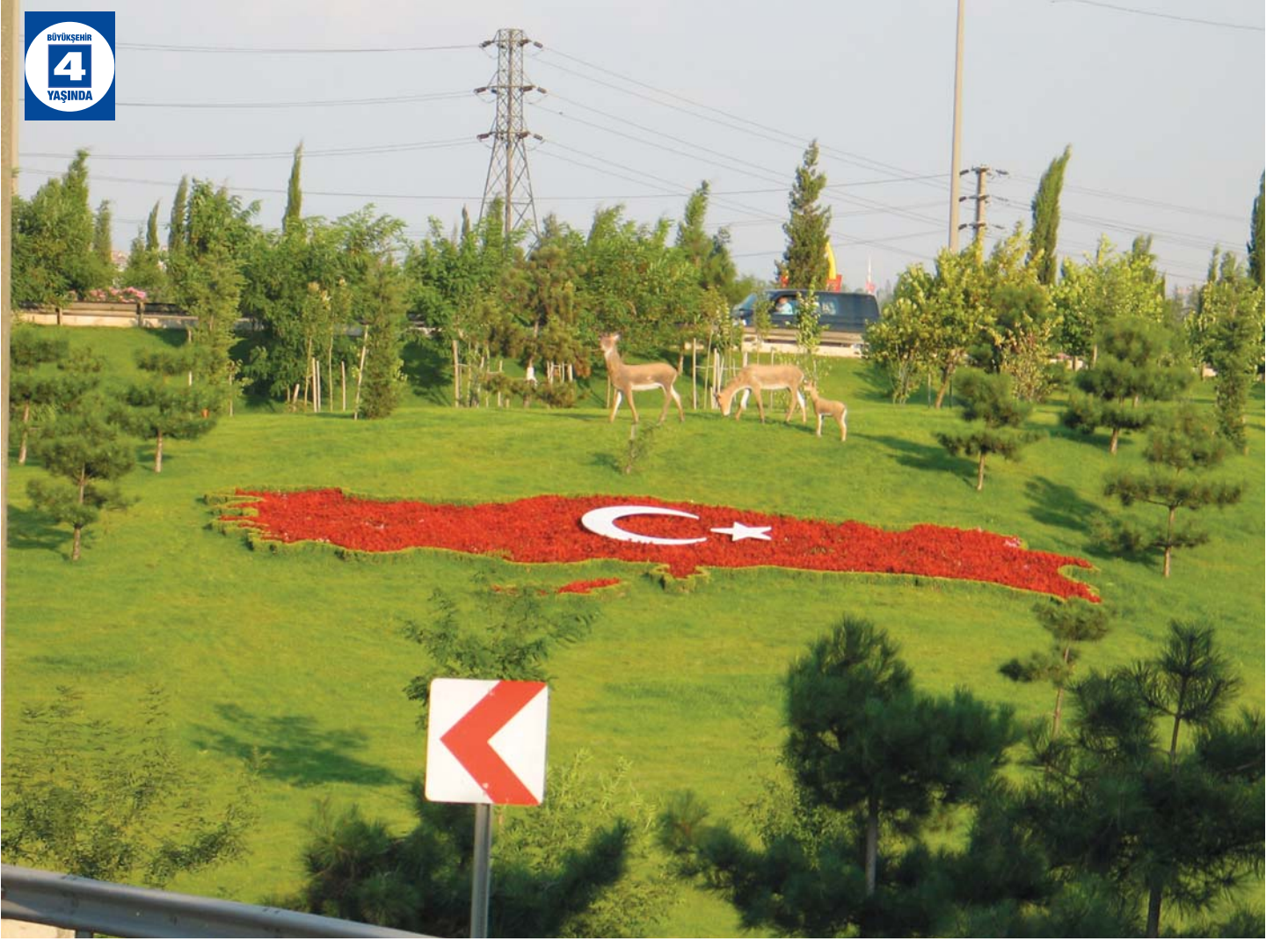
Çayırova Köprülü Kavşağı Çevre Düzenlemesi