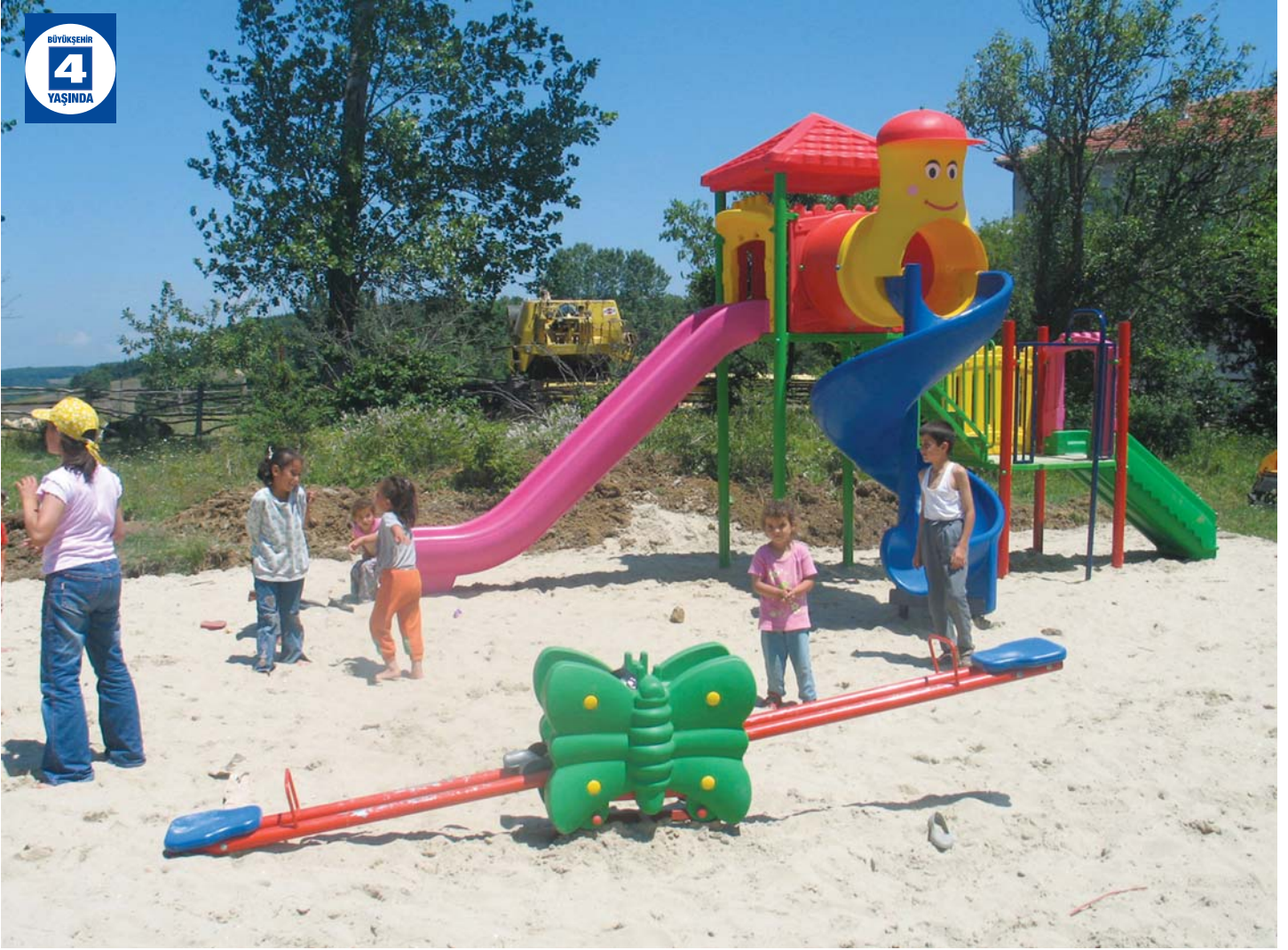
Köylere Çocuk Oyun Grupları