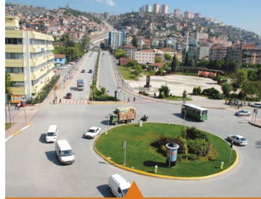
MESELA GAZANFER BİLGE BULVARI