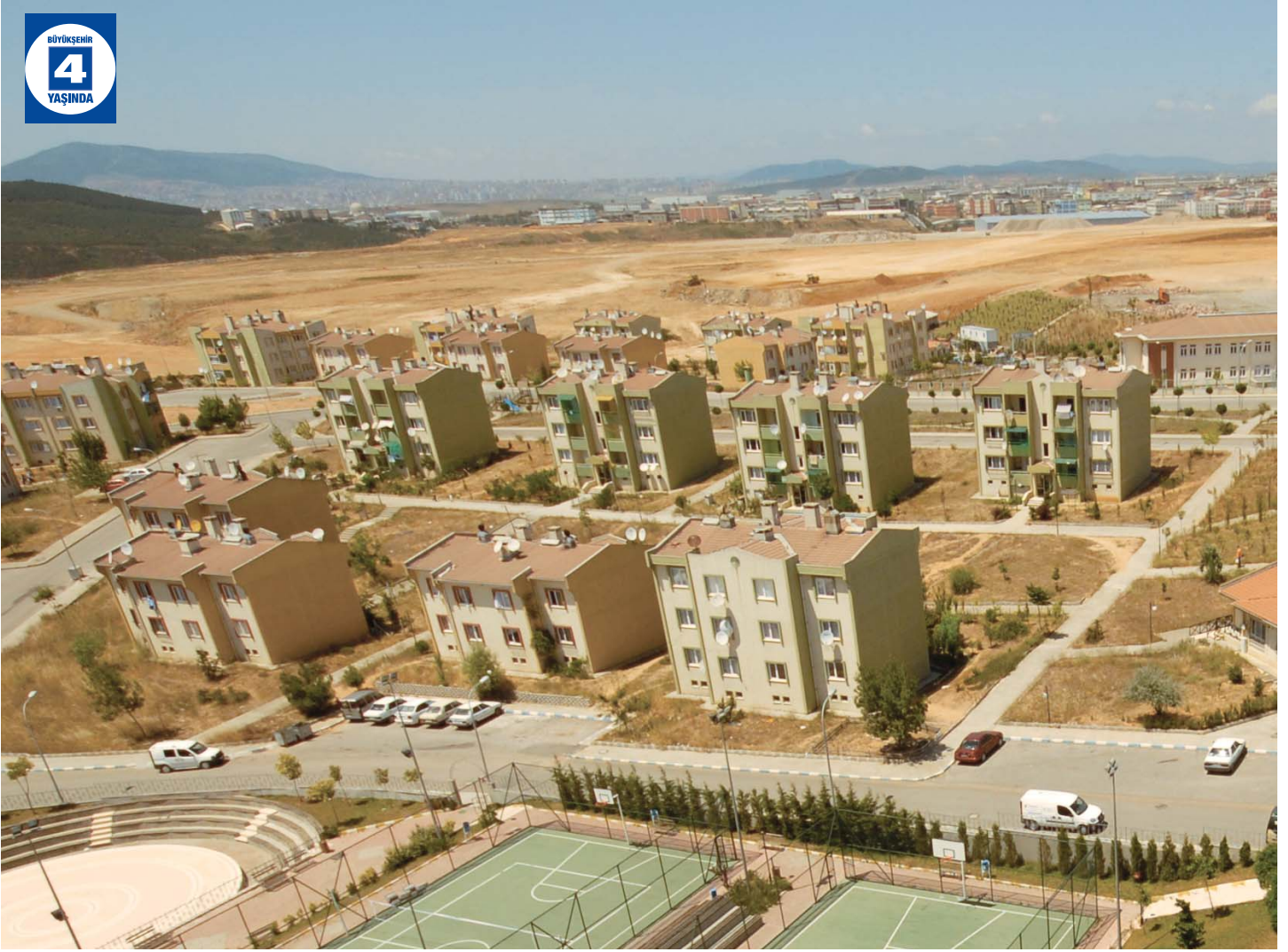
Şekerpınar Kalıcı Konutları Doğalgaz Çalışması