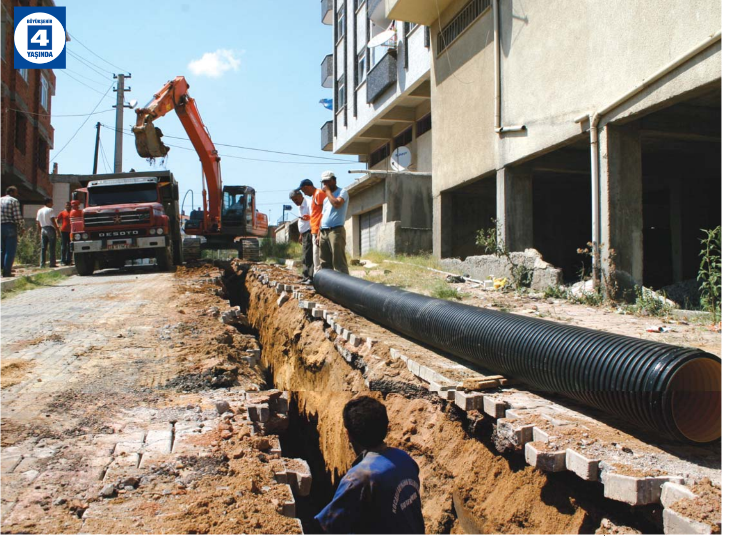
Çayırrova İçme Suyu ve Kanalizasyon Hattı