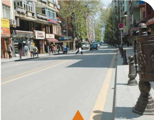
MESELA İNÖNÜ CADDESİ