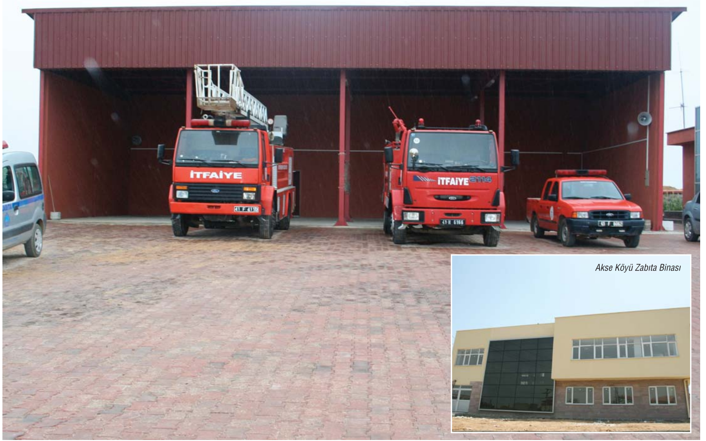
Akse Köyü Zabıta Binası