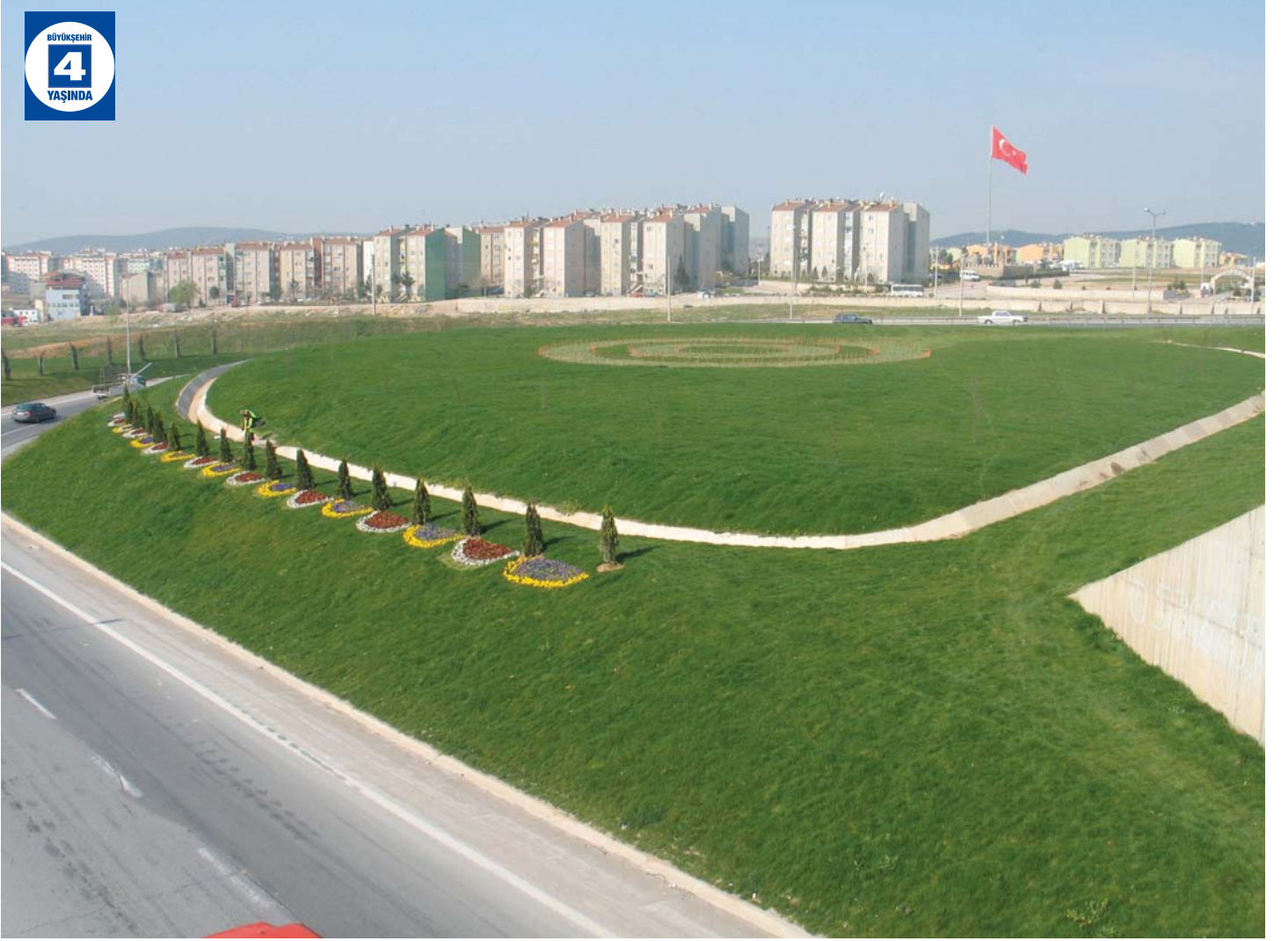
Şekerpınar Köprülü Kavşağı Çevre Düzenlemesi