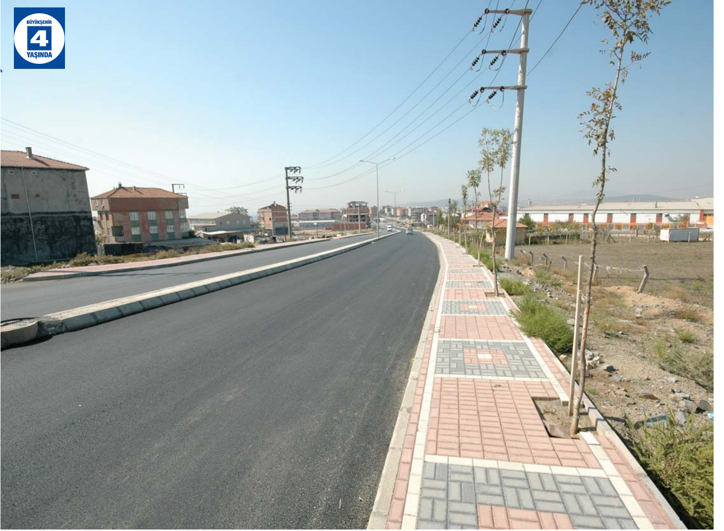
Diğer Üstyapı Düzenlemeleri