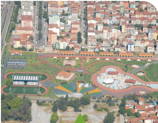
MESELA DOĞU KIŞLA GENÇLİK PARKI