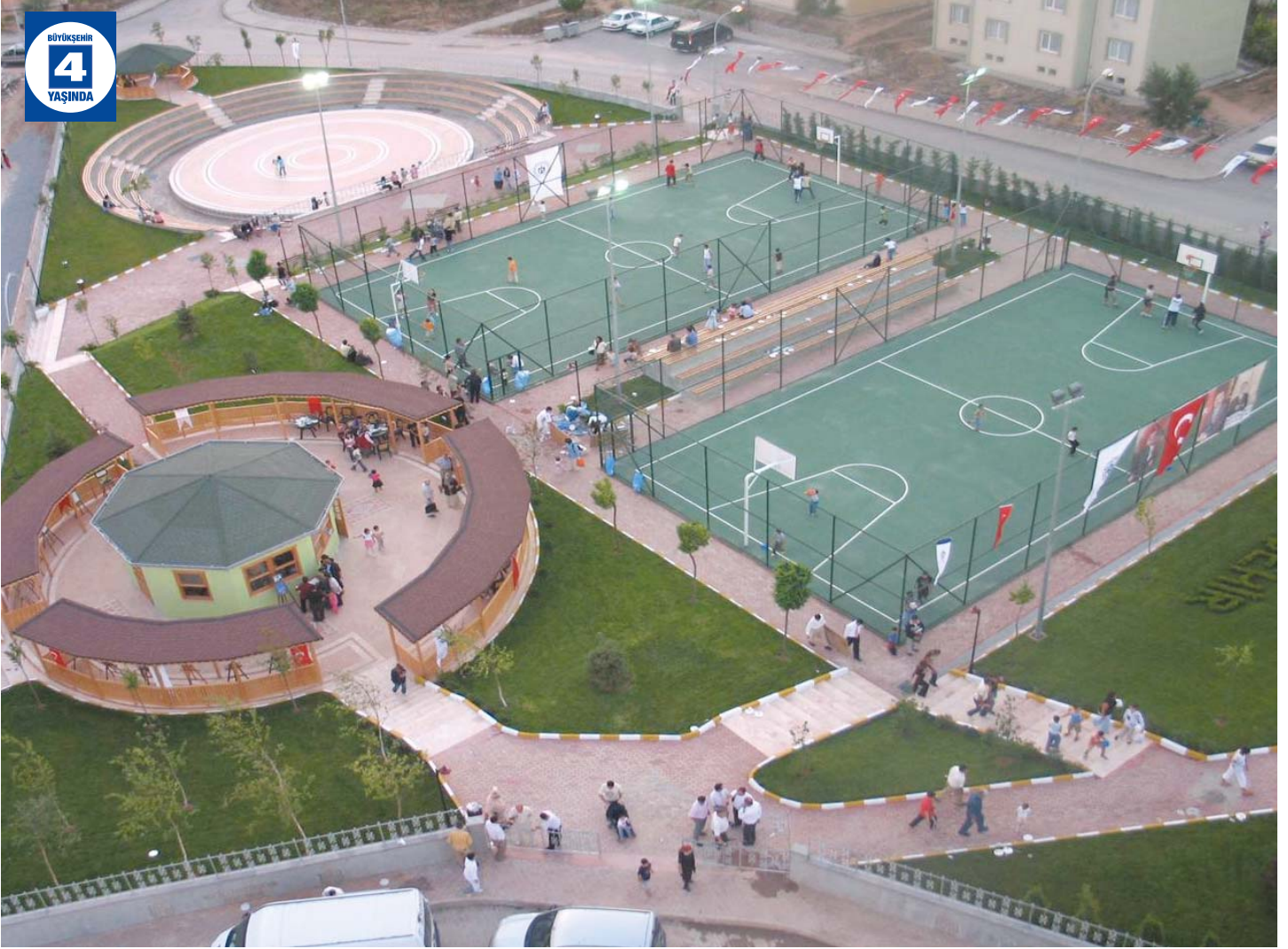
Şekerpınar Aliya İzzet Begoviç Parki