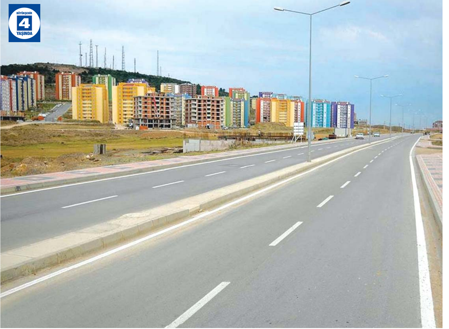
4. Cadde Altyapı ve Üstyapı Düzenlemesi