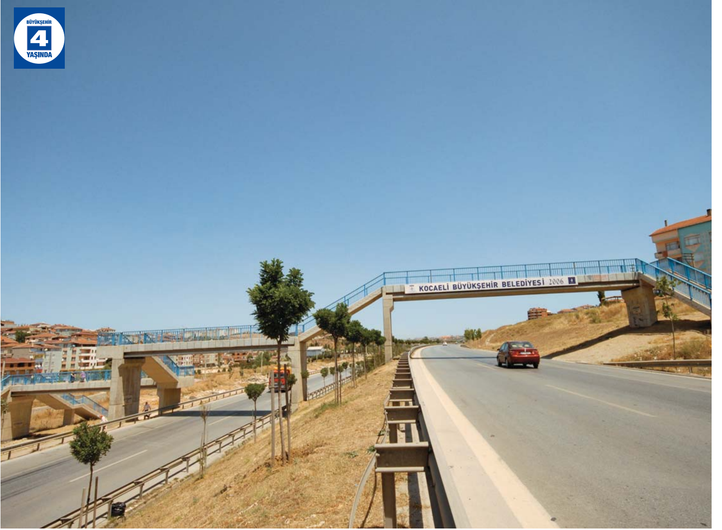
Yenimahalle Yaya Üst Geçidi