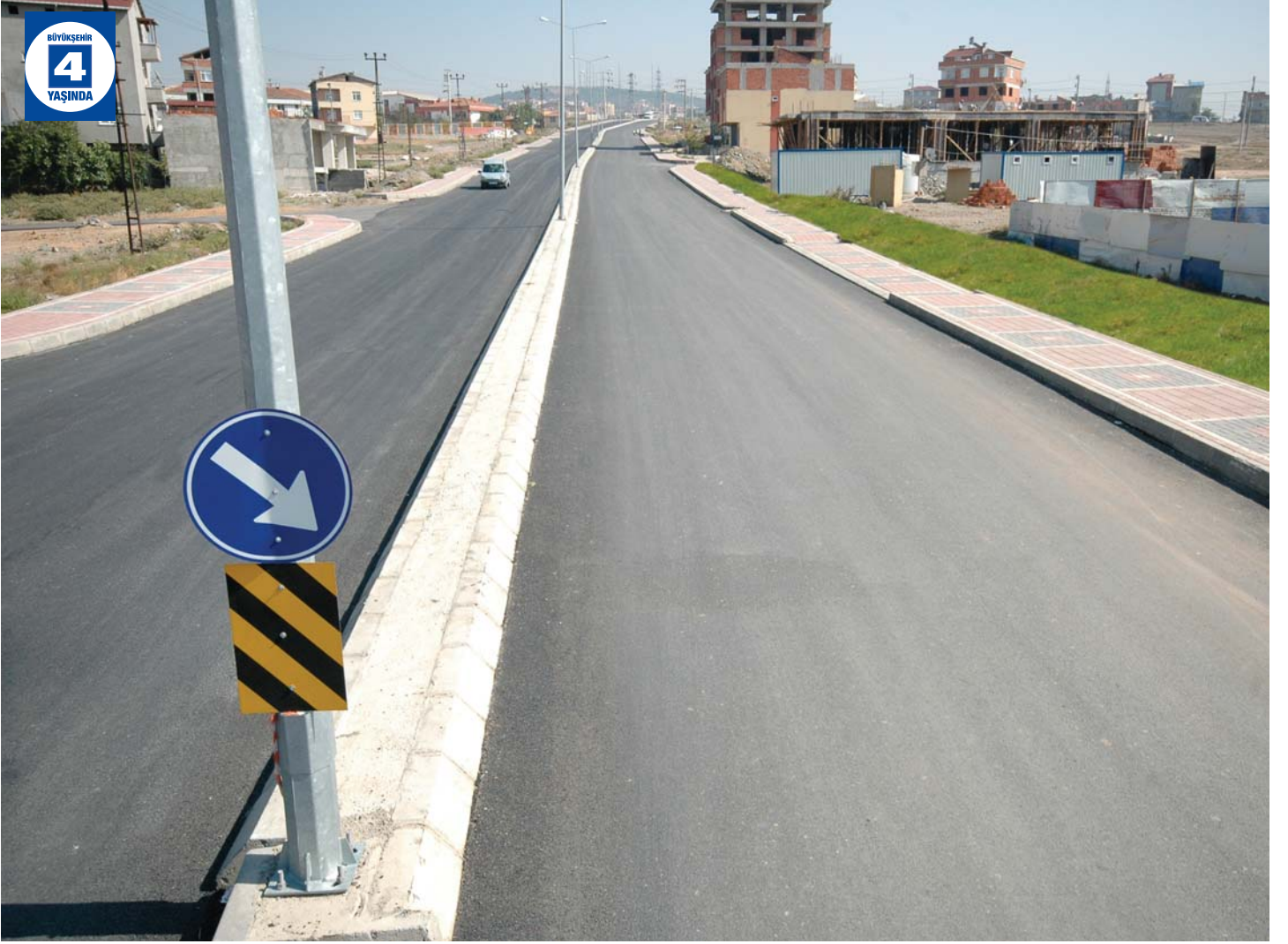
Ragıp Demirkol Bulvarı Alt ve Üst Yapı Düzenlemesi