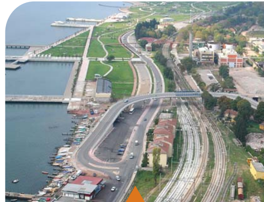
MESELA SEKA KÖPRÜLÜ KAVŞAĞI