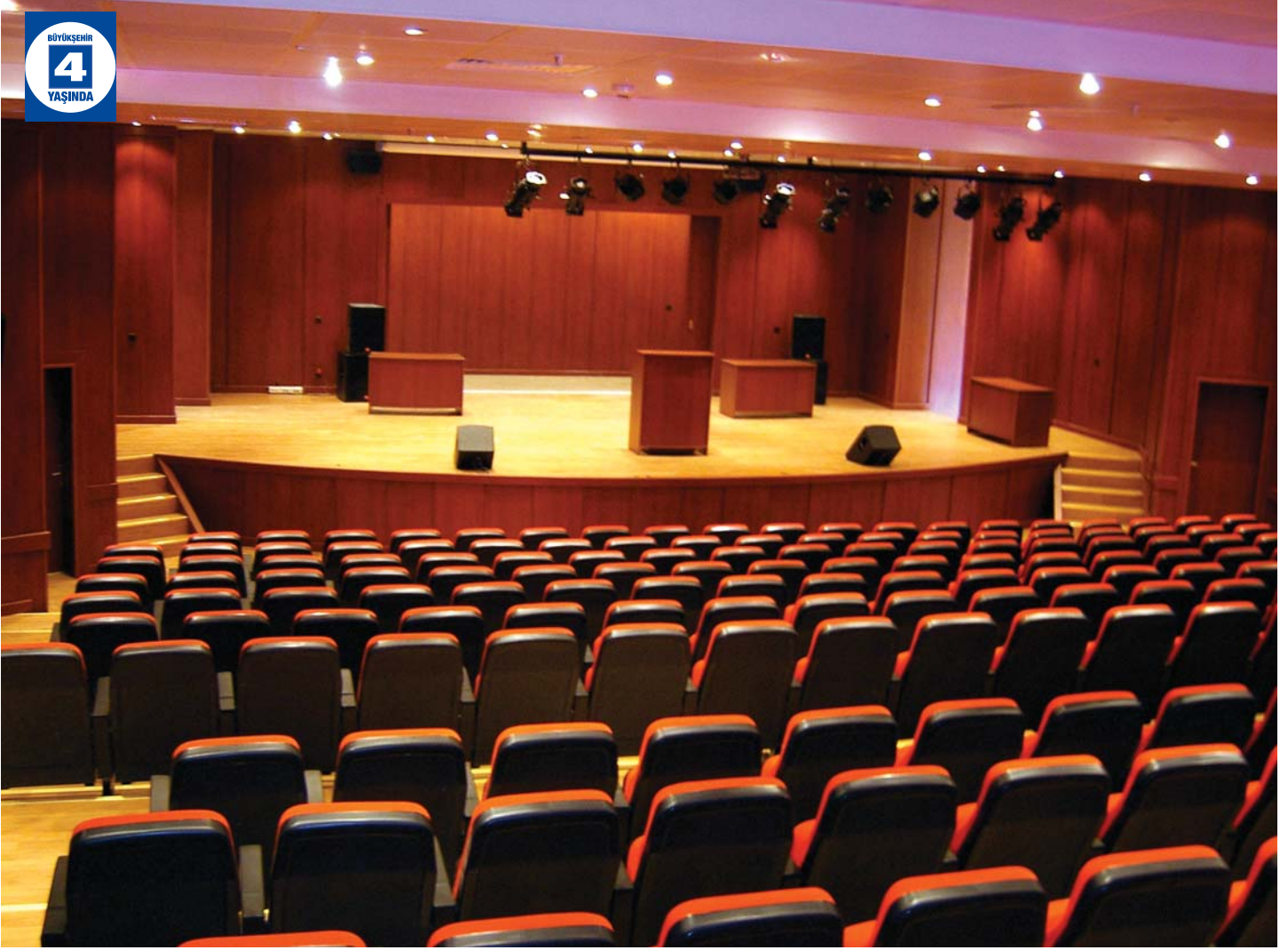
Çayırova Konferans Salonu