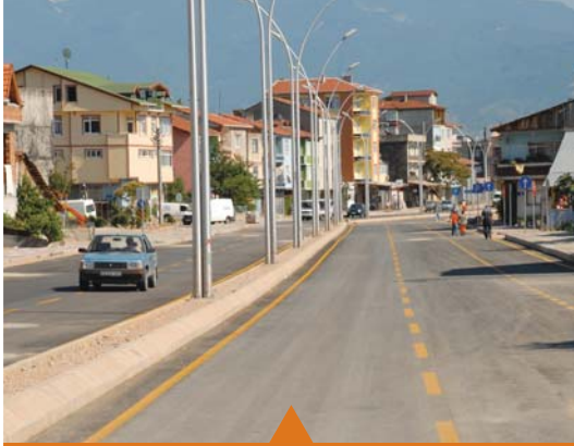
MESELA ADNAN MENDERES (KANALBOYU) BULVARI