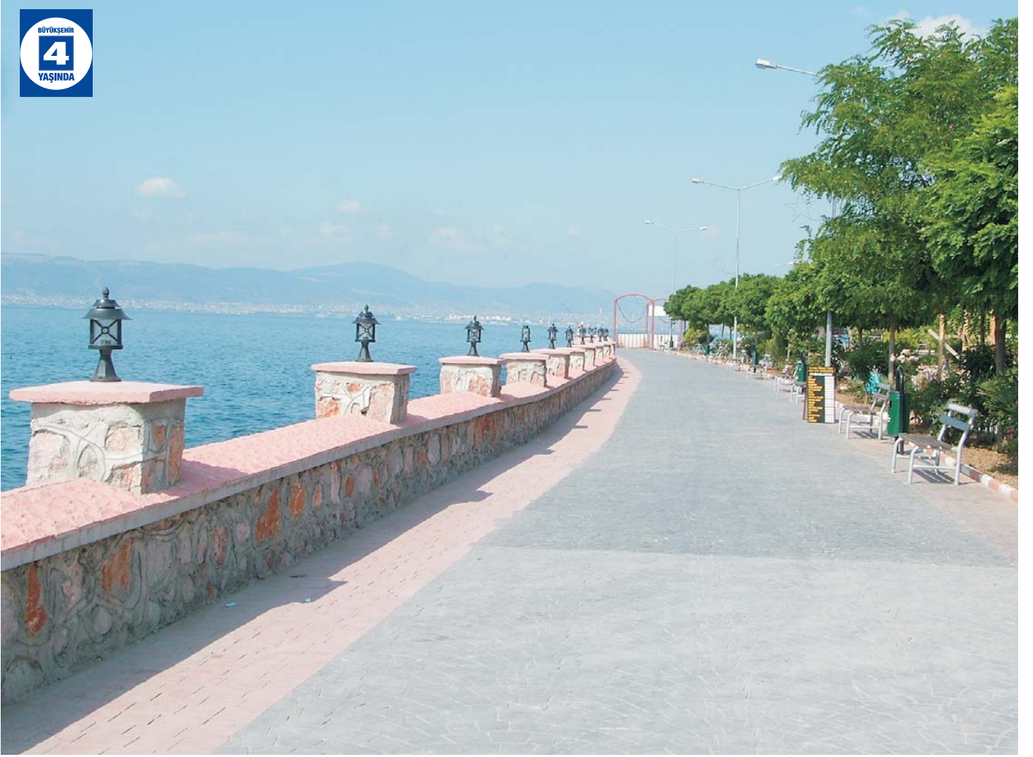
Ulaşlı Sahil Düzenlemesi