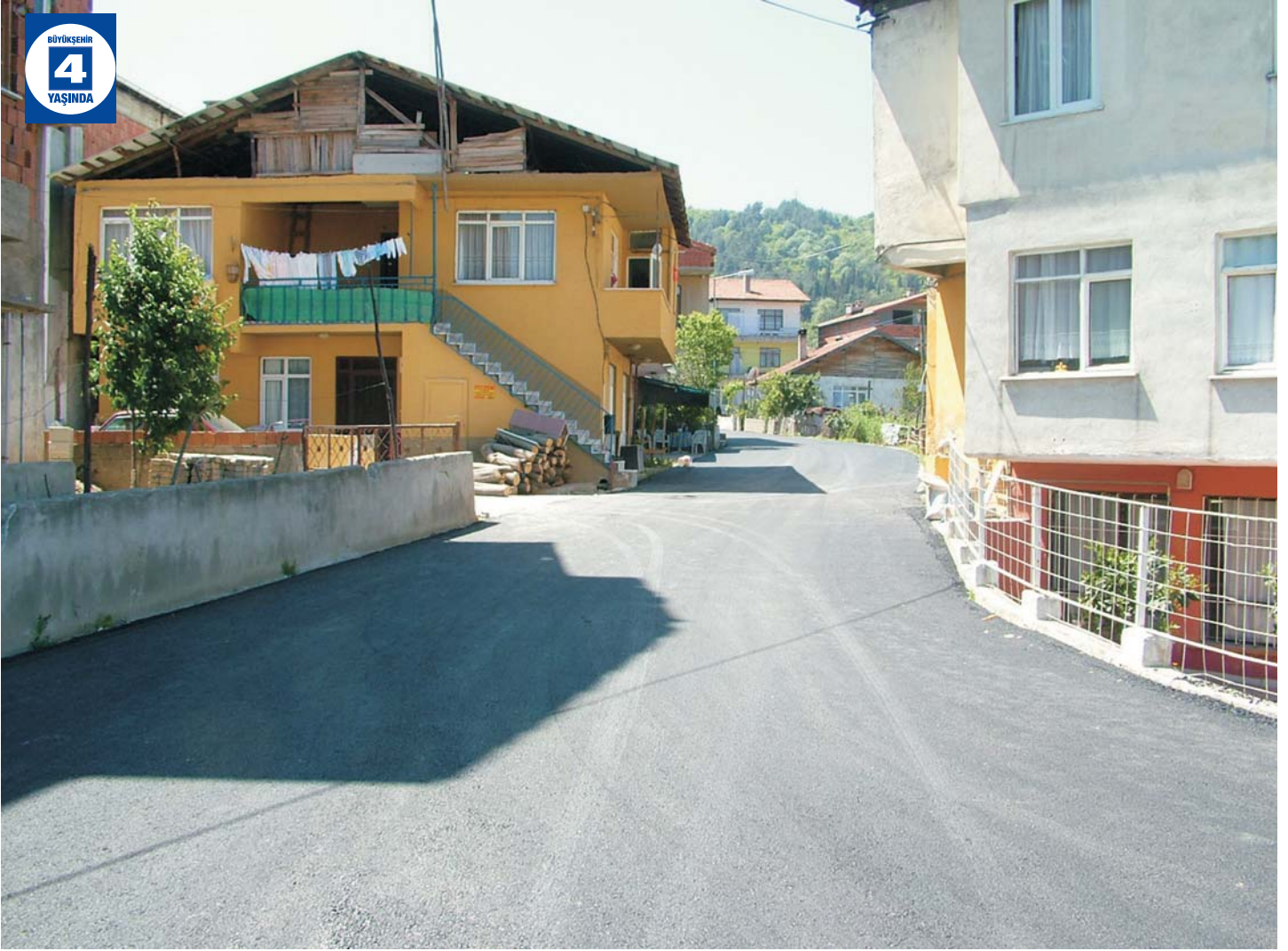
Ulaşı ve Halidere Üstyapı Çalışmaları