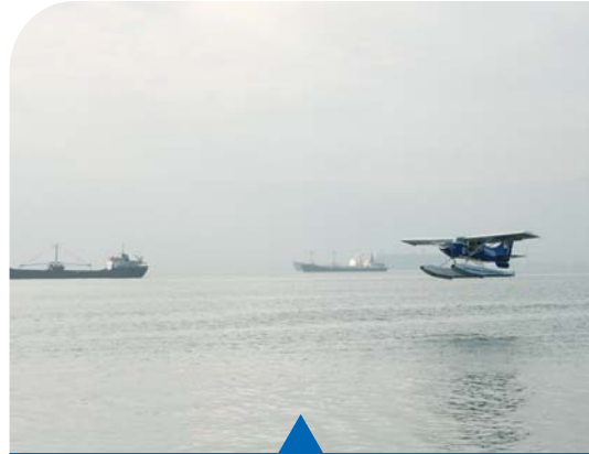
MESELA DENİZ DENETİMİ