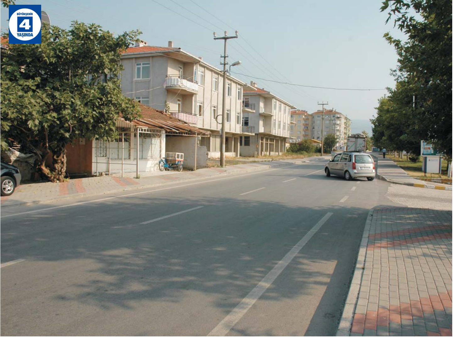
Ihsaniye'de Yenilenen Caddeler