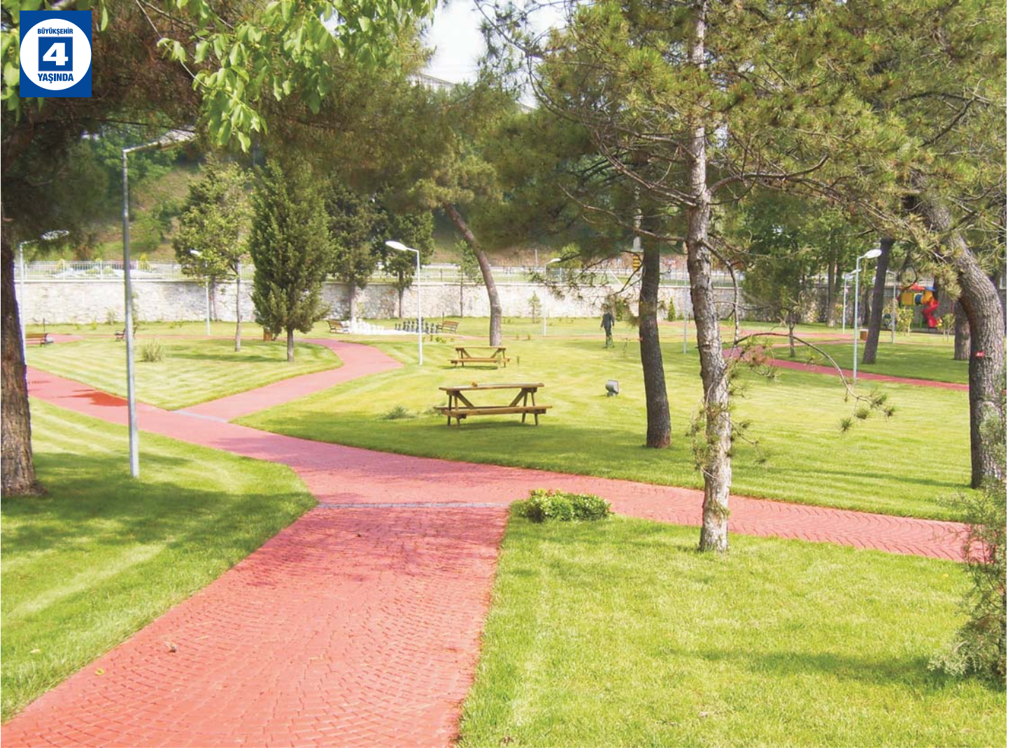
Donanma - Garnizon Peyzaj Düzenlemesi