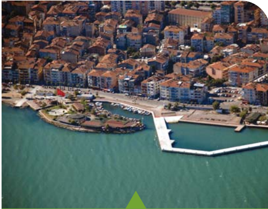
MESELA KARAMÜRSEL YELKEN İSKELESİ