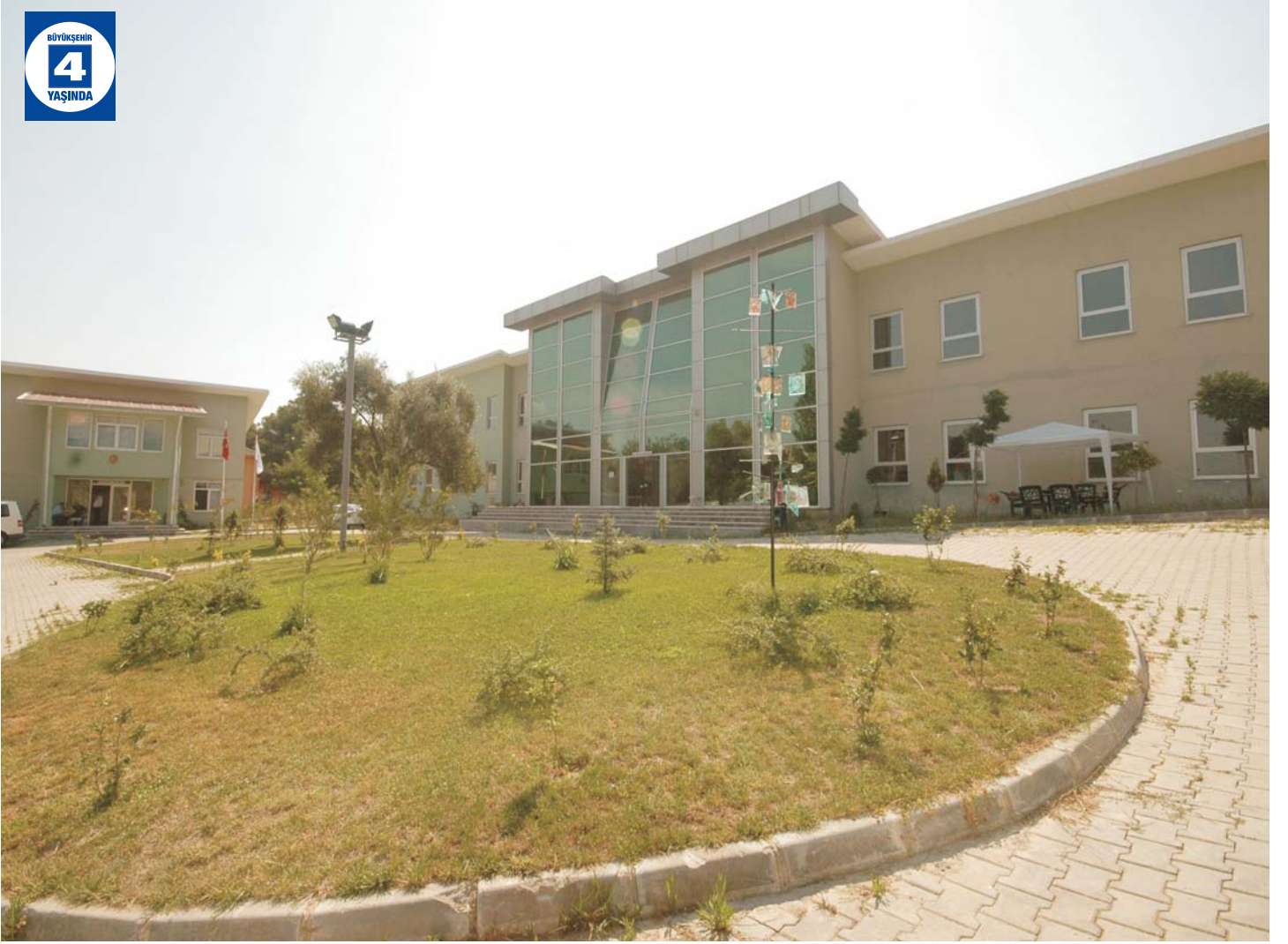
Değirmendere Ali Özbay Güzelsanatlar MYO Binası