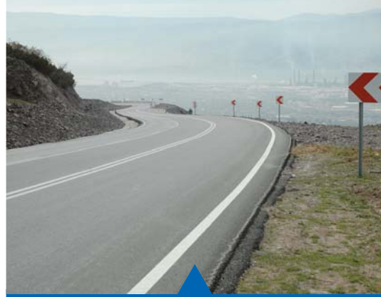
MESELA KÖRFEZ HAYAT YOLU