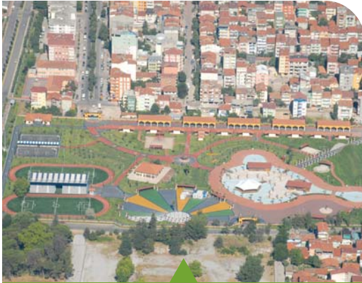
MESELA DOĞU KIŞLA GENÇLİK PARKI