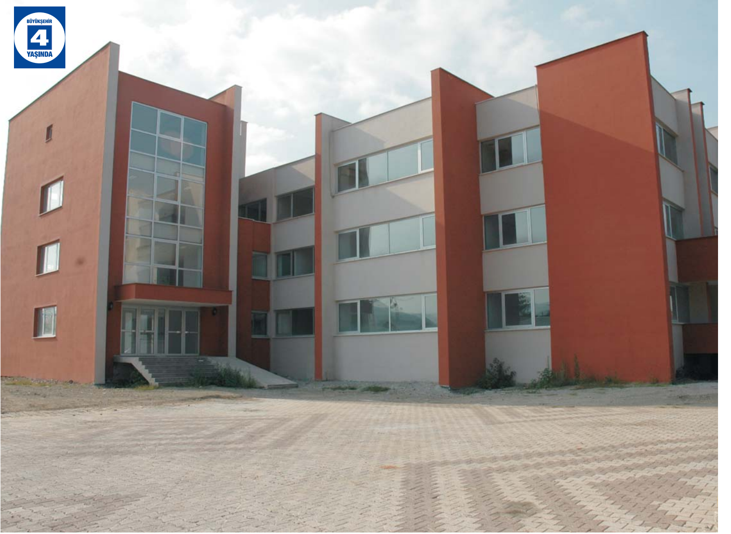
İhsaniye Belediyesi Hizmet Binası