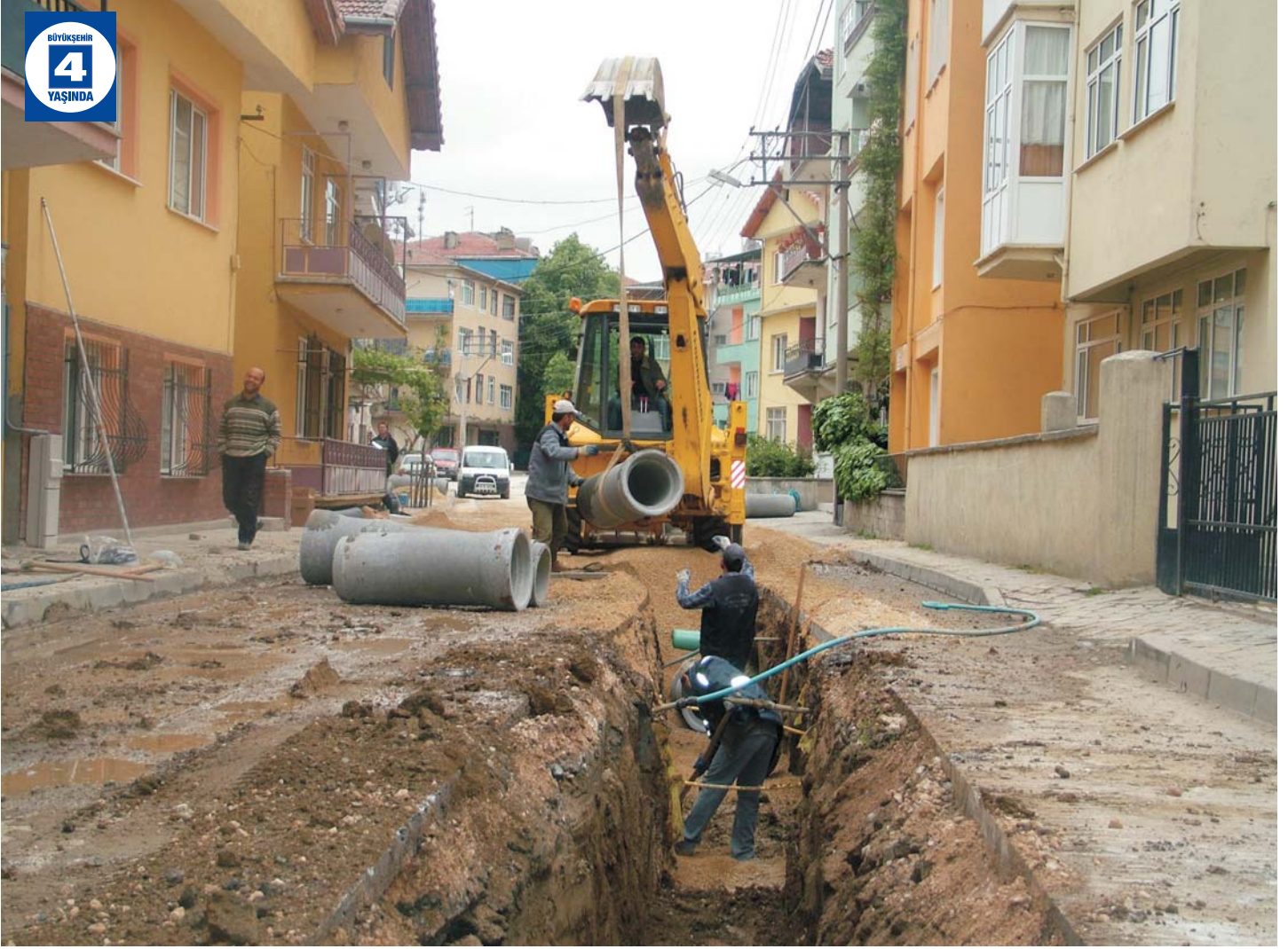
Gölcük Caddeleri Yağmur Suyu Hattı