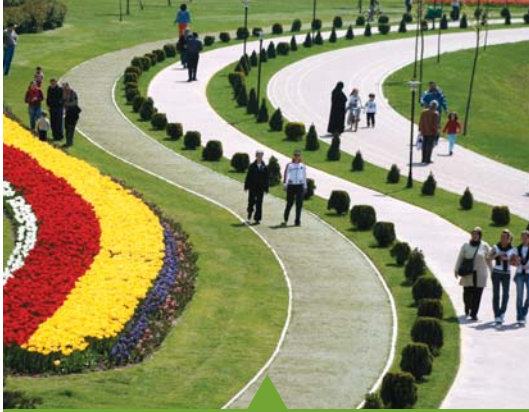
MESELA YÜRÜYÜŞ YOLLARI