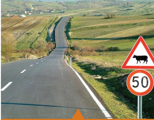
MESELA KÖYLERE HİZMET