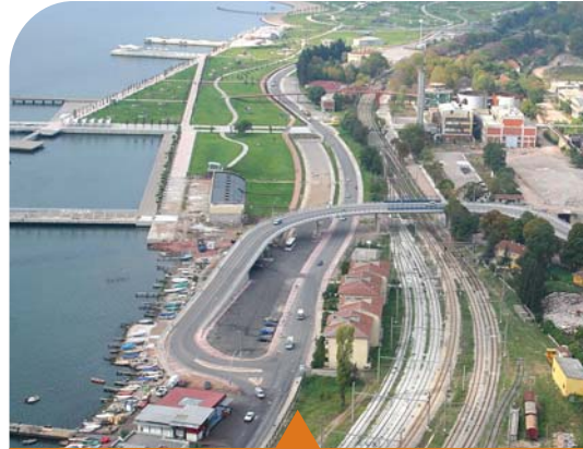
MESELA SEKA KÖPRÜLÜ KAVŞAĞI