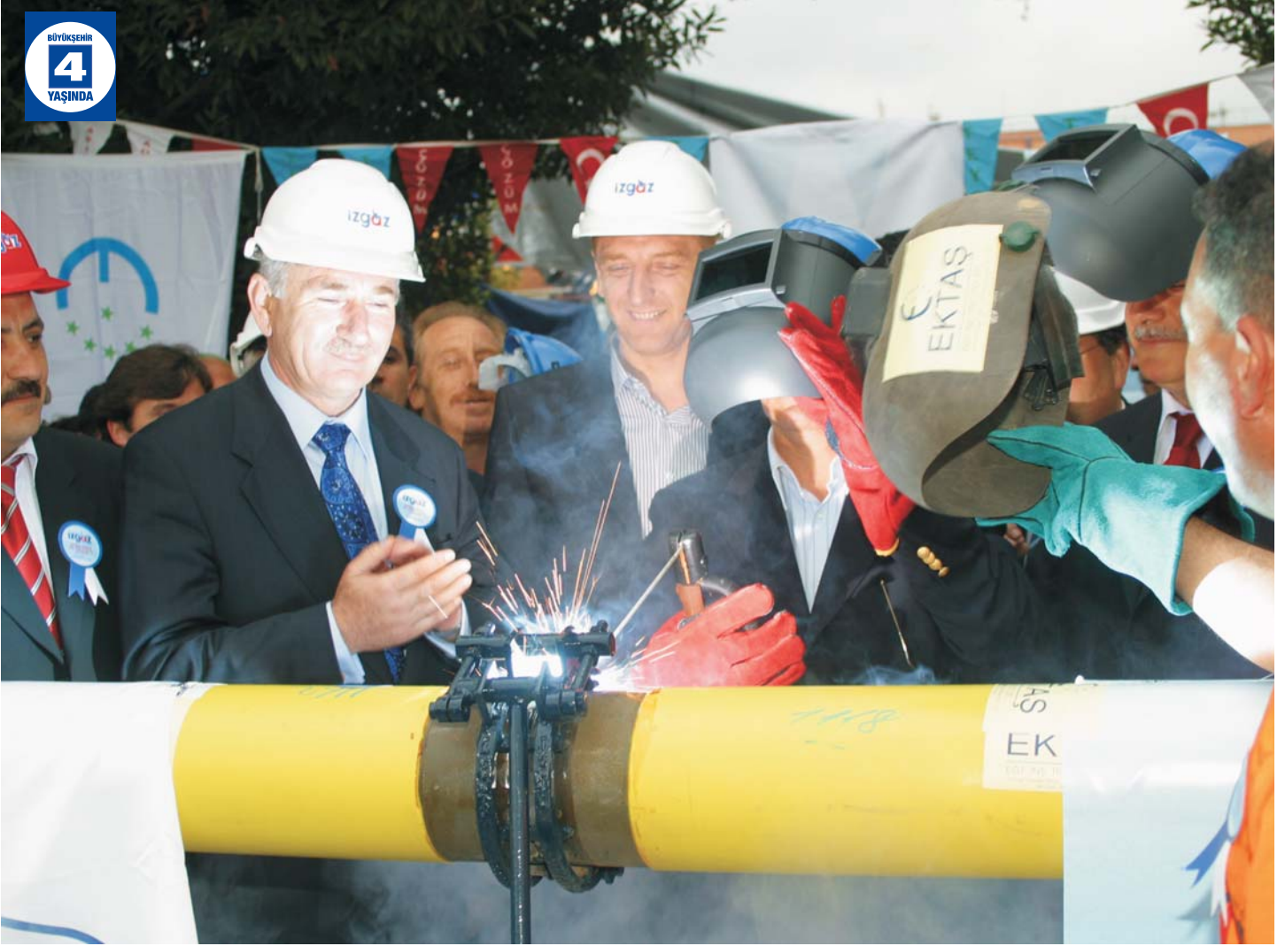
Gölcük Doğalgaz Çalışmaları