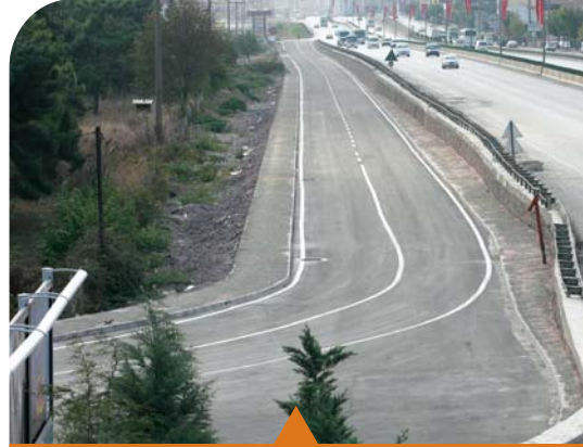
MESELA DERİNCE RO-RO YOLU