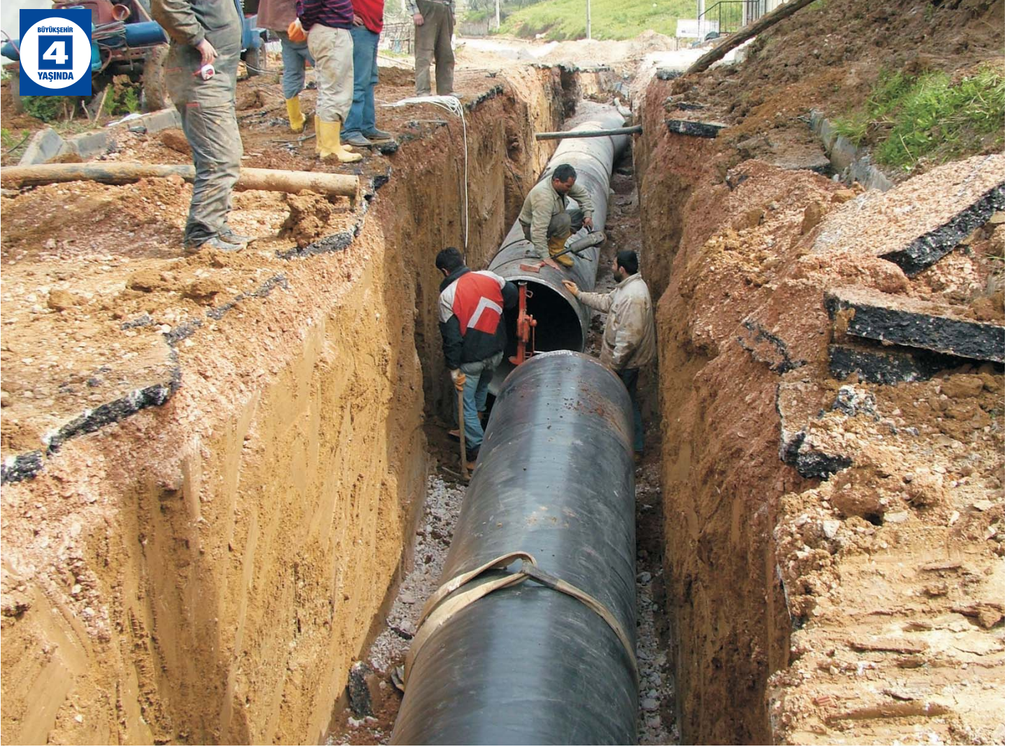
Gölcük - Karamürsel İçme Suyu Hattı