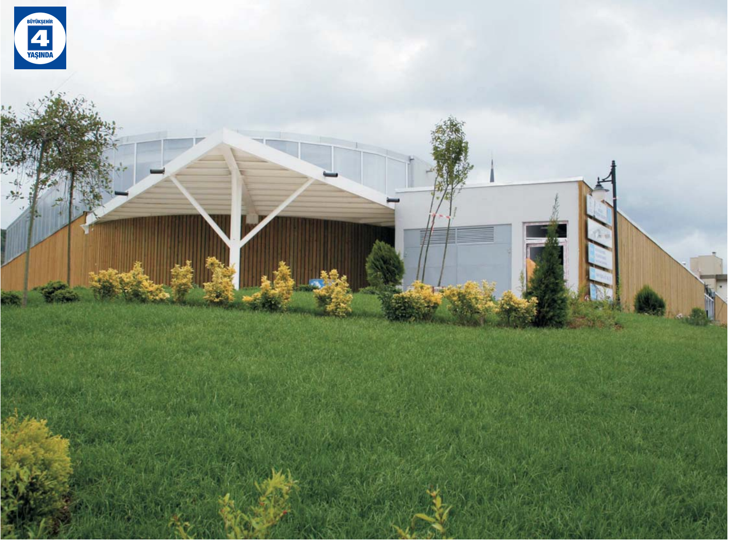
Şirinköy Kalıcı Konutlar Kültür Merkezi