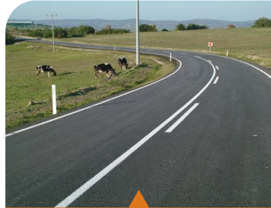
MESELA DELİVELİ-AKÇAOVA YOLU