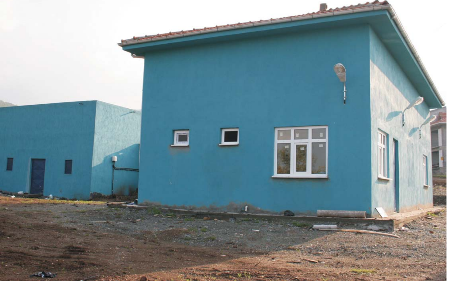
Hisareyn ve Yazlık İçme Suyu Şebekesi