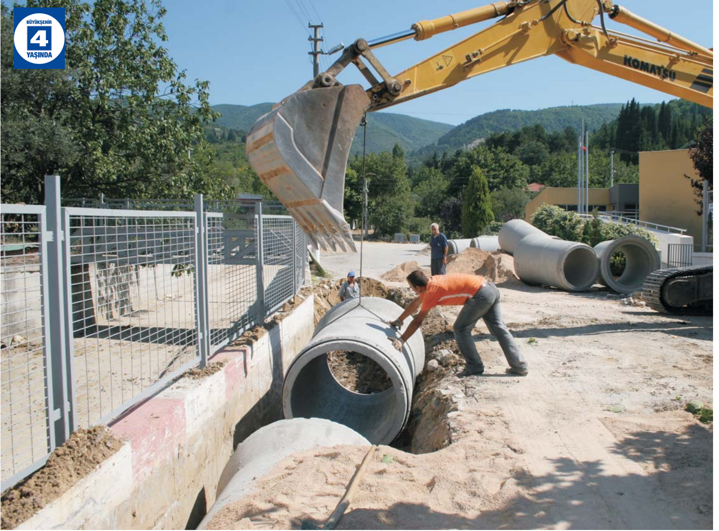
Ulaşlı Yağmur Suyu Şebekesi