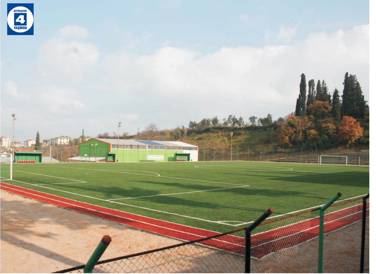
Değirmendere Futbol Sahası ve Spor Salonu