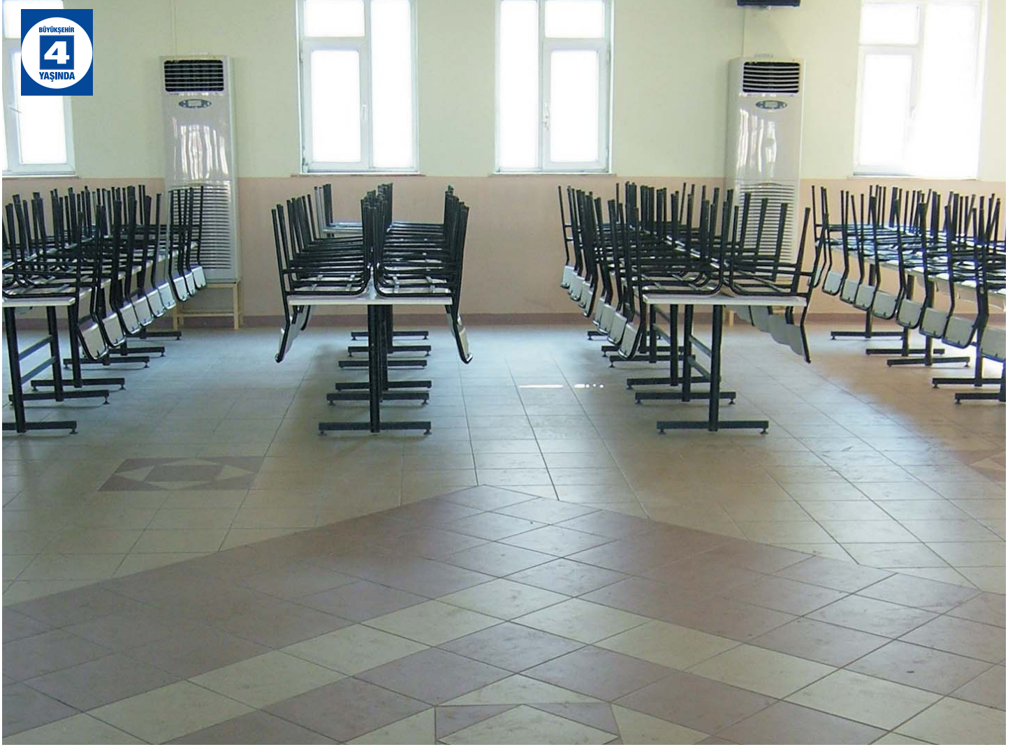
Halidere Düğün Salonu Tadilatı