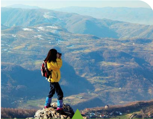
MESELA TREKKING PARKURLARI