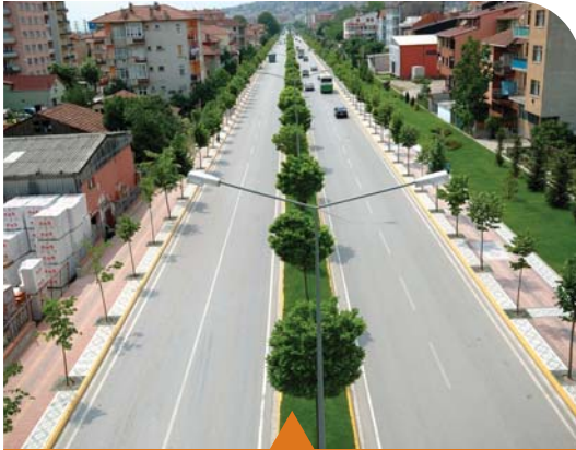
MESELA ŞEHİT RAFET KARACAN BULVARI