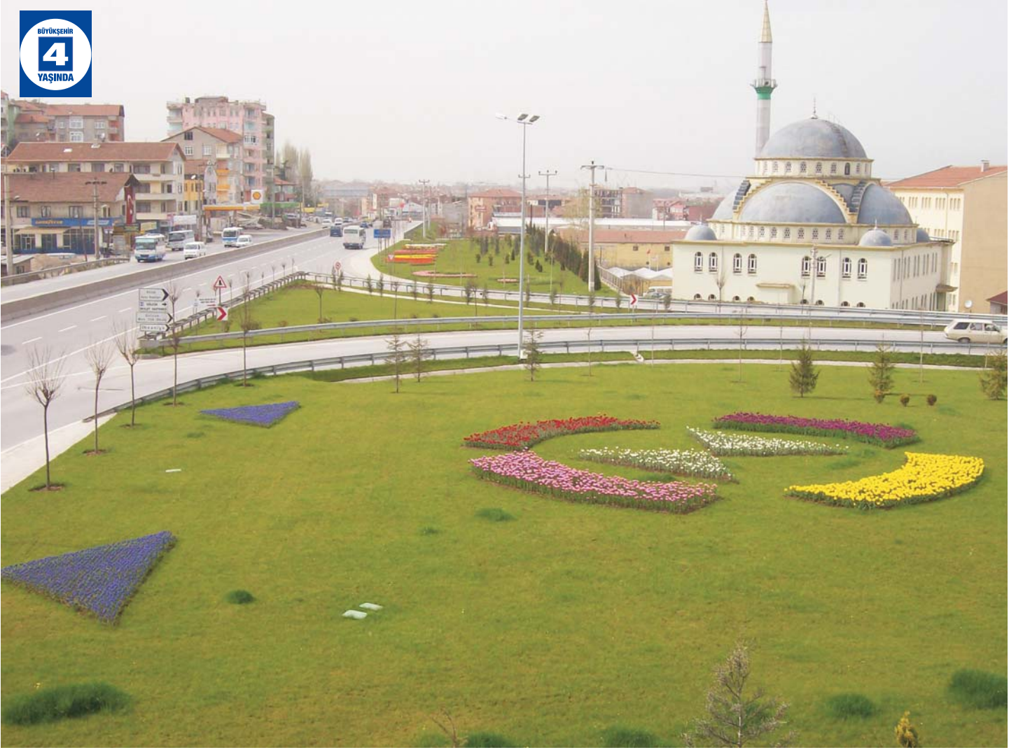
İhsaniye Köprülü Kavşağı Çevre Düzenlemesi