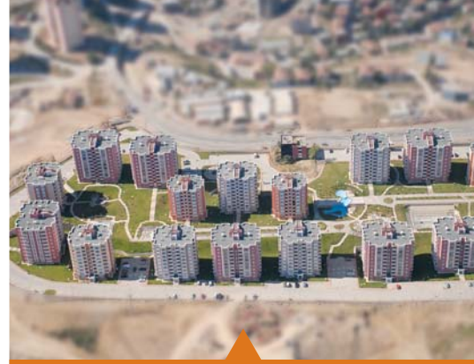
MESELA KENTSEL DÖNÜŞÜM