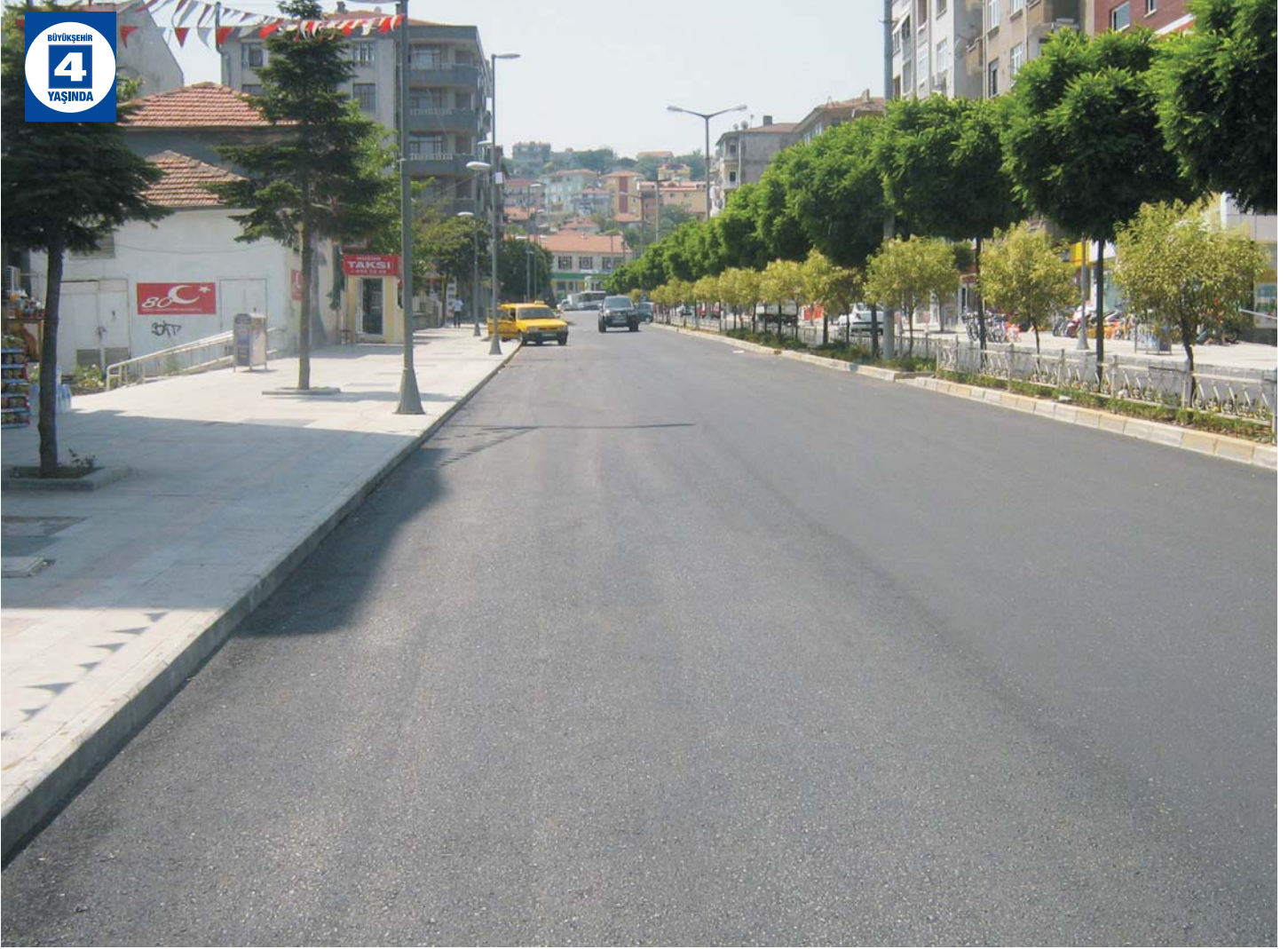
Gölcük'te Yenilenen Caddeler