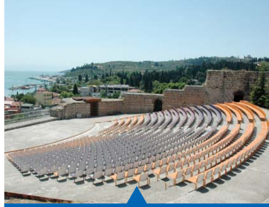
MESELA ESKİHİSAR KALESİ