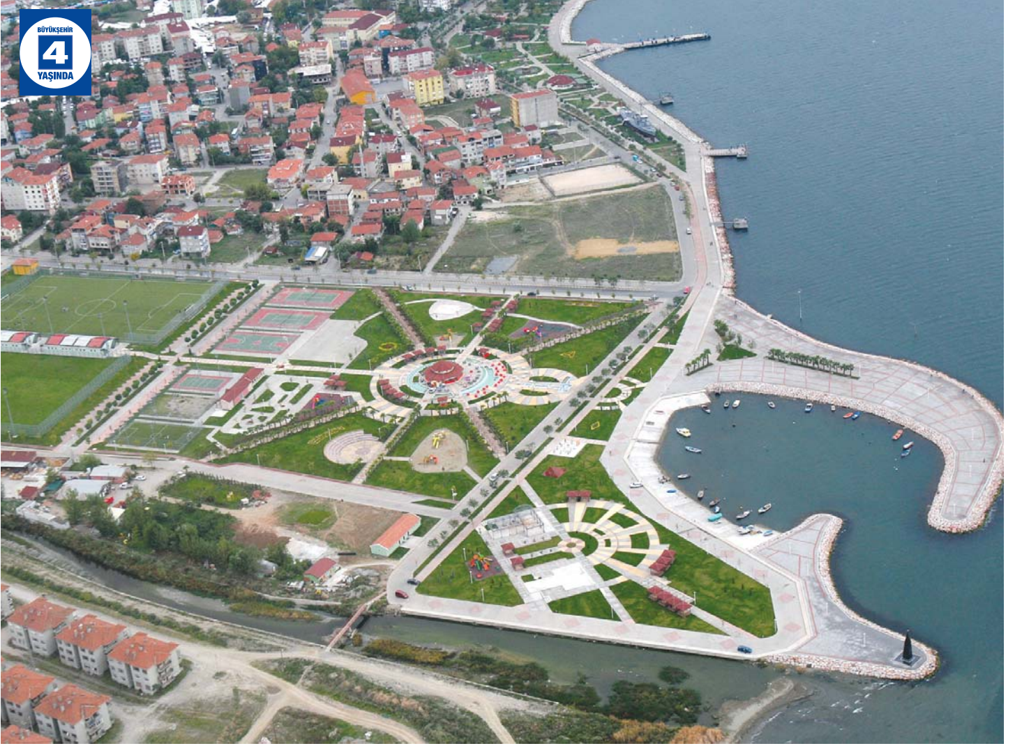
Barbaros Hayrettin Paşa Parkı