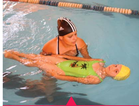
MESELA YAZ SPOR OKULLARI