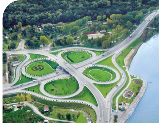
MESELA KAVŞAK DÜZENLEMELERİ