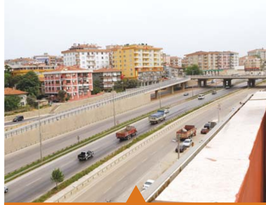
MESELA GEBZE TATLIKUYU KAVŞAĞI