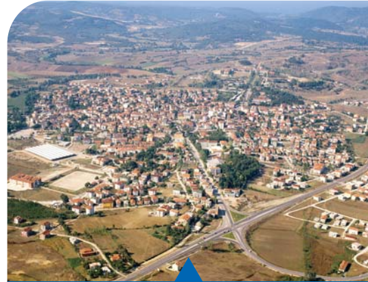
MESELA KANDIRA ve EREĞLİ'YE DOĞALGAZ