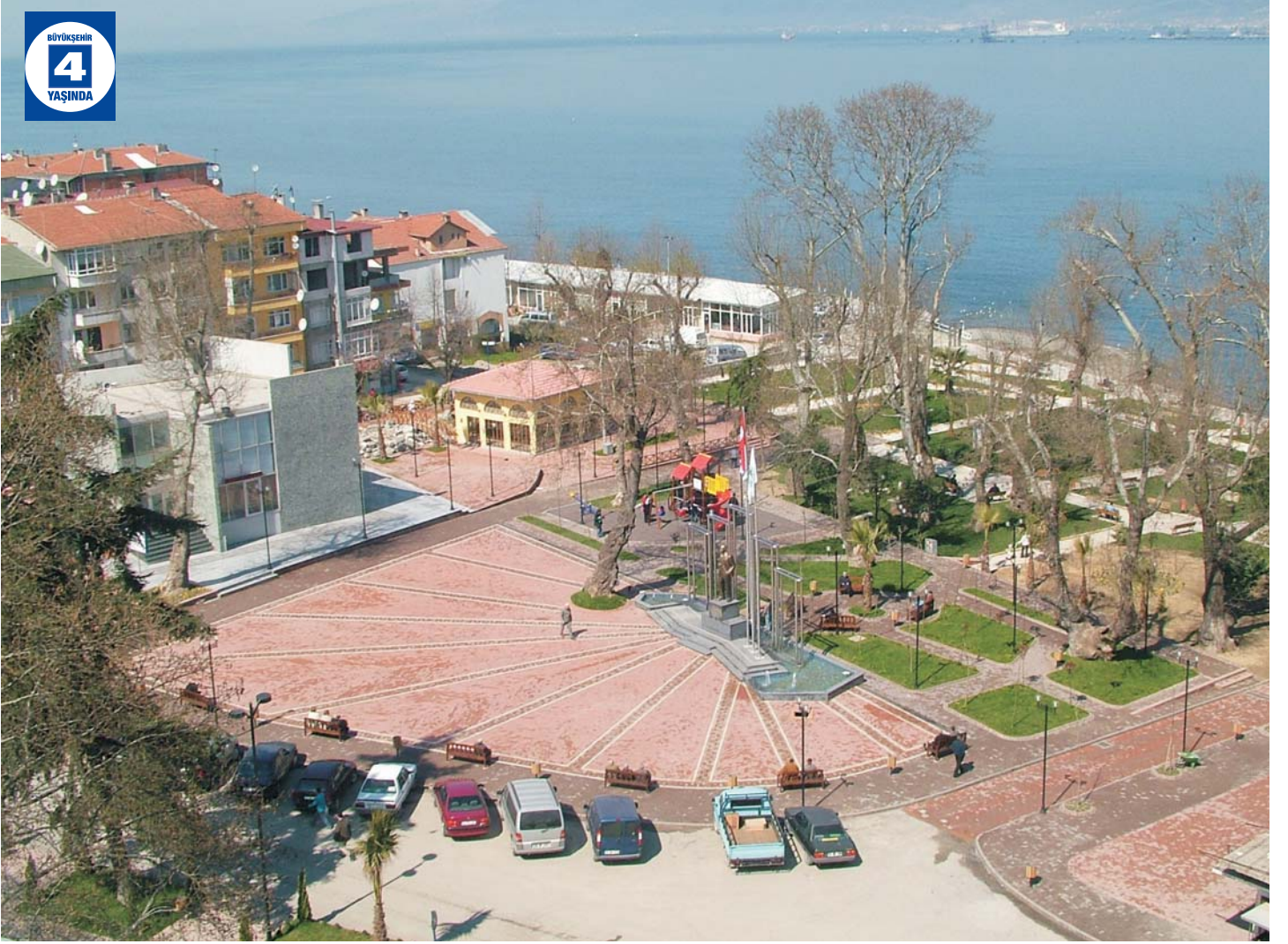
Değirmendere Çınarlık Meydanı Düzenlemesi