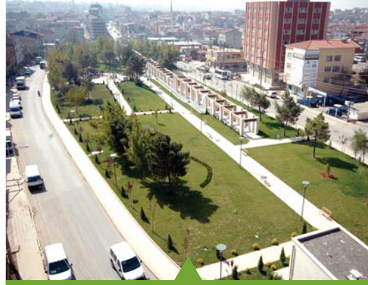
MESELA GEBZE EŞREF BİTLİS PARKI