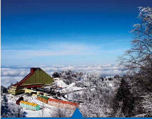
MESELA KARTEPE'YE DOĐALGAZ