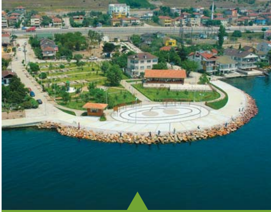
MESELA KIRAZLIYALI SAHİL PARKI