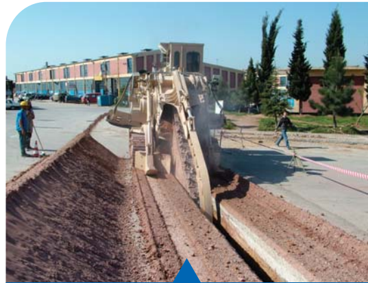
MESELA İÇME SUYU YATIRIMI