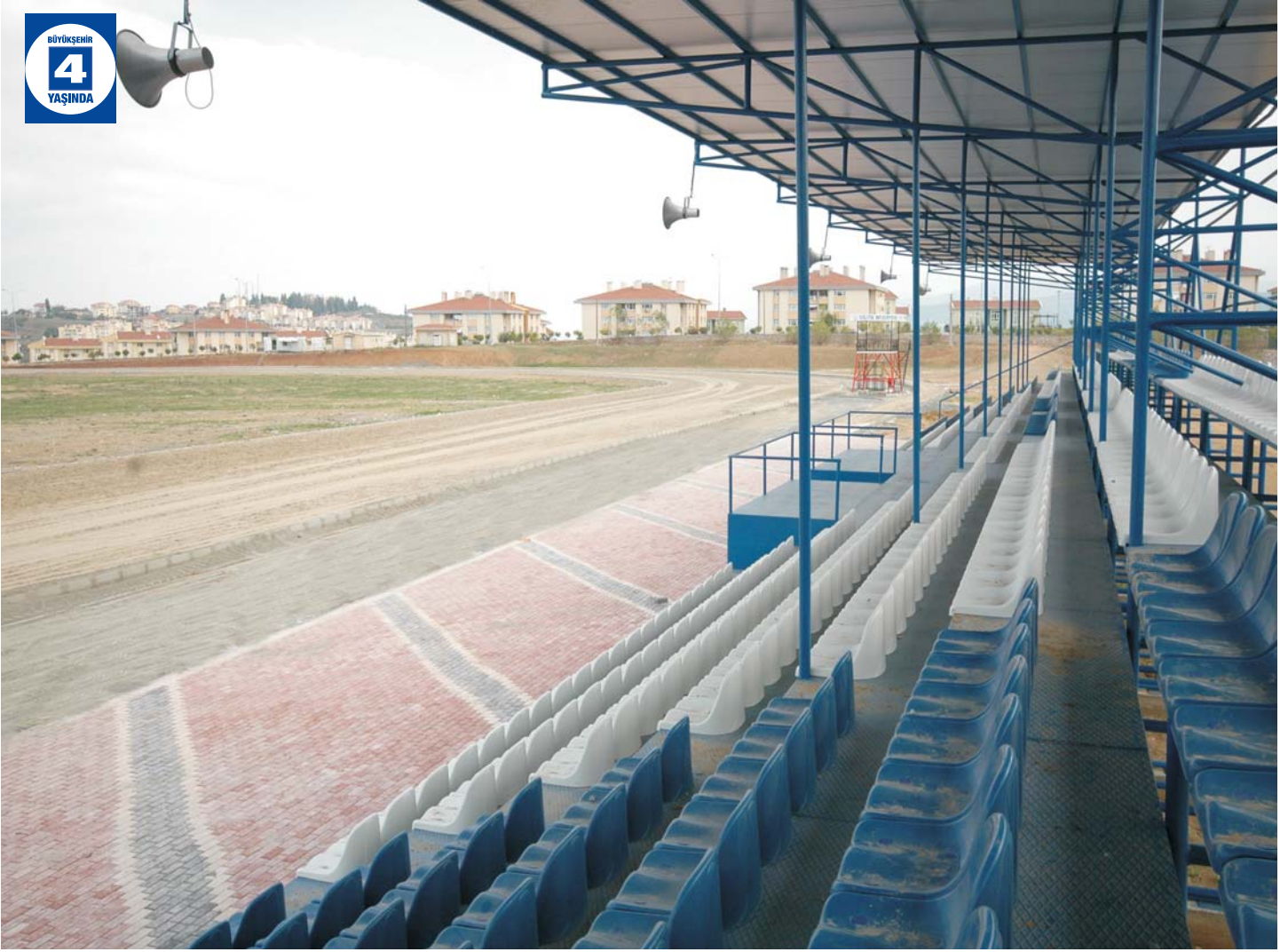
Gölçük Rahvan At Koşu Alanı ve Peyzaj