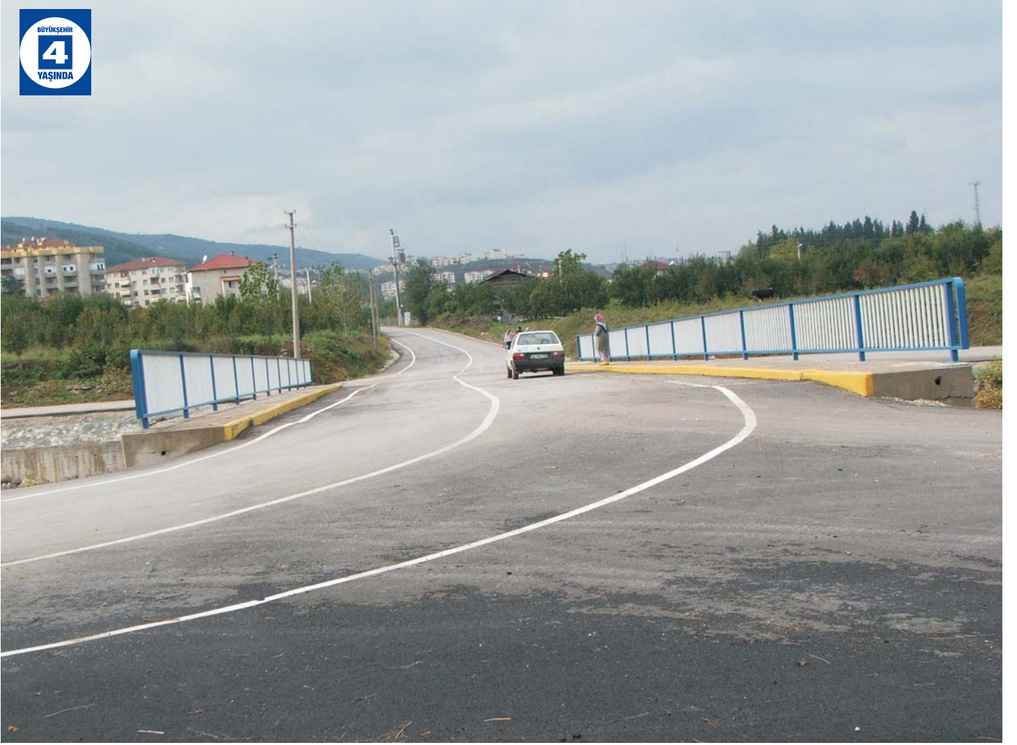
Hisareyn ve Yazlık'ta Yenilenen Caddeler