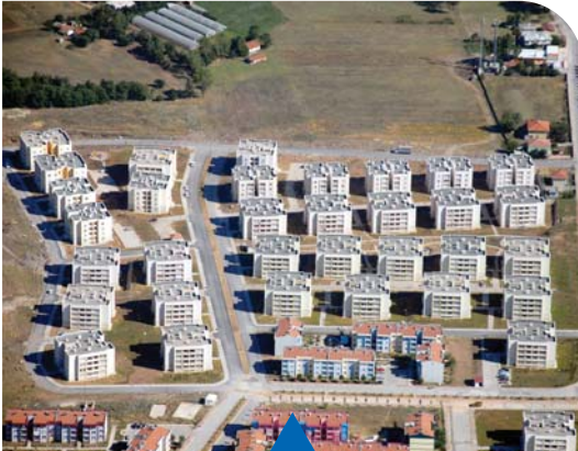
MESELA ARSLANBEY TAÇYAPRAK EVLERİ