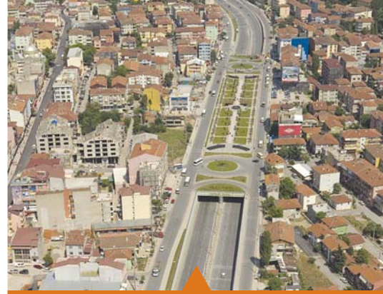
MESELA DERİNCE TÜNEL GEÇİŞİ