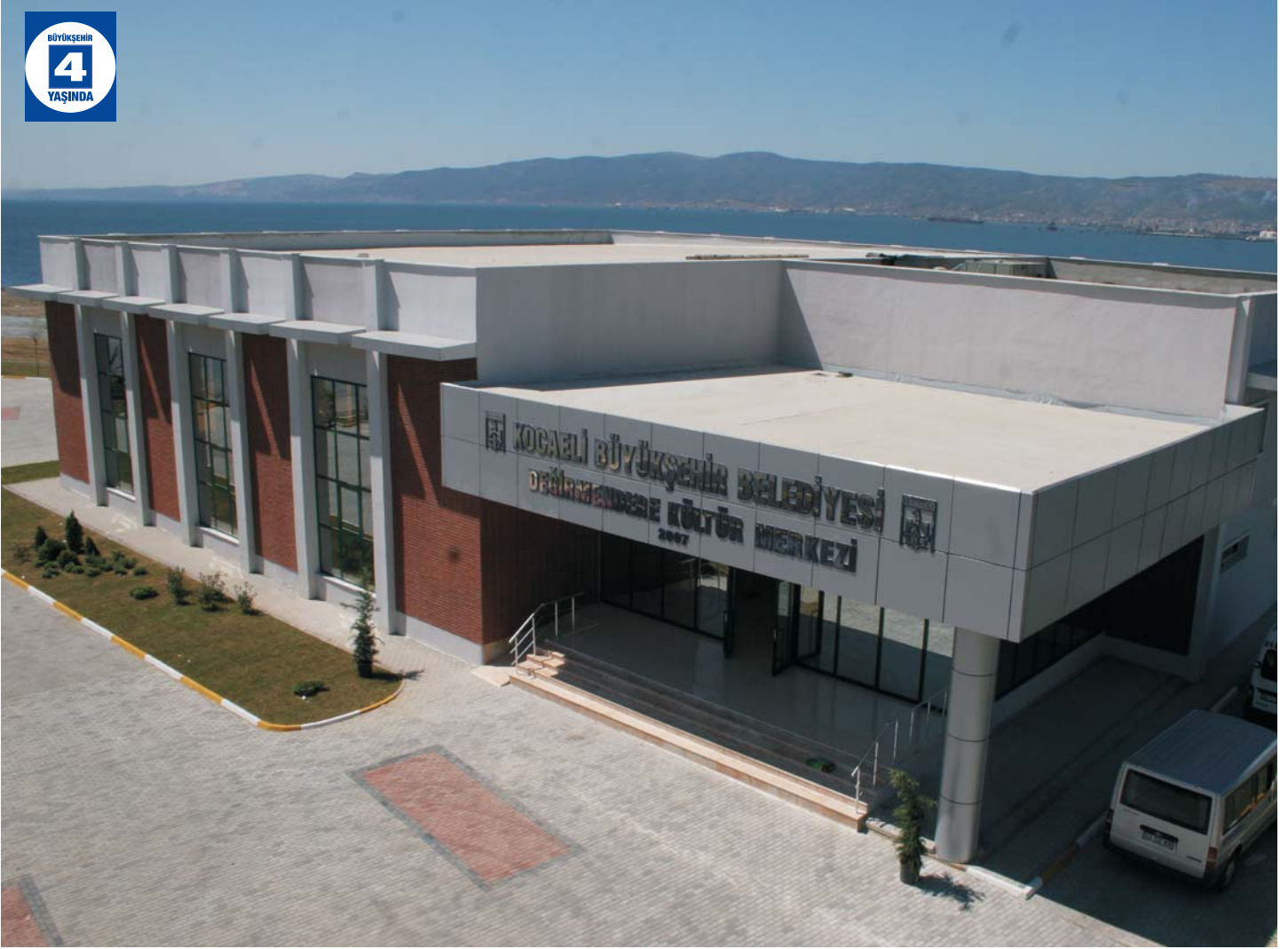
Değirmendere Kültür Merkezi