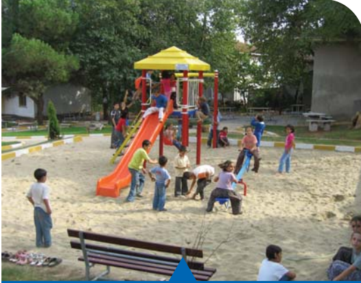
MESELA OYUN GRUPLARI