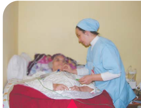
MESELA EVDE BAKIM