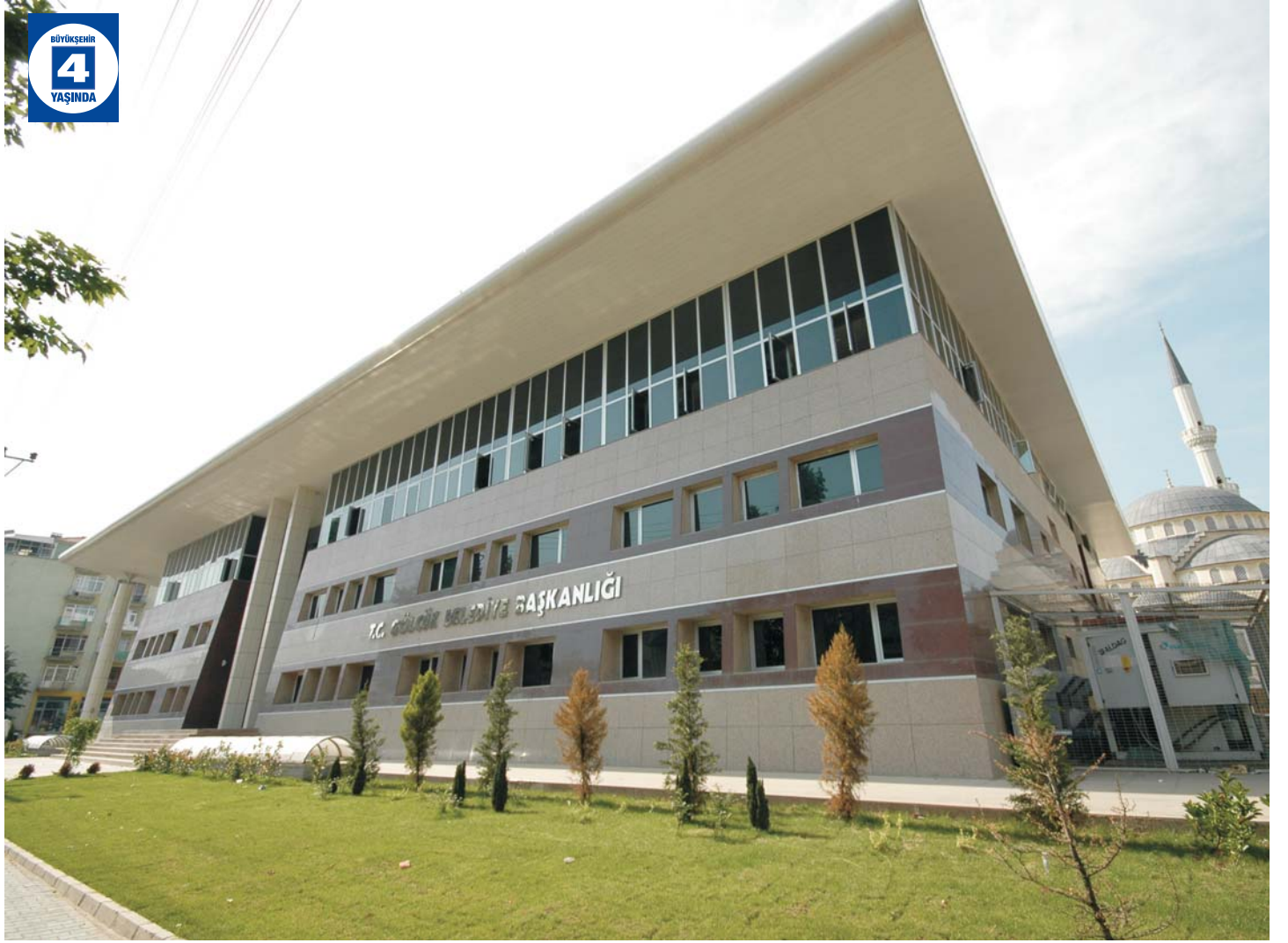
Gölcük Belediye Hizmet Binası