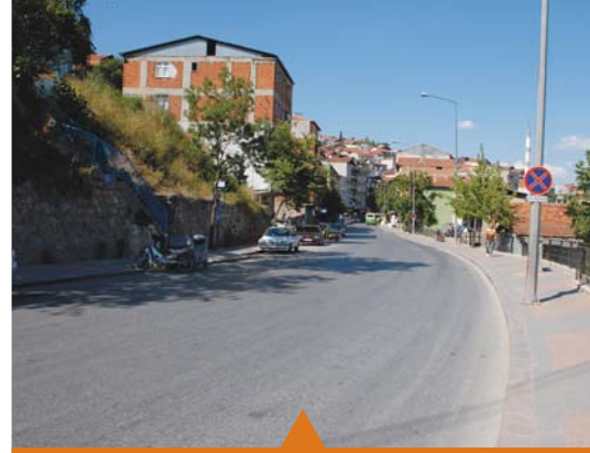
MESELA TURAN GÜNEŞ CADDESİ