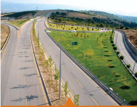
MESELA UMUTTEPE DUBLE YOLU