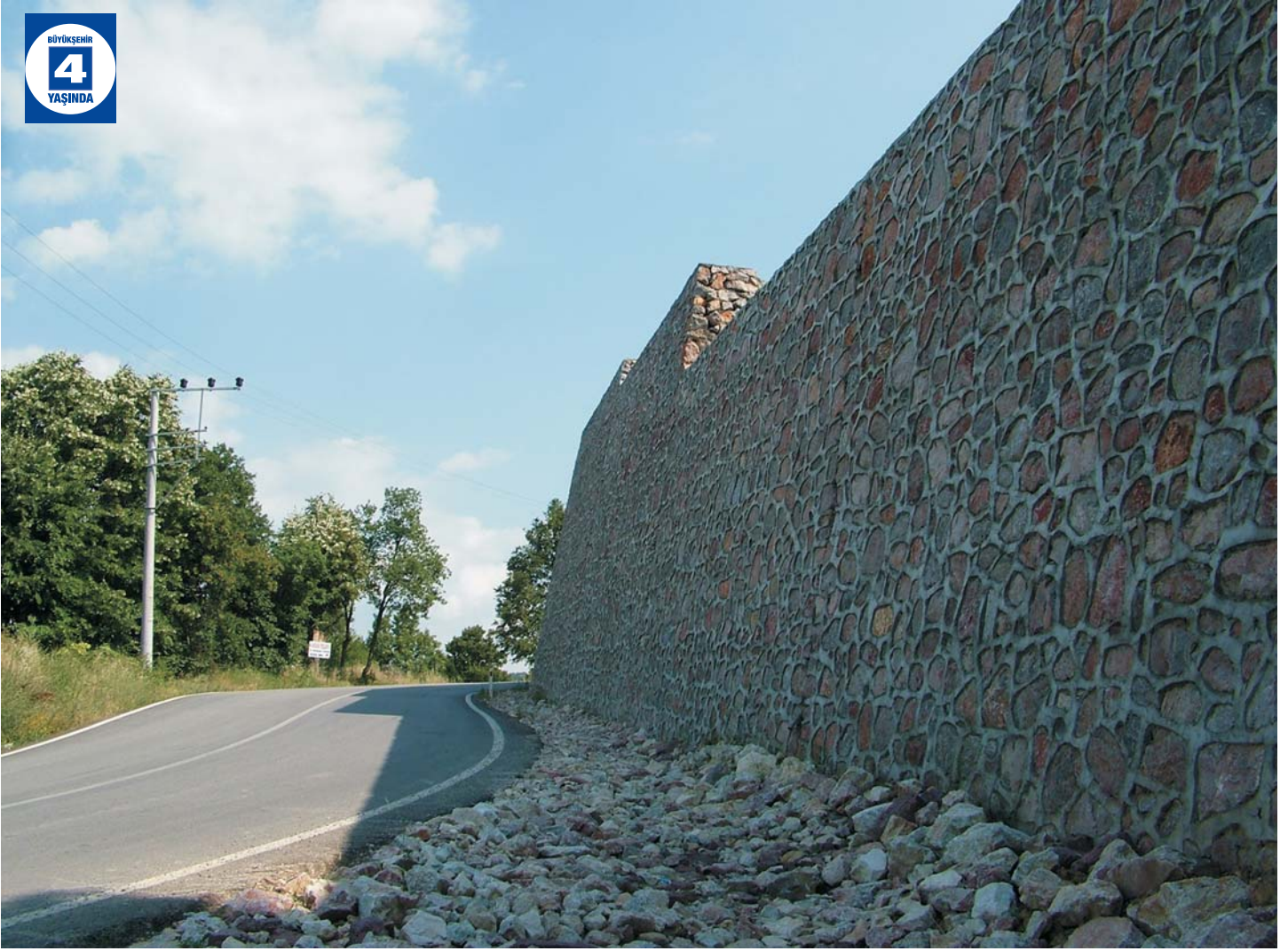
İhsaniye - Hamidiye Yolu