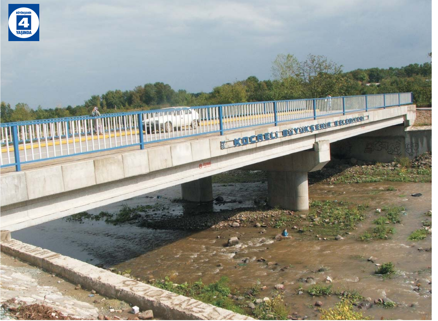
Hisareyn - İhsaniye Köprüsü