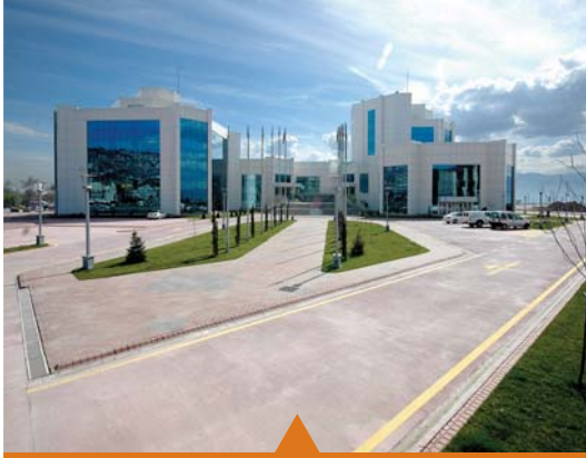
MESELA BÜYÜKŞEHİR HİZMET BİNASI