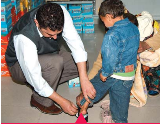
MESELA SEVGİ MAĞAZALARI