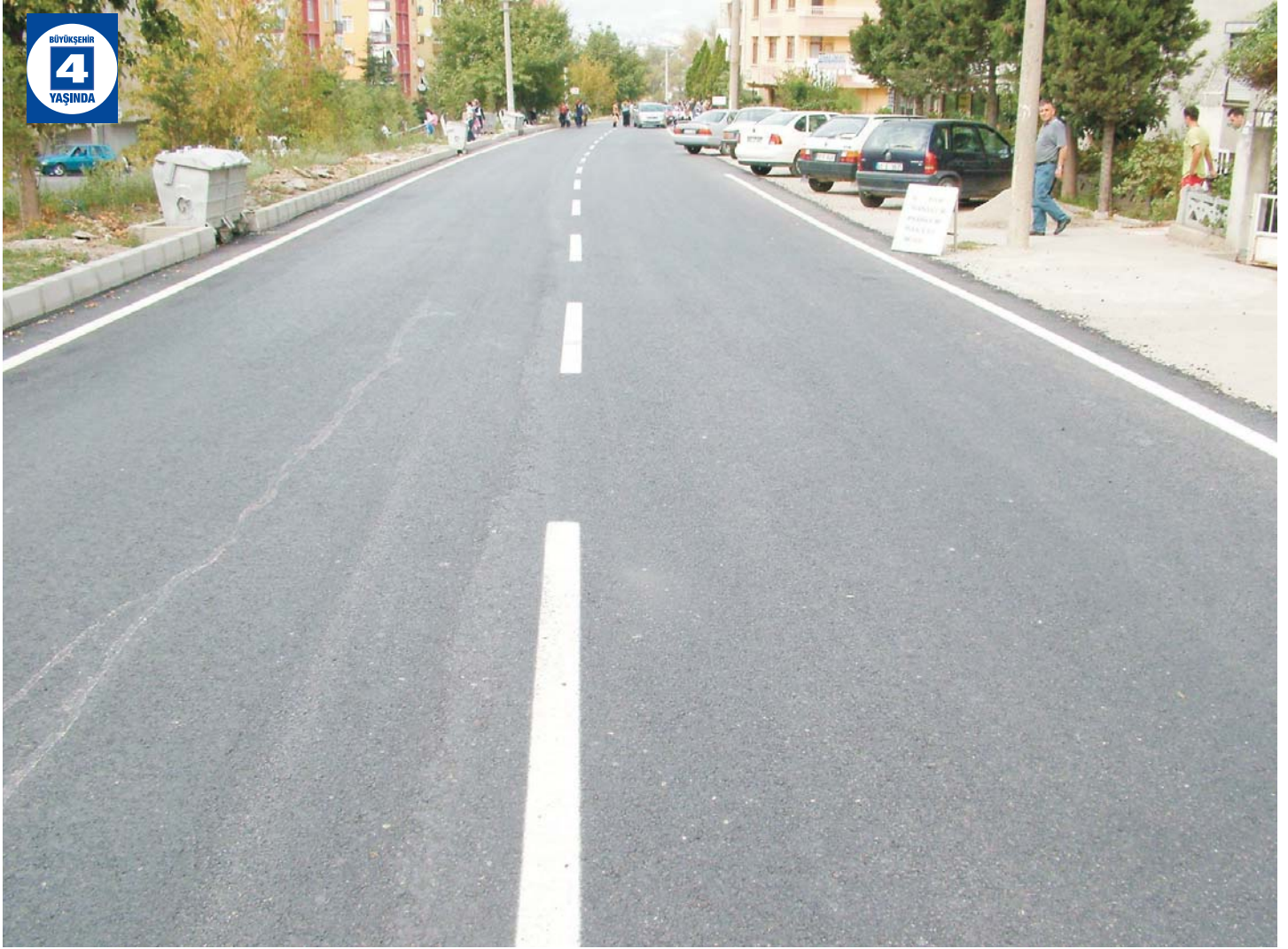
Değirmendere'de Yenilenen Caddeler