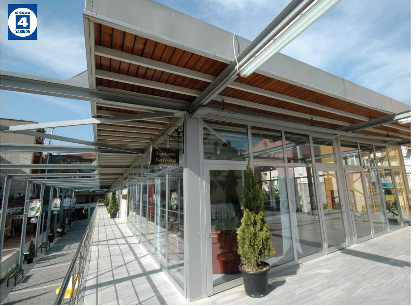
Gölcük Sanat Galerisi