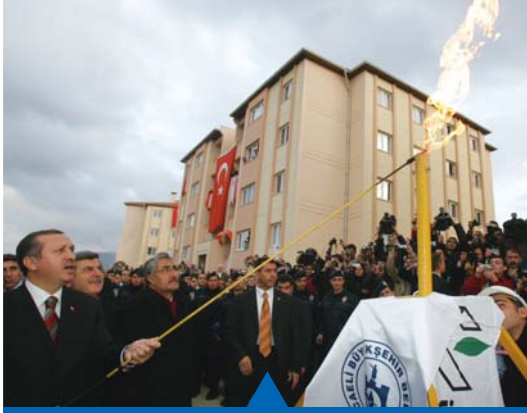
MESELA DOĞALGAZ YATIRIMLARI