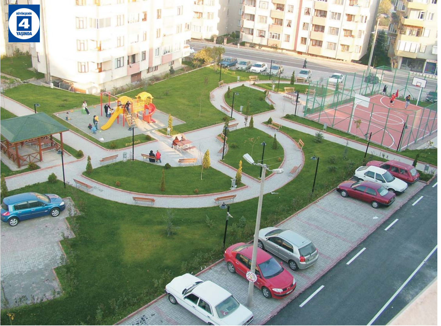
Değirmendere Seyit Onbaşı Parkı