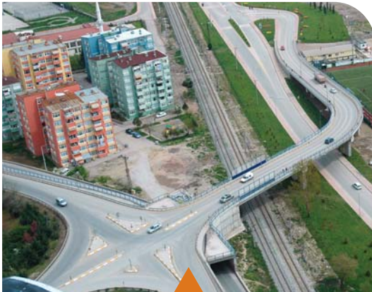
MESELA MEVLANA KÖPRÜLÜ KAVŞAĞI