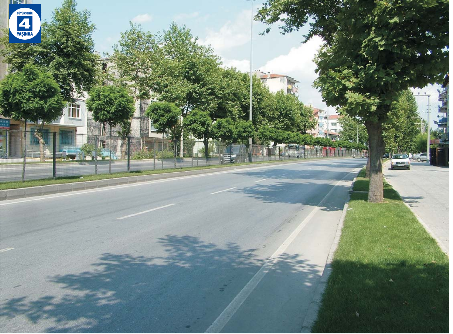
Gölçük Şehir İçi Geçiş Yolu Düzenlemesi