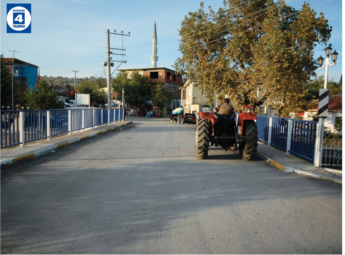
Yalakdere Menfez Köprüsü