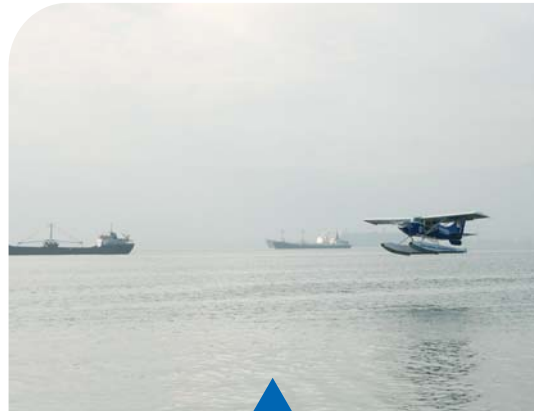
MESELA DENİZ DENETİMİ