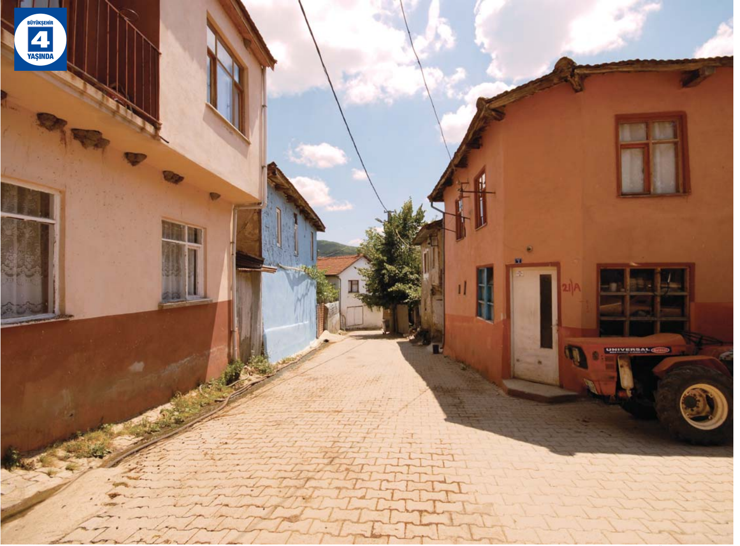
Akçat Üstyapı Düzenlemesi