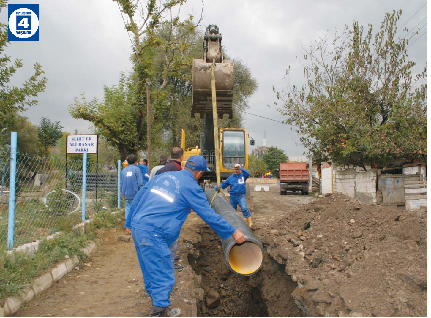
Karamürsel Altyapı Çalışmaları