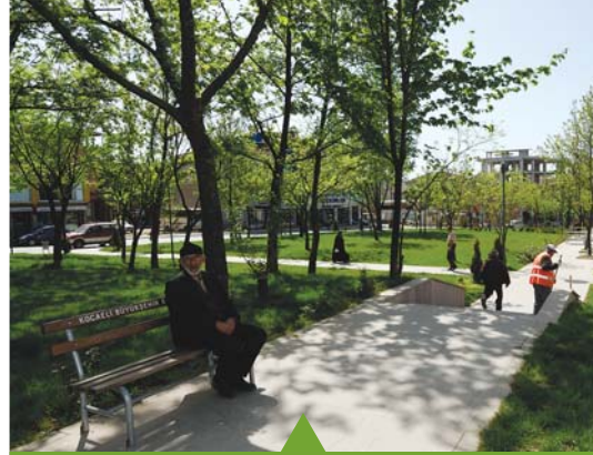
MESELA GEBZE EŞREF BİTLİS PARKI