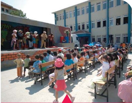
MESELA TİR TİYATROSU