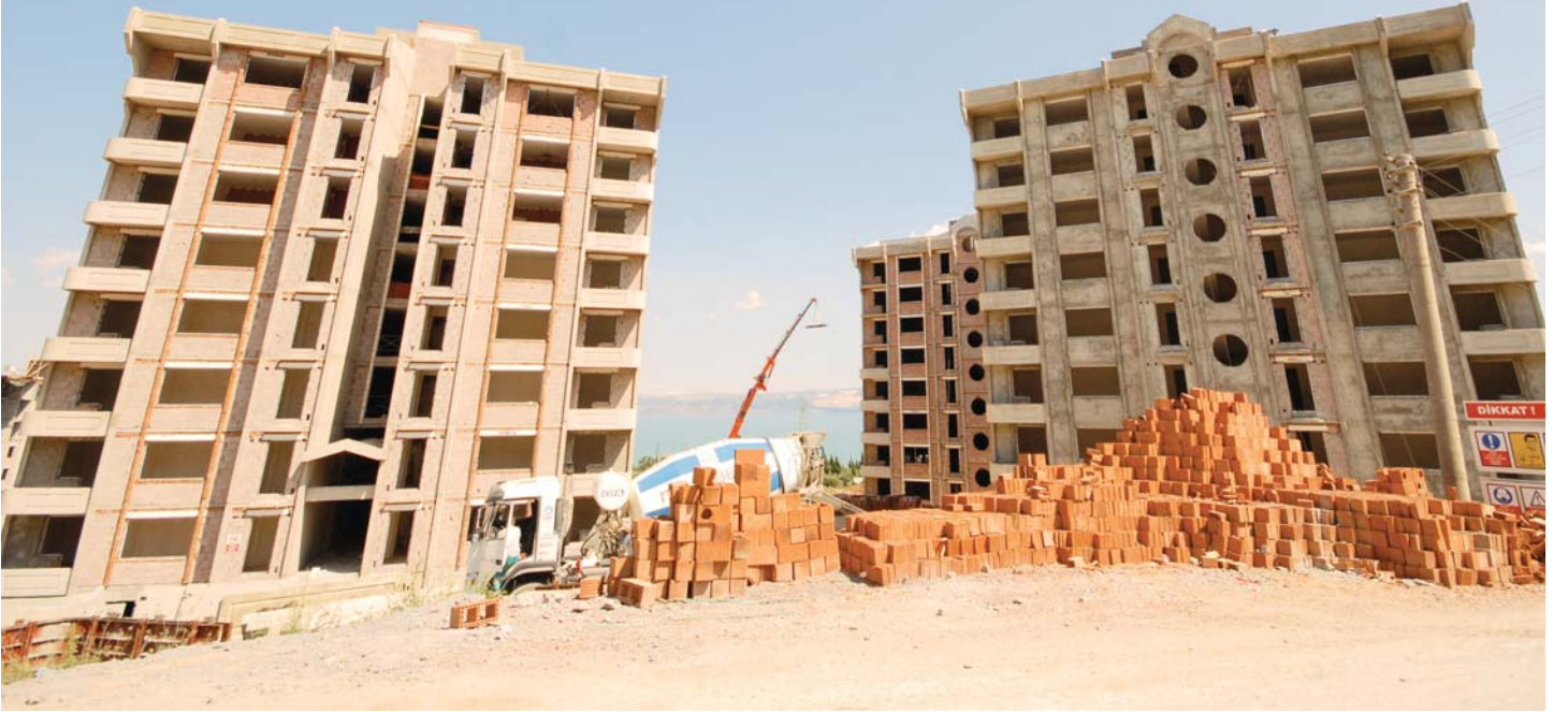
Karamürsel Merkez Kent Konutları