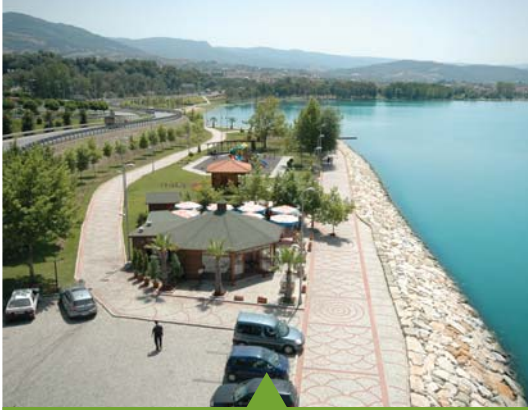
MESELA BAŞISKELE SAHİL PARKI