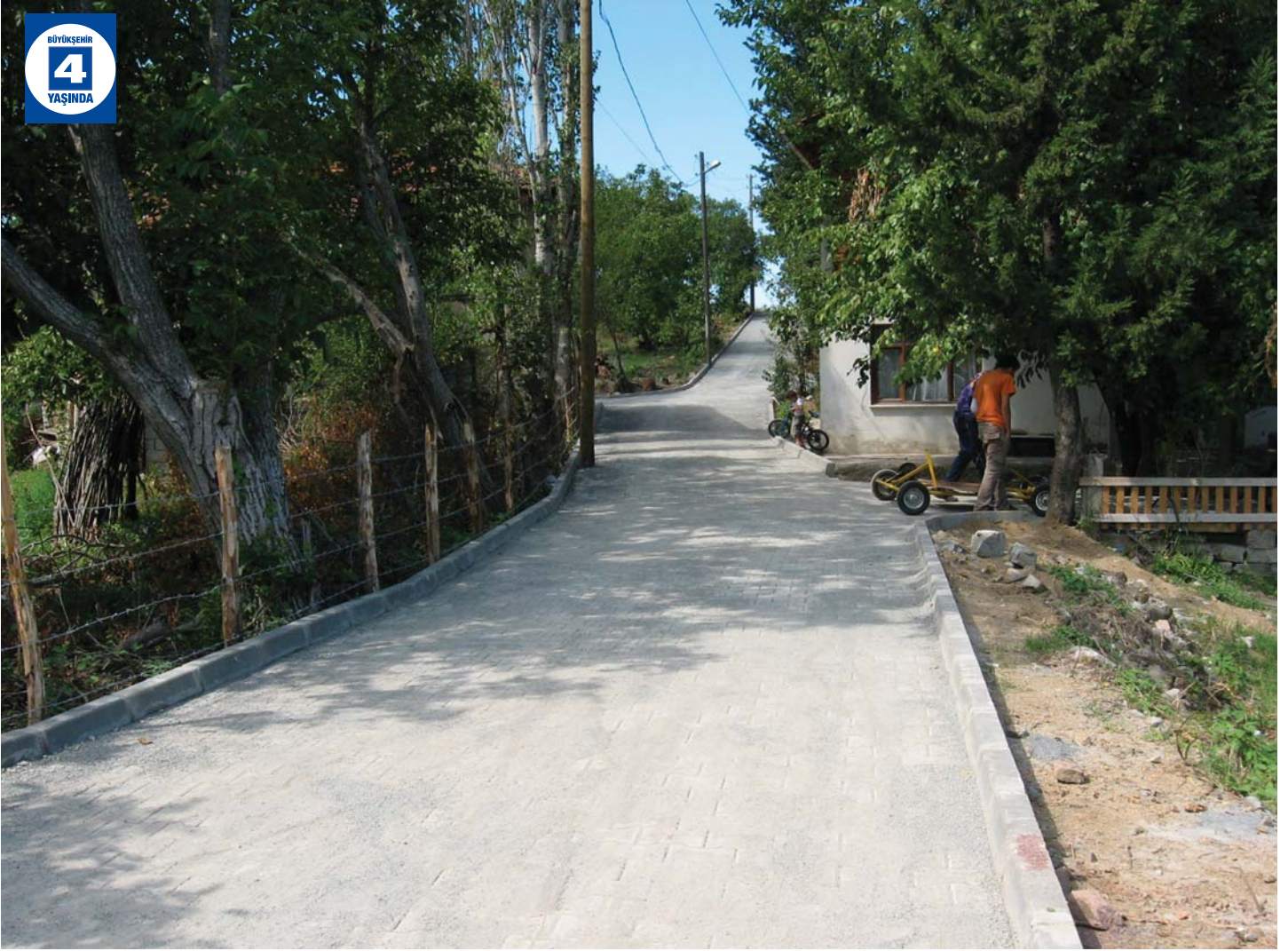
Köylerde Çevre Düzenlemesi