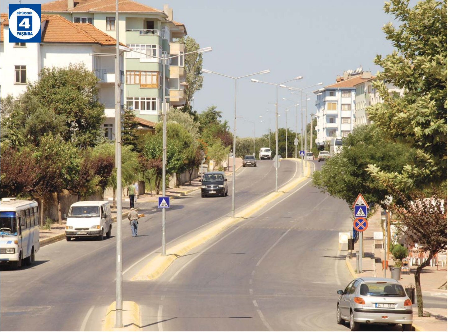
Karamürsel İznik Yolu Altyapı ve Üstyapı Düzenlemesi