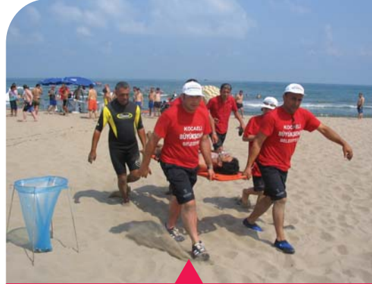
MESELA SAHİL GÜVENLİK