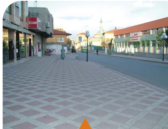
MESELA DENİZCİLER CADDESİ