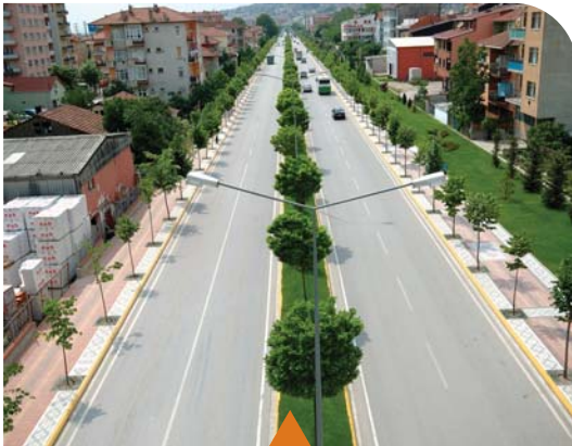
MESELA ŞEHİT RAFET KARACAN BULVARI