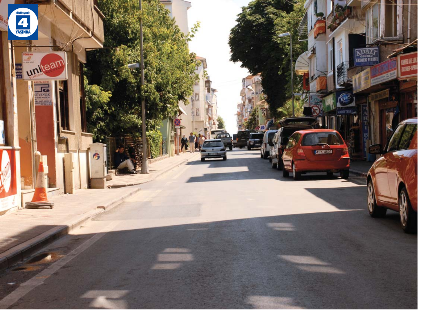
Karamürsel'de Yenilenen Caddeler