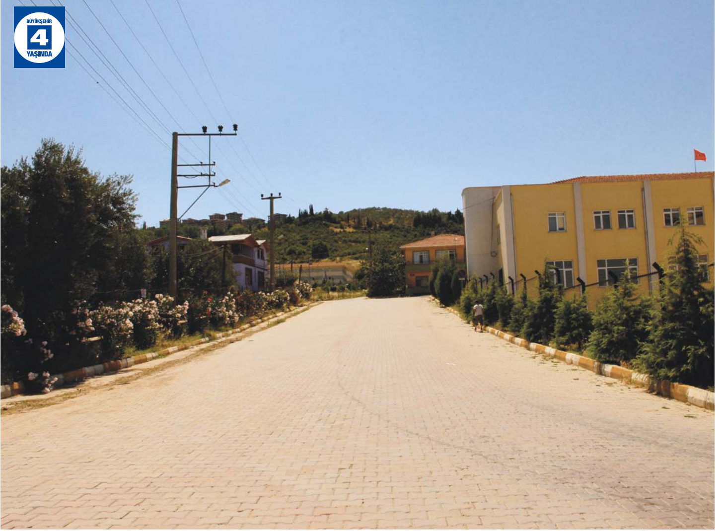
Dereköy Üstyapı Düzenlemesi