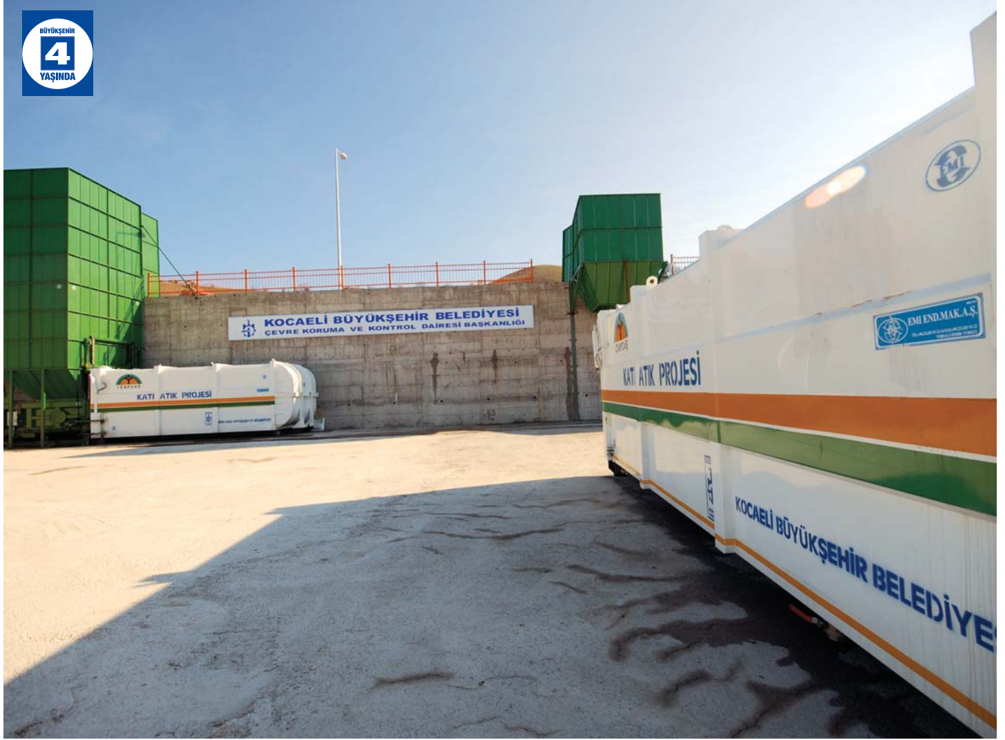
Dereköy Atık Transfer İstasyonu