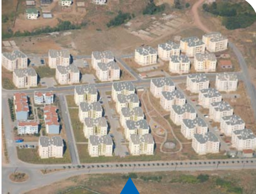
MESELA ARSLANBEY TAÇYAPRAK EVLERİ