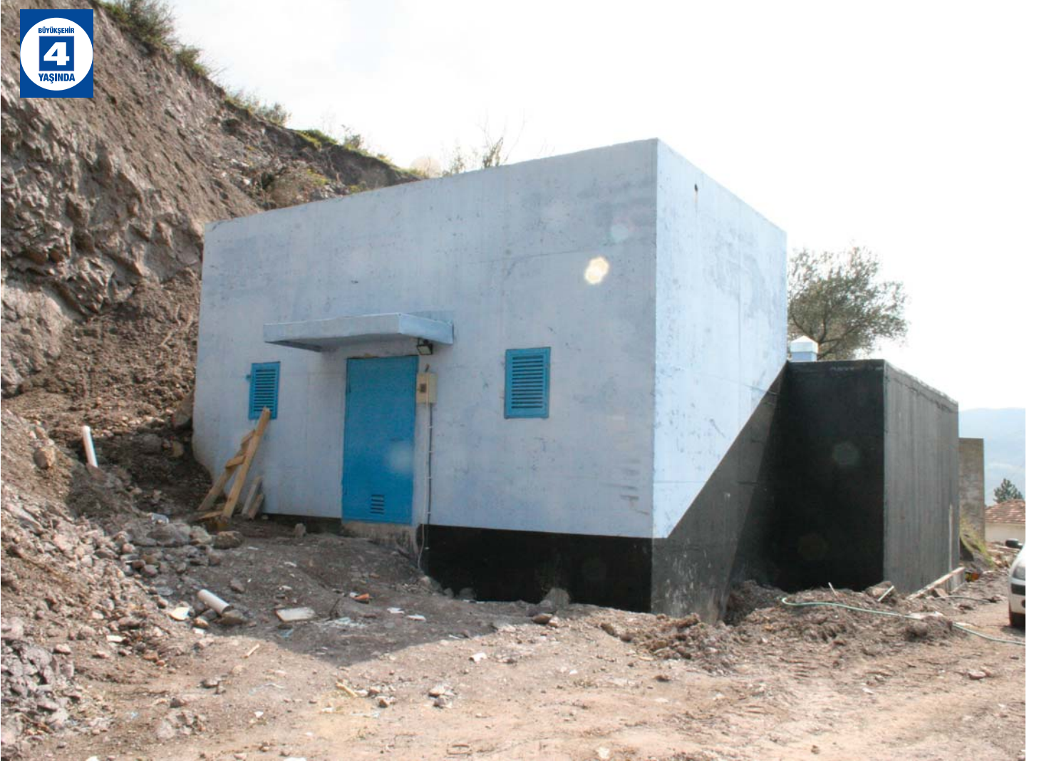
Akçat İçme Suyu Hattı ve Su Deposu