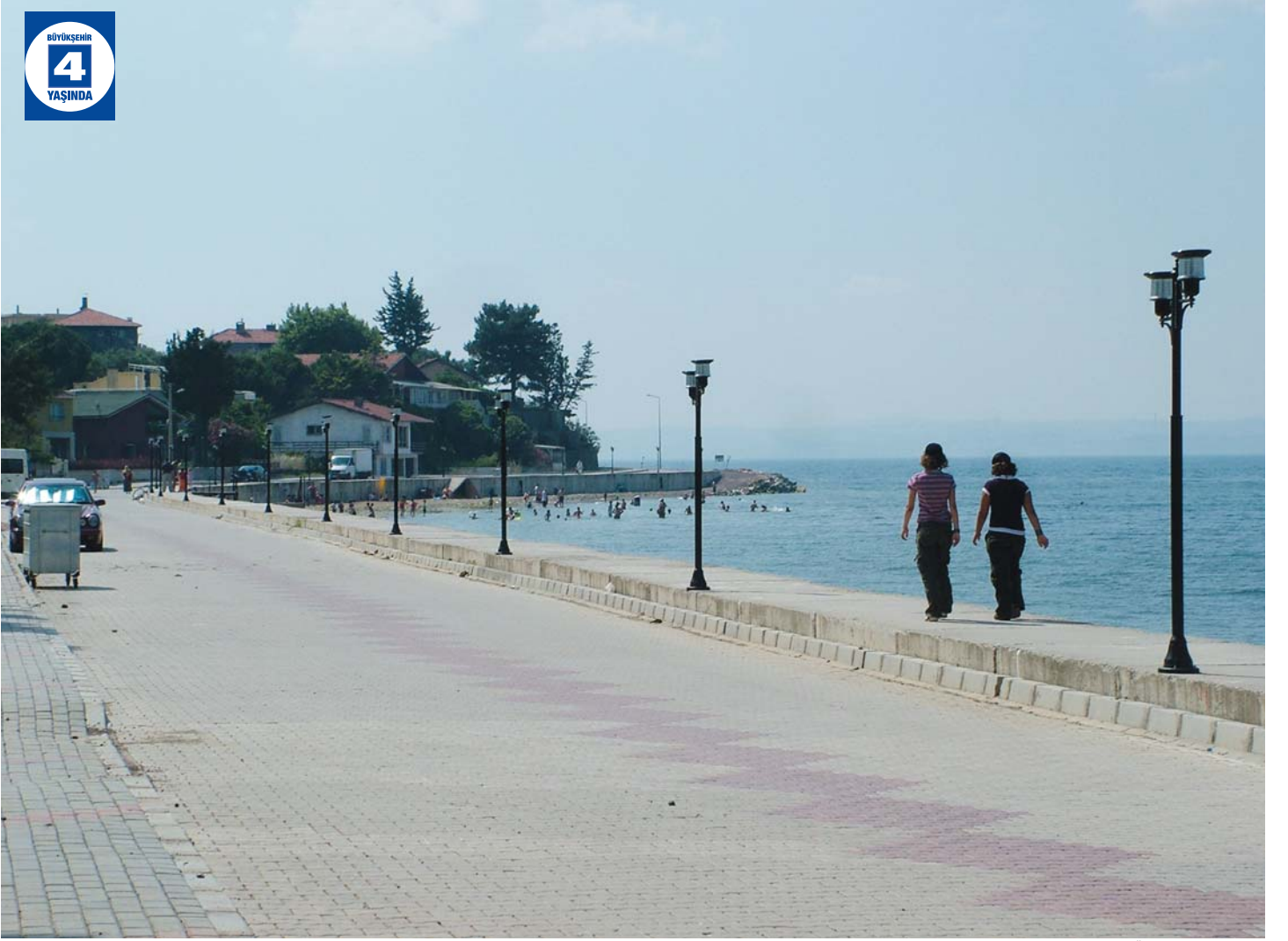
Ereğli Üstyapı Düzenlemesi