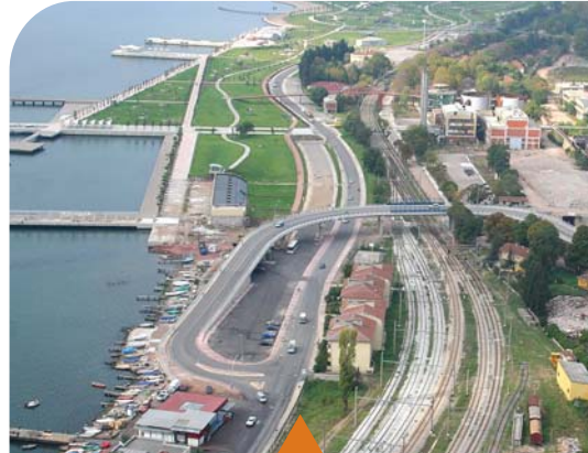
MESELA SEKA KÖPRÜLÜ KAVŞAĞI