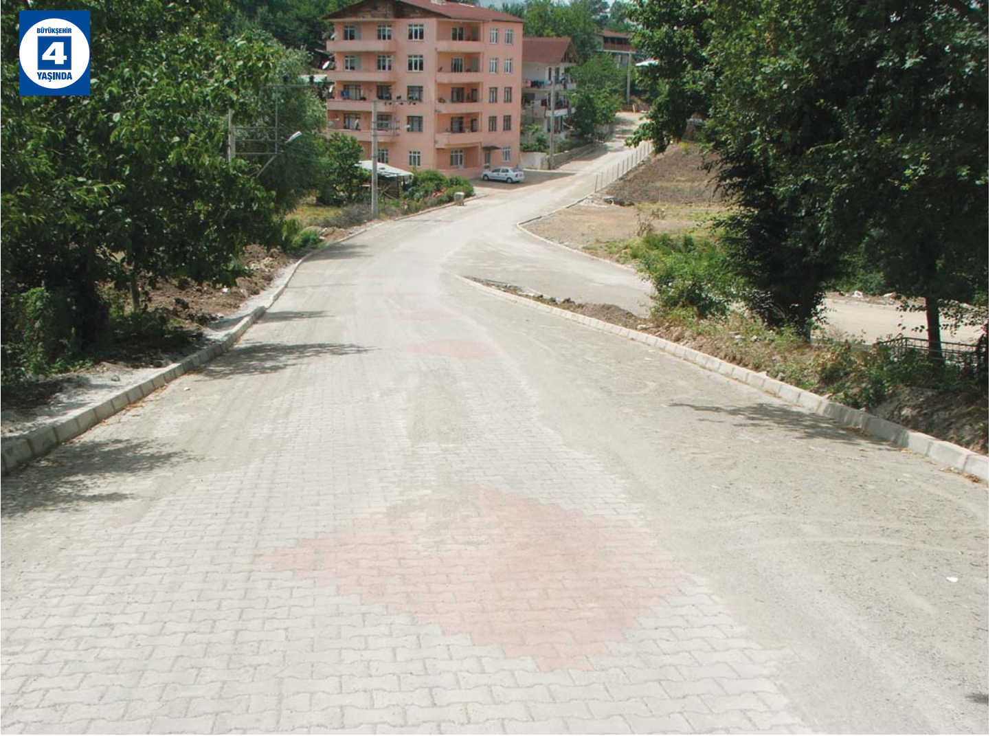
Kızderbent Bahçe ve Sokaklarına Asfalt Yama Yapımı