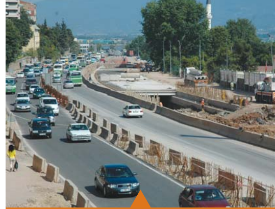
MESELA SEKA TÜNEL GEÇİŞİ