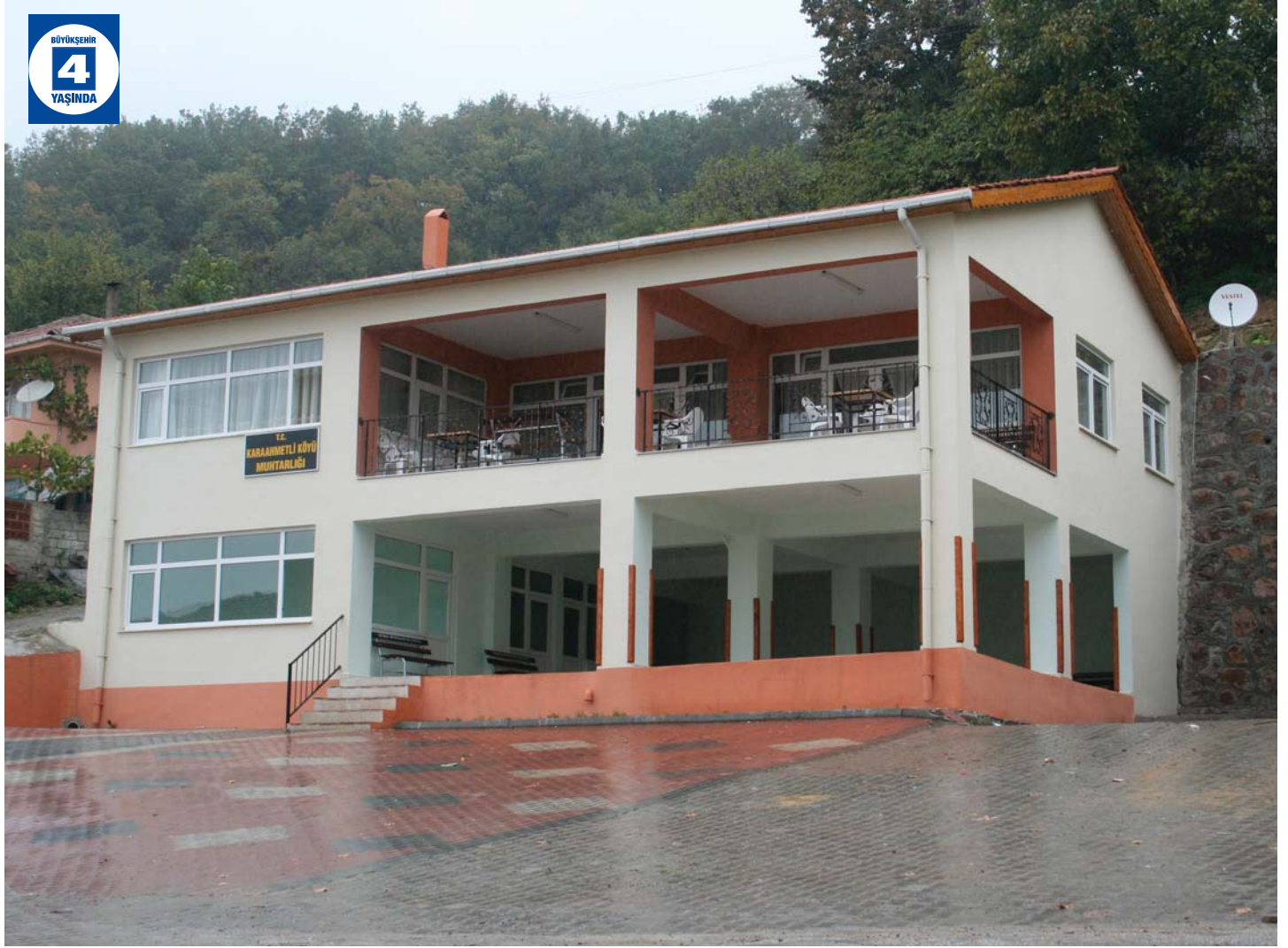
Karahmetli Köyü Sebze ve Meyve Mezati