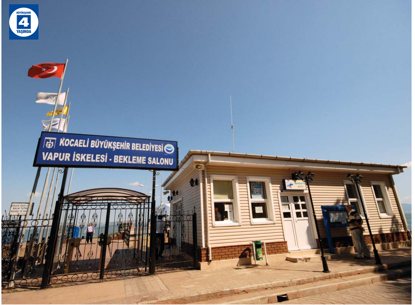
Karamürsel İskelesi ve Bekleme Salonu