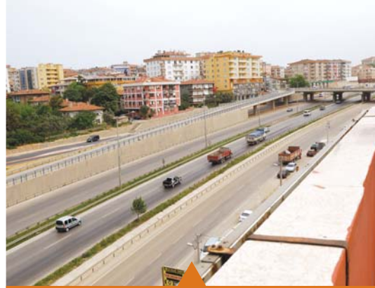
MESELA GEBZE TATLIKUYU KAVŞAĞI