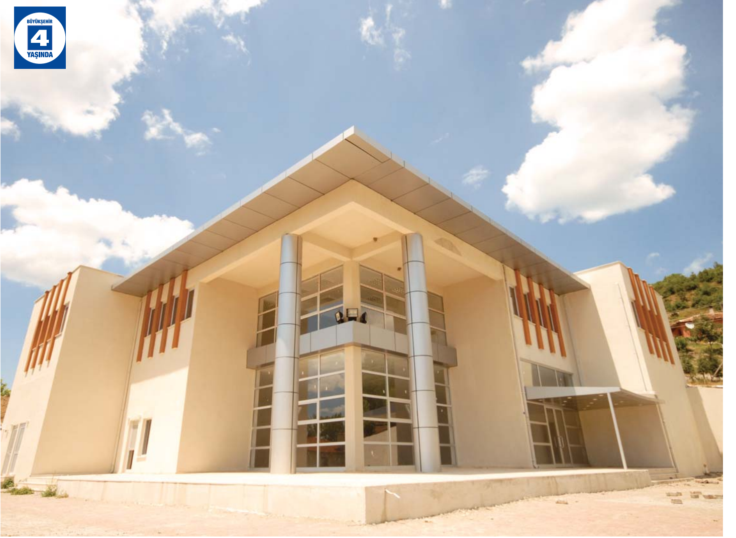
Akçat Eğitim ve Kültür Merkezi