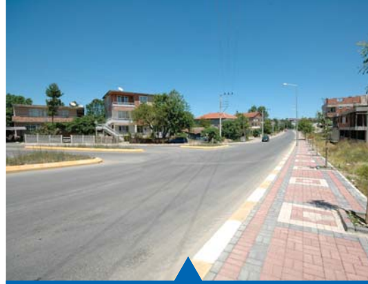
MESELA KÖRFEZ HAYAT YOLU