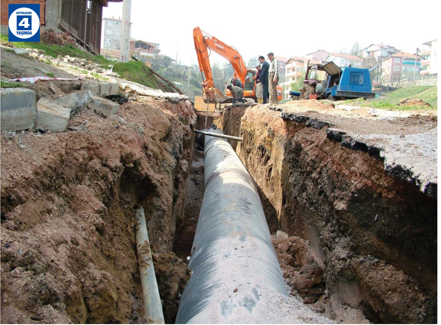
Karamürsel - Gölcük İçme Suyu Hattı