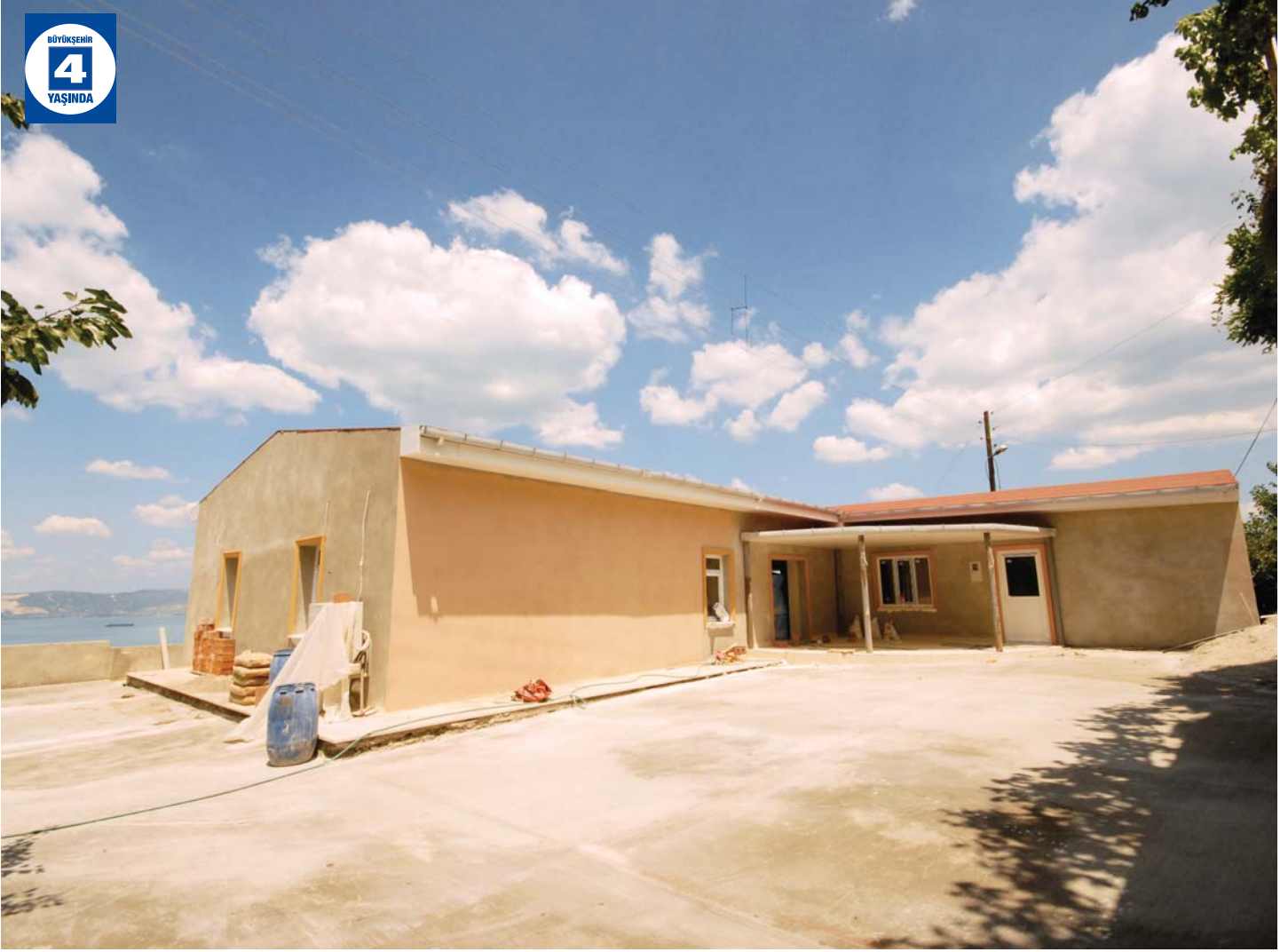
Tepeköy Düğün Salonu