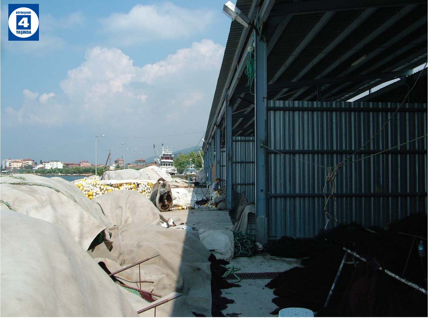
Ereğli Balıkçı Ağı Depolama Alanı