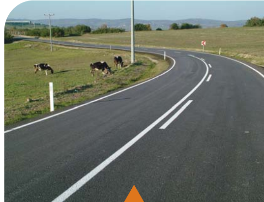
MESELA DELİVELİ-AKÇAOVA YOLU