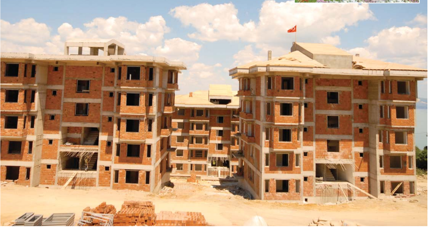
Karamürsel Gazanferkent Konakları