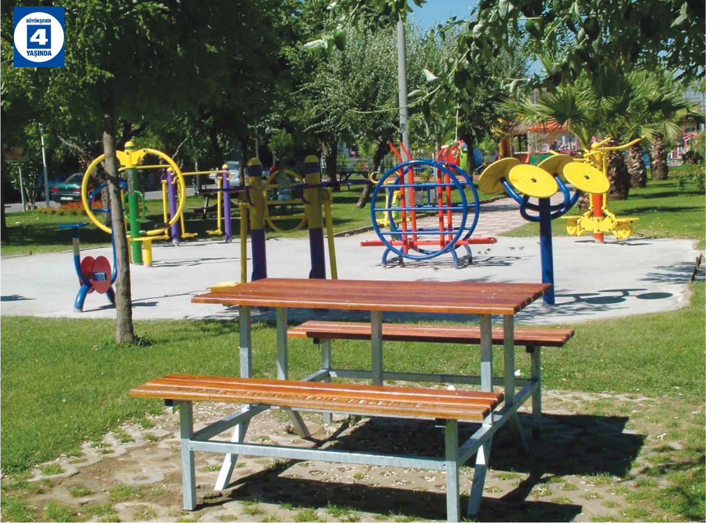
Karamürsel Sahil Düzenlemesi