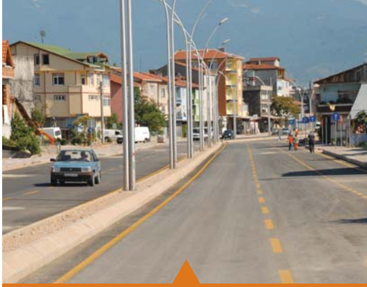
MESELA ADNAN MENDERES (KANALBOYU) BULVARI