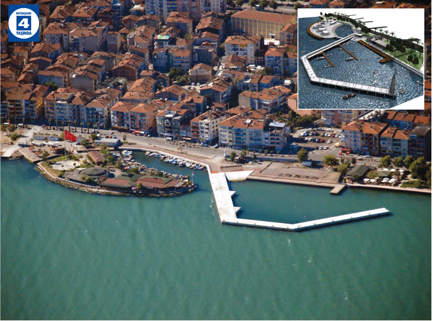
Karamürsel Yelken İskelesi