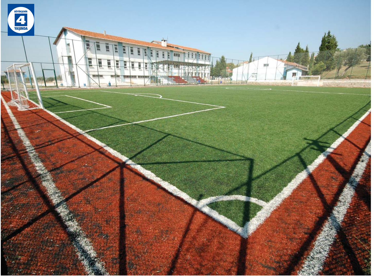
Karamürsel Endüstri Meslek Lisesi Halı Sahası