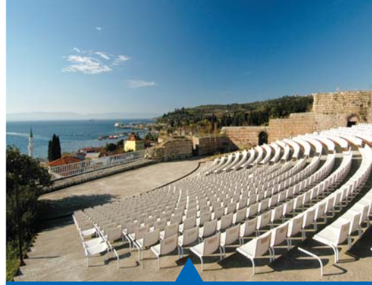
MESELA ESKİHİSAR KALESİ