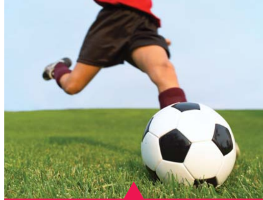
MESELA AMATÖR KULÜPLERE DESTEK