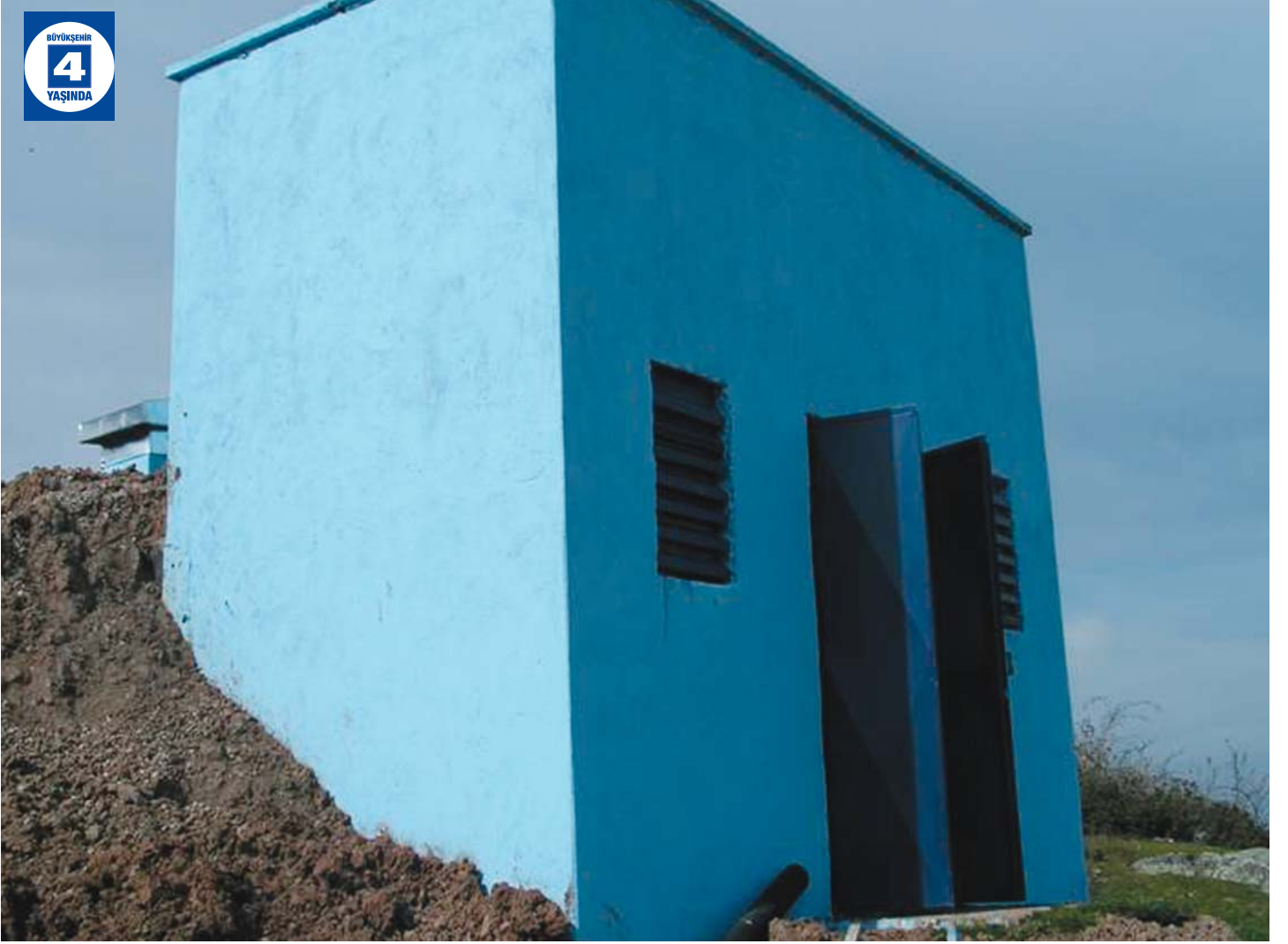
Köylerde İçme Suyu Yatırımı