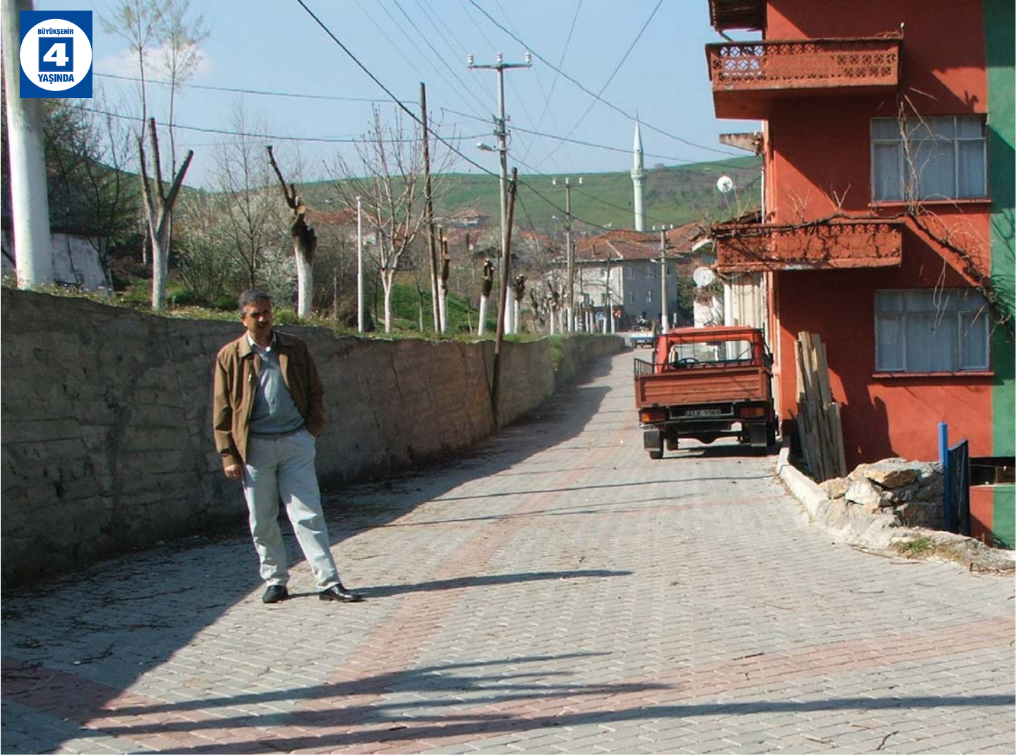
Kızderbent Üstyapı Düzenlemesi