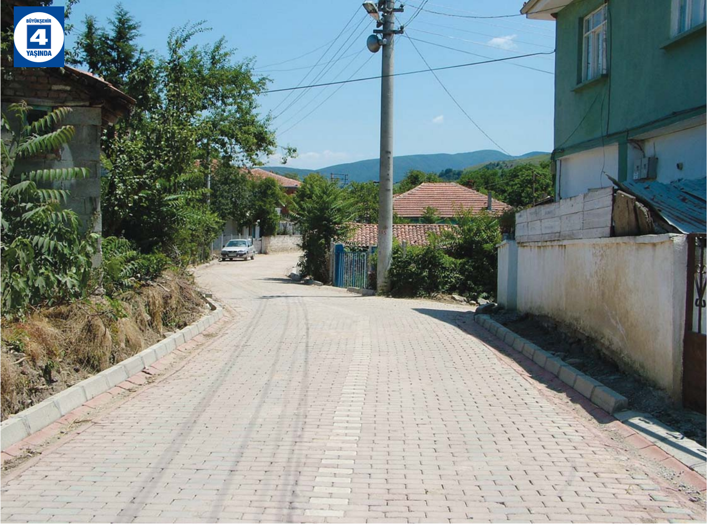
Yalakdere Üstyapı Düzenlemesi